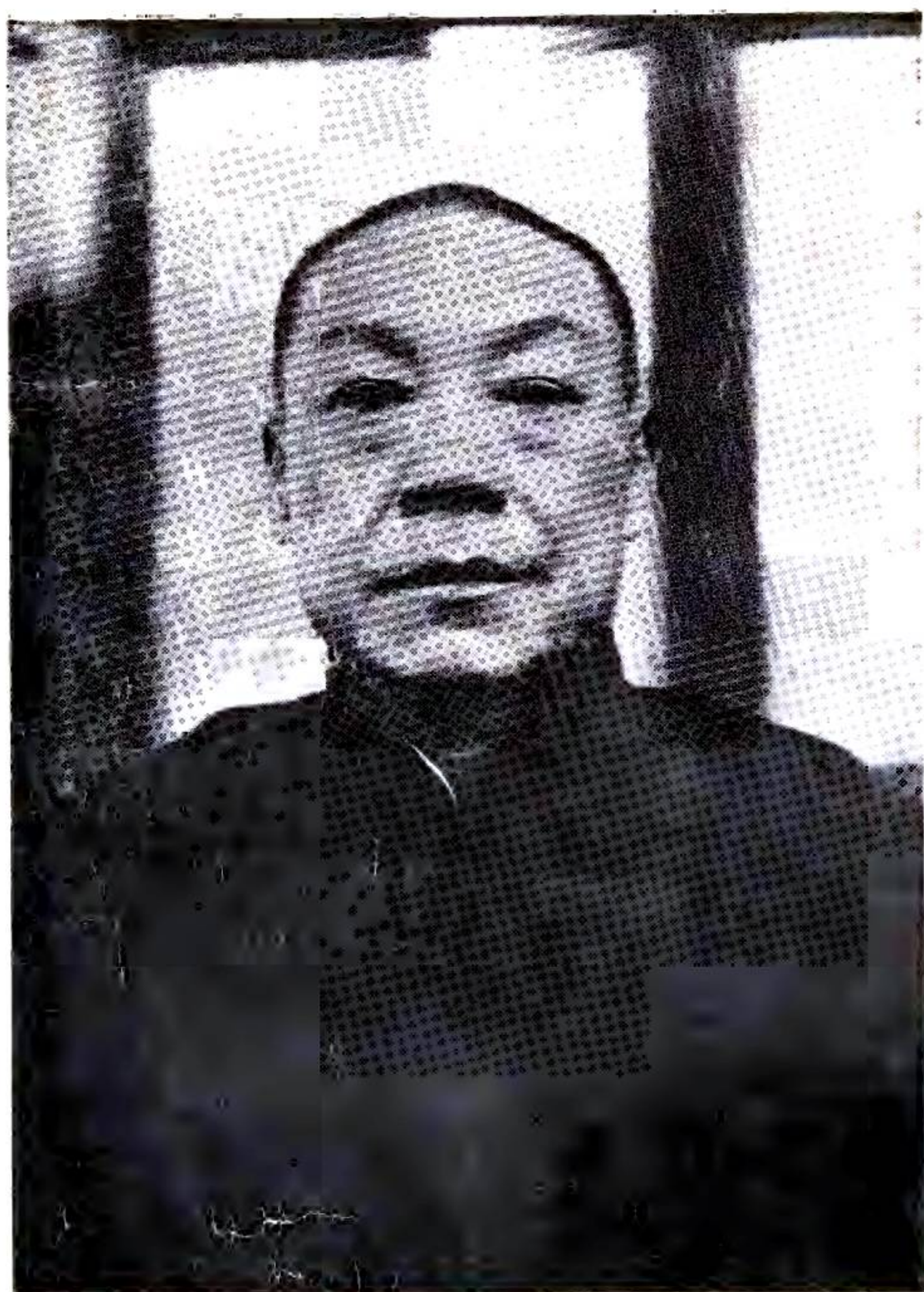
周 贊 長 省 吳 省 北 河