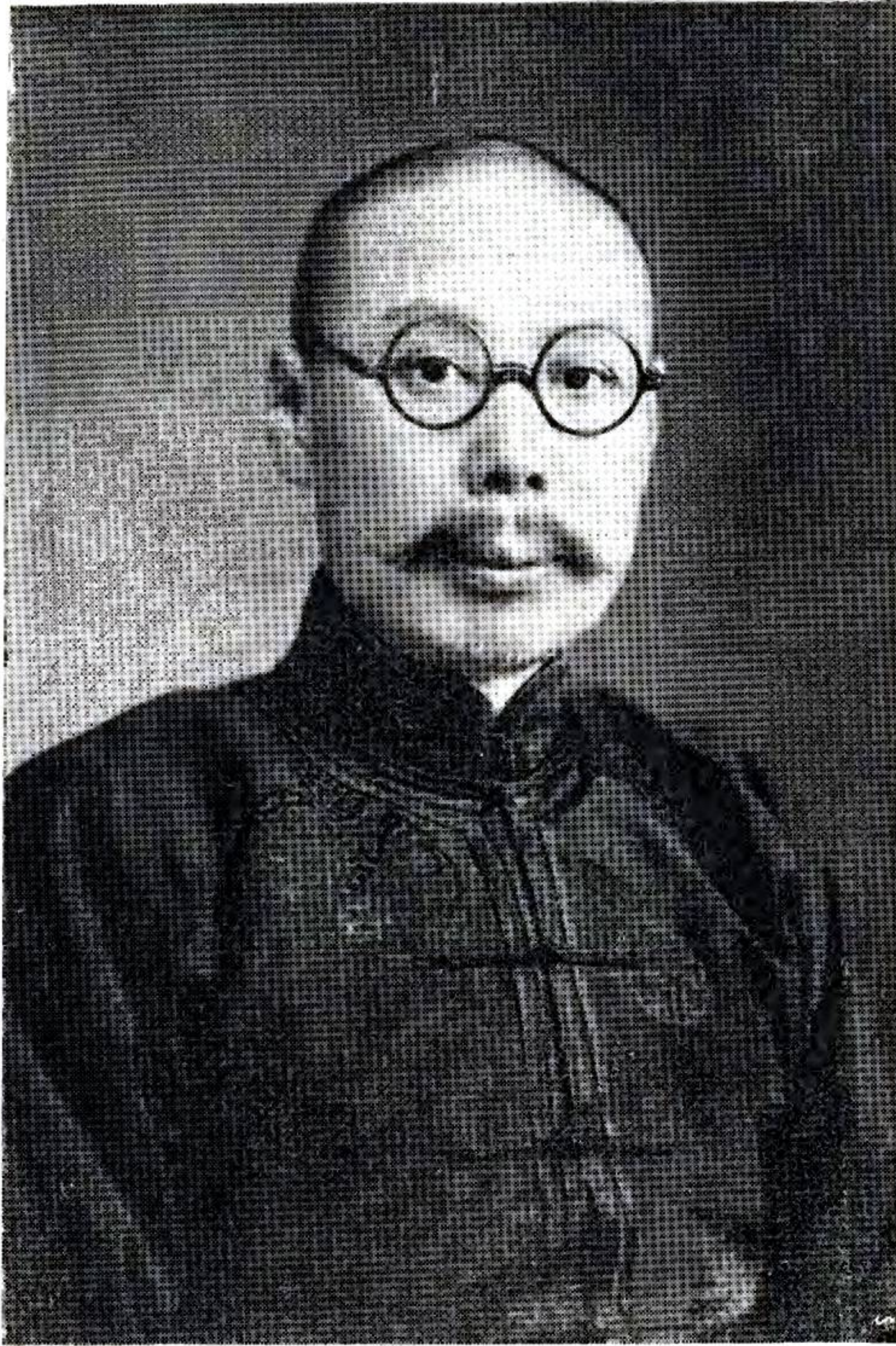
寶清縣長 齊 耀 斌