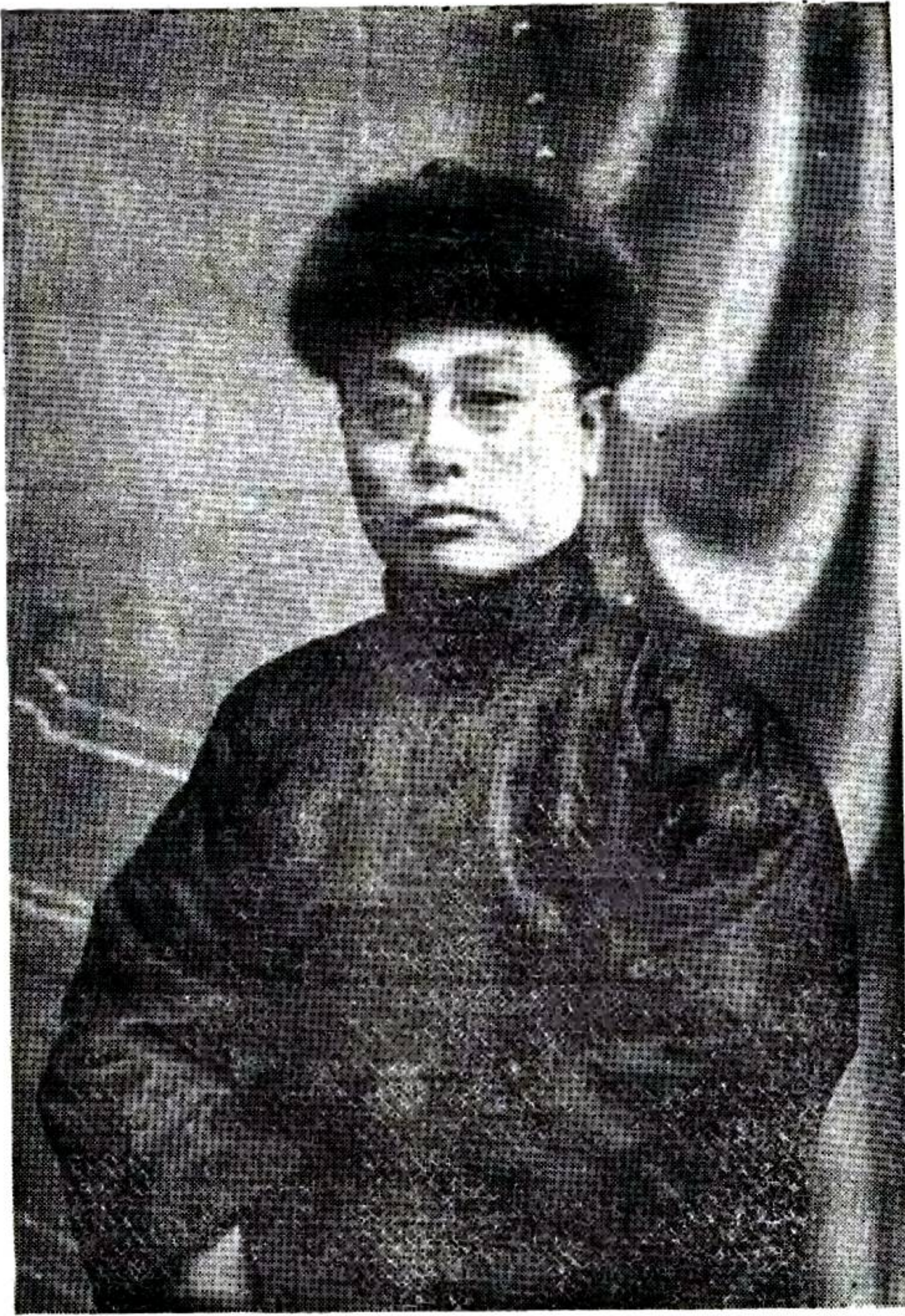
監 修 雙 城 縣 知 事 高 文 垣