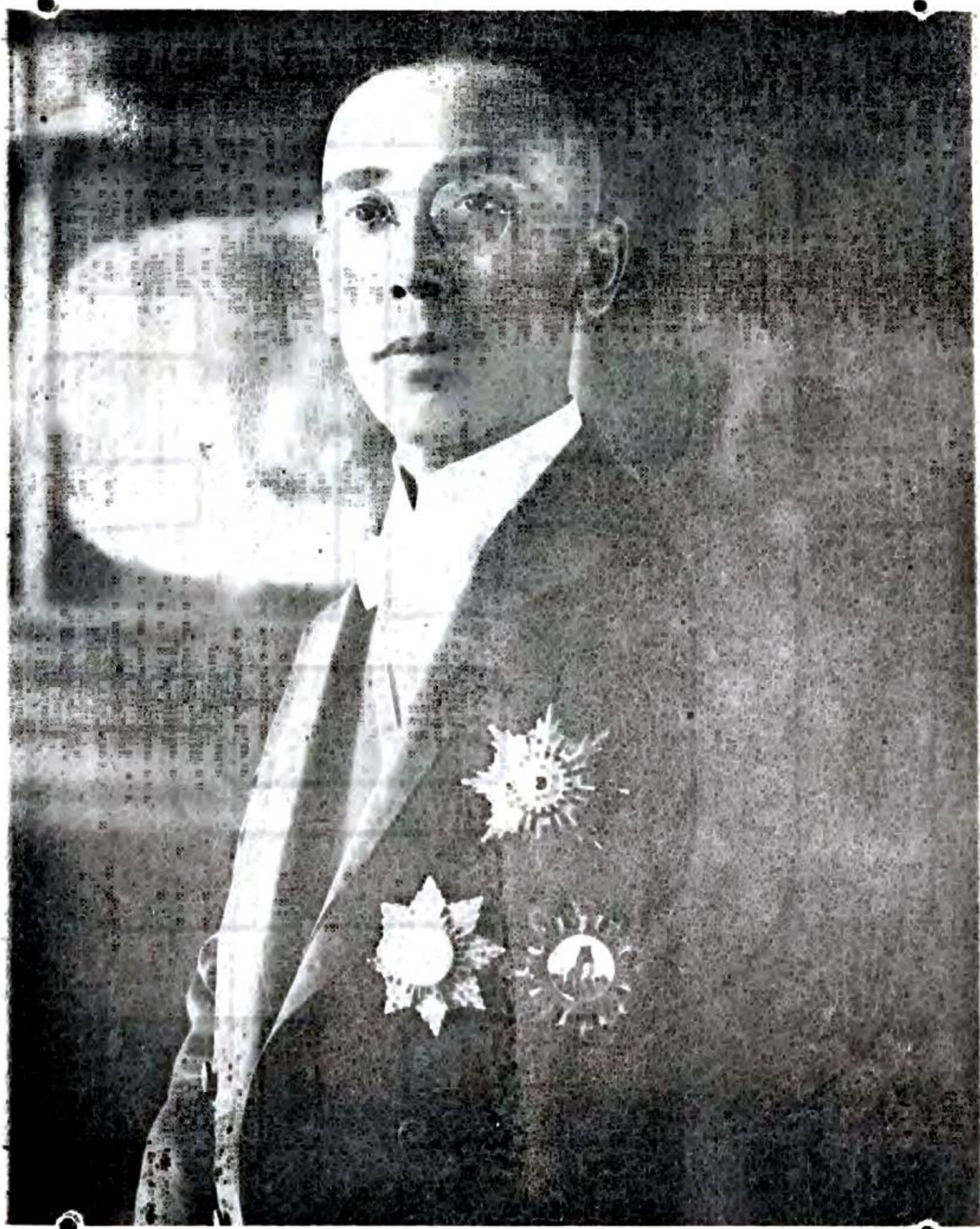
濱 江 道 尹 蔡 運 升