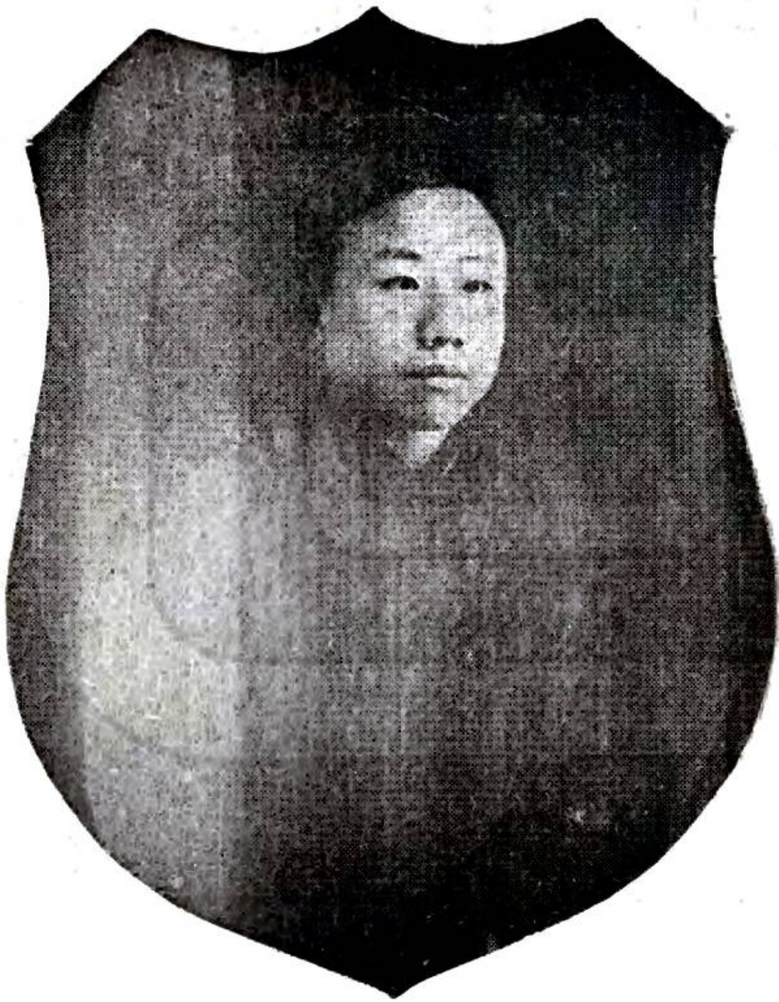
分 輯 張 瑱 書