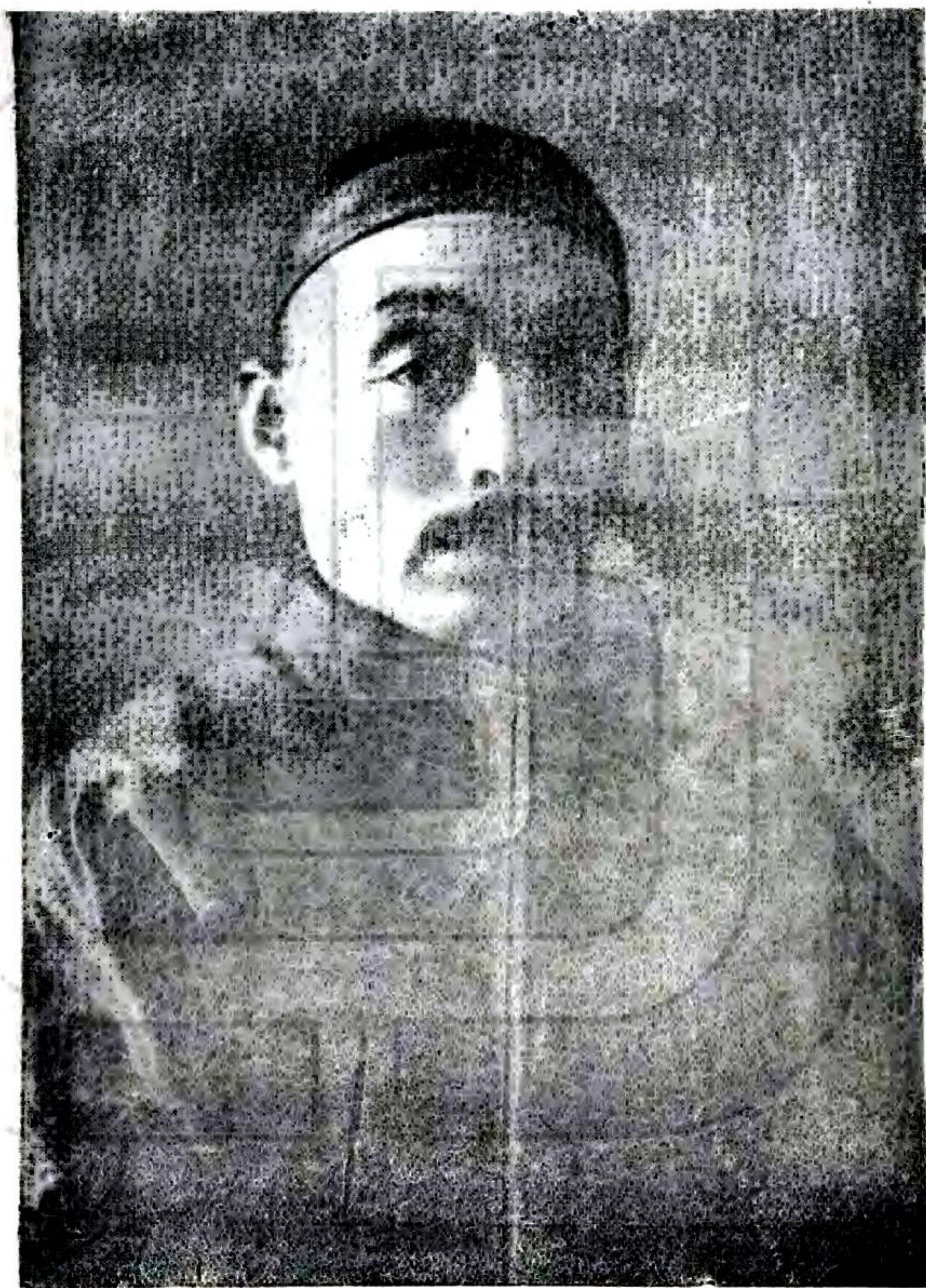
監 修 雙 城 縣 知 事 賈 迺 恭