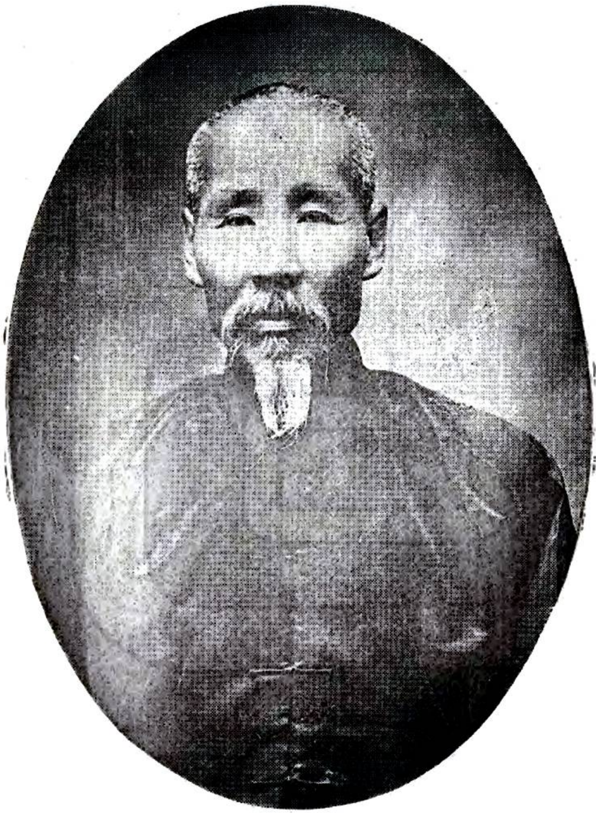
銘 藁 張 修 總