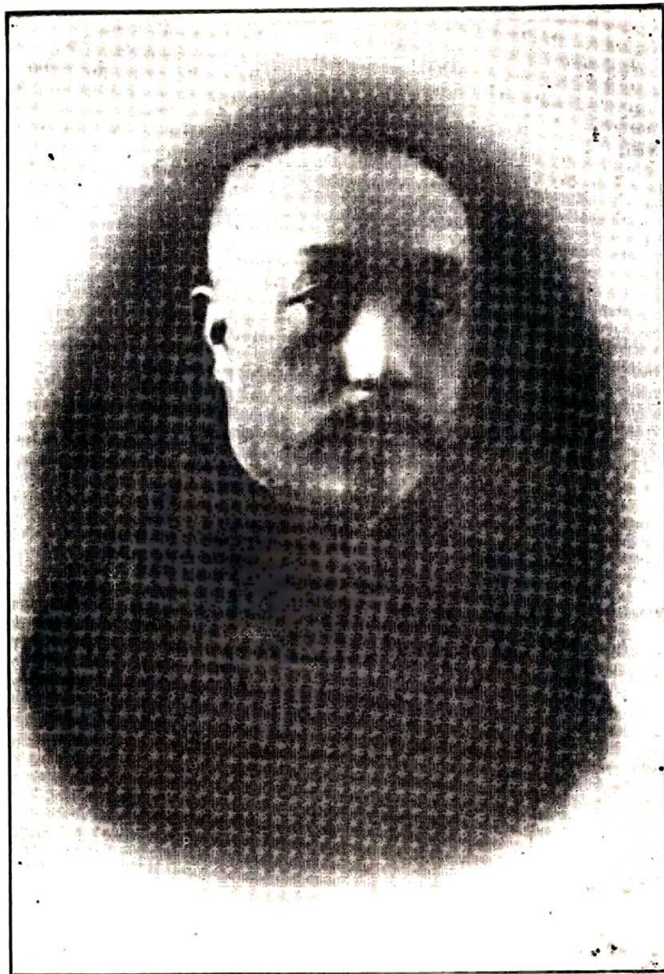
員委府政省林吉 像肖槐啓章長廳廳政民兼