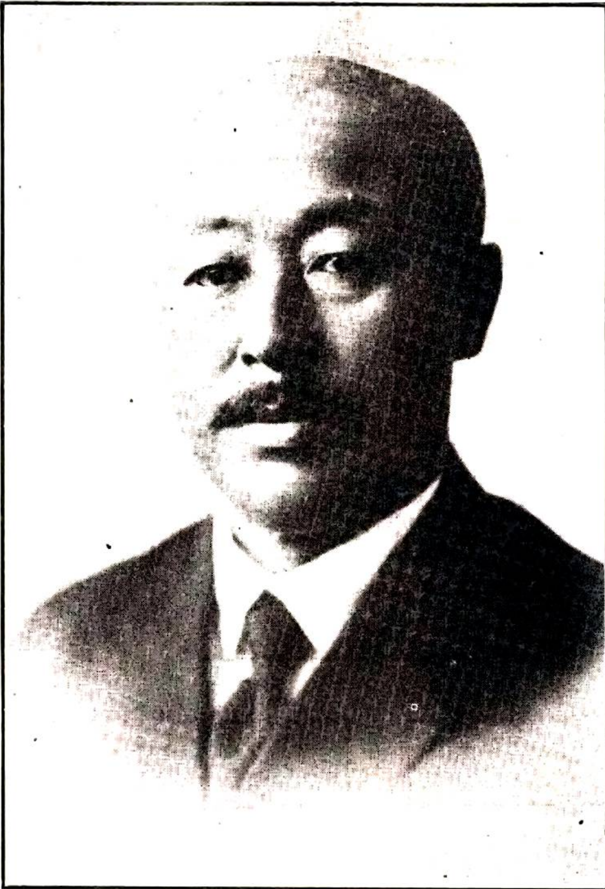
官令司副軍防邊北東 像肖相作席主張府政省林吉