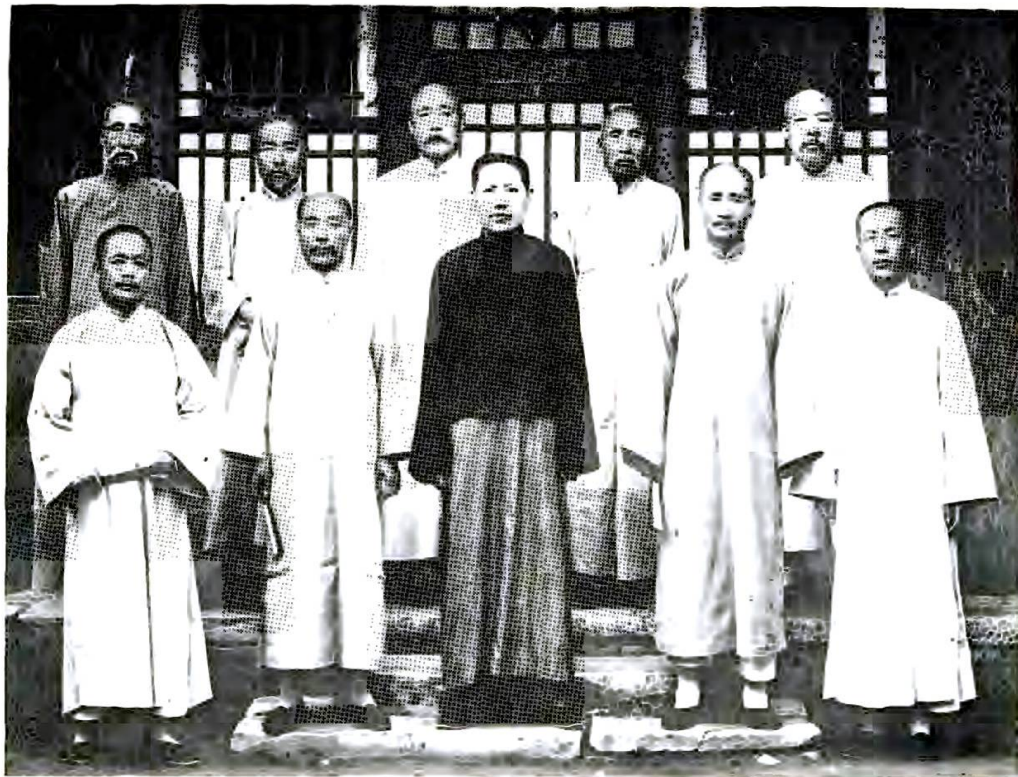
影 合 人 同 會 員 委 纂 編 志 縣 涿