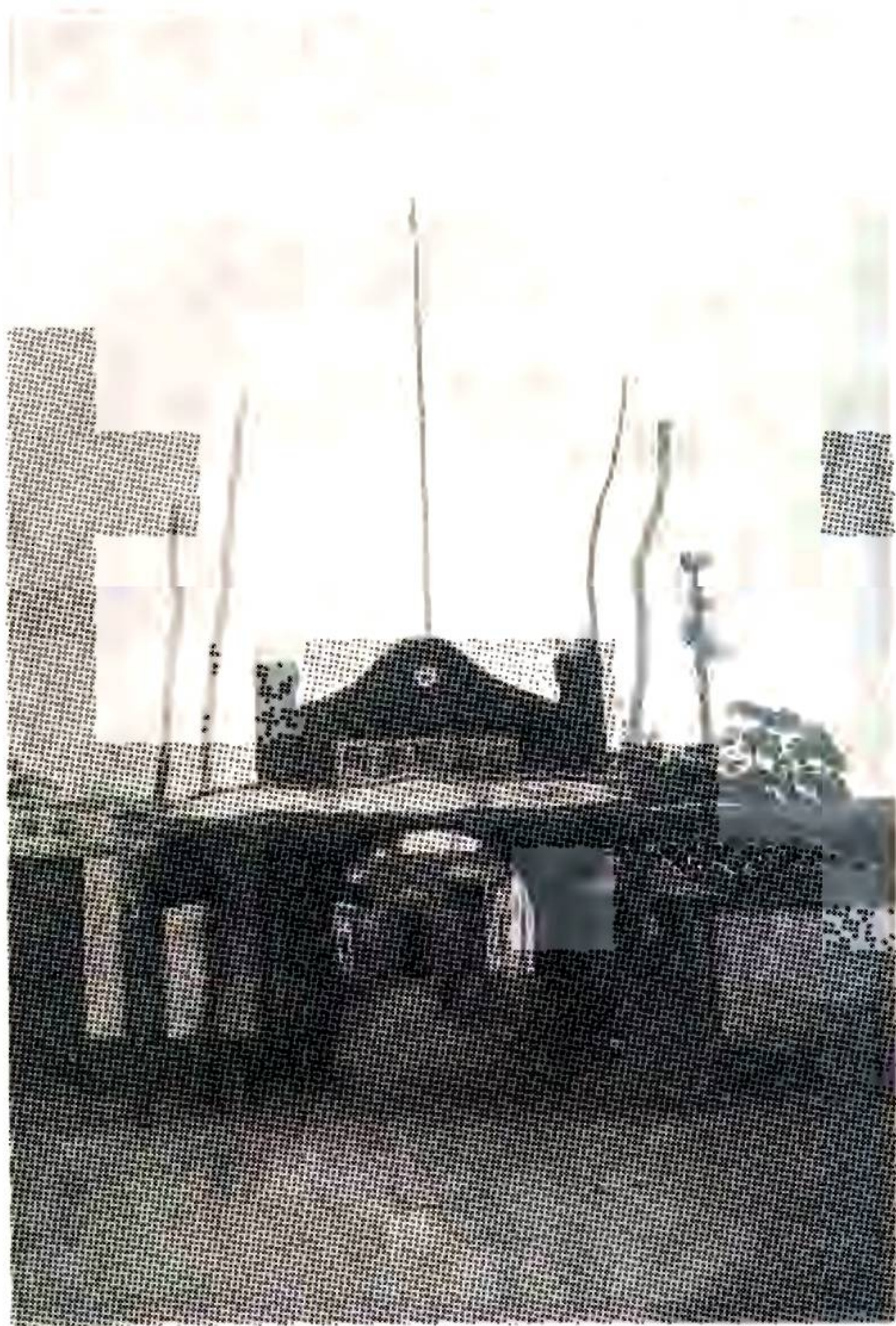
警 察 所