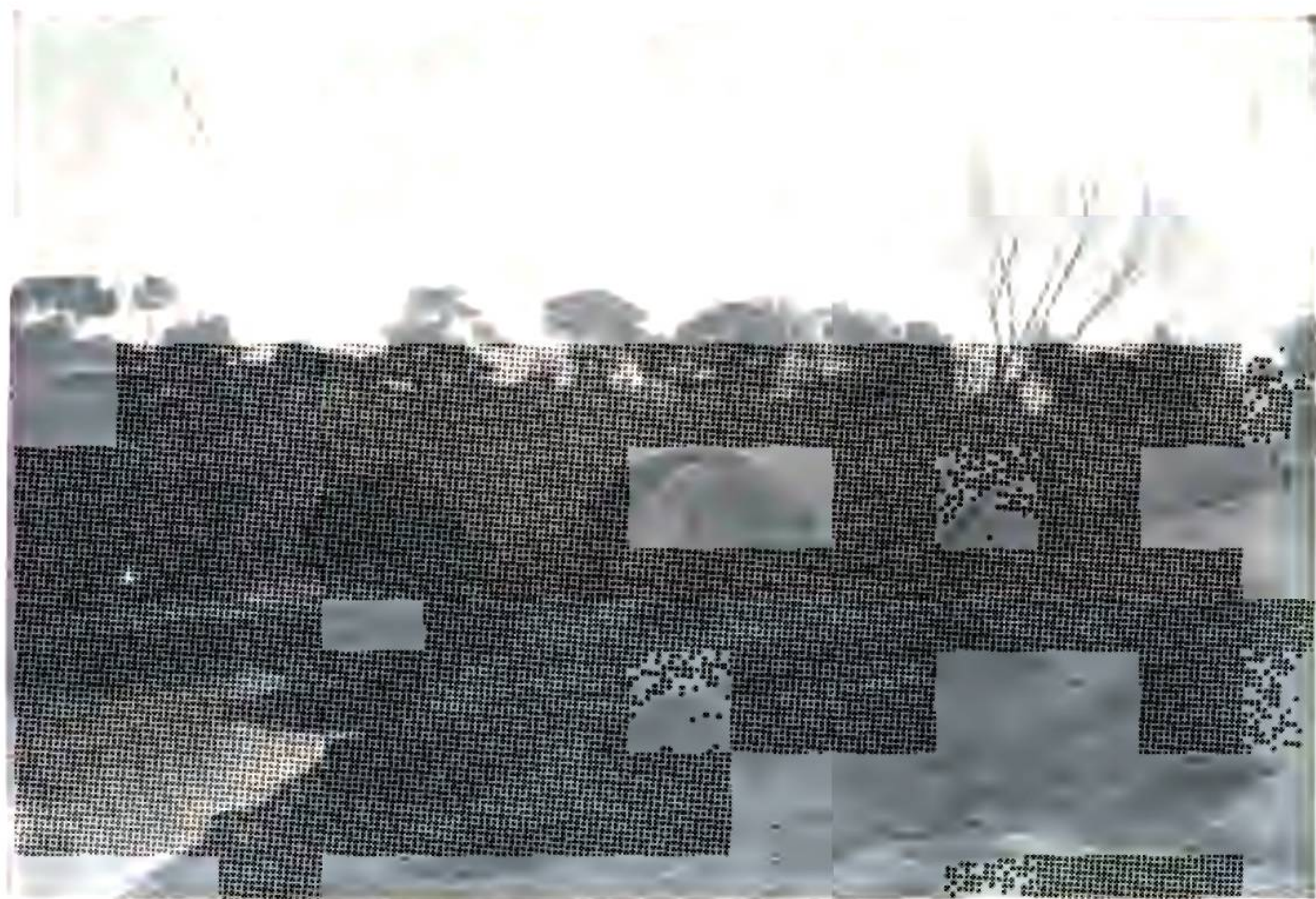
橋 陽 邊 ( 關 南 城 縣 )