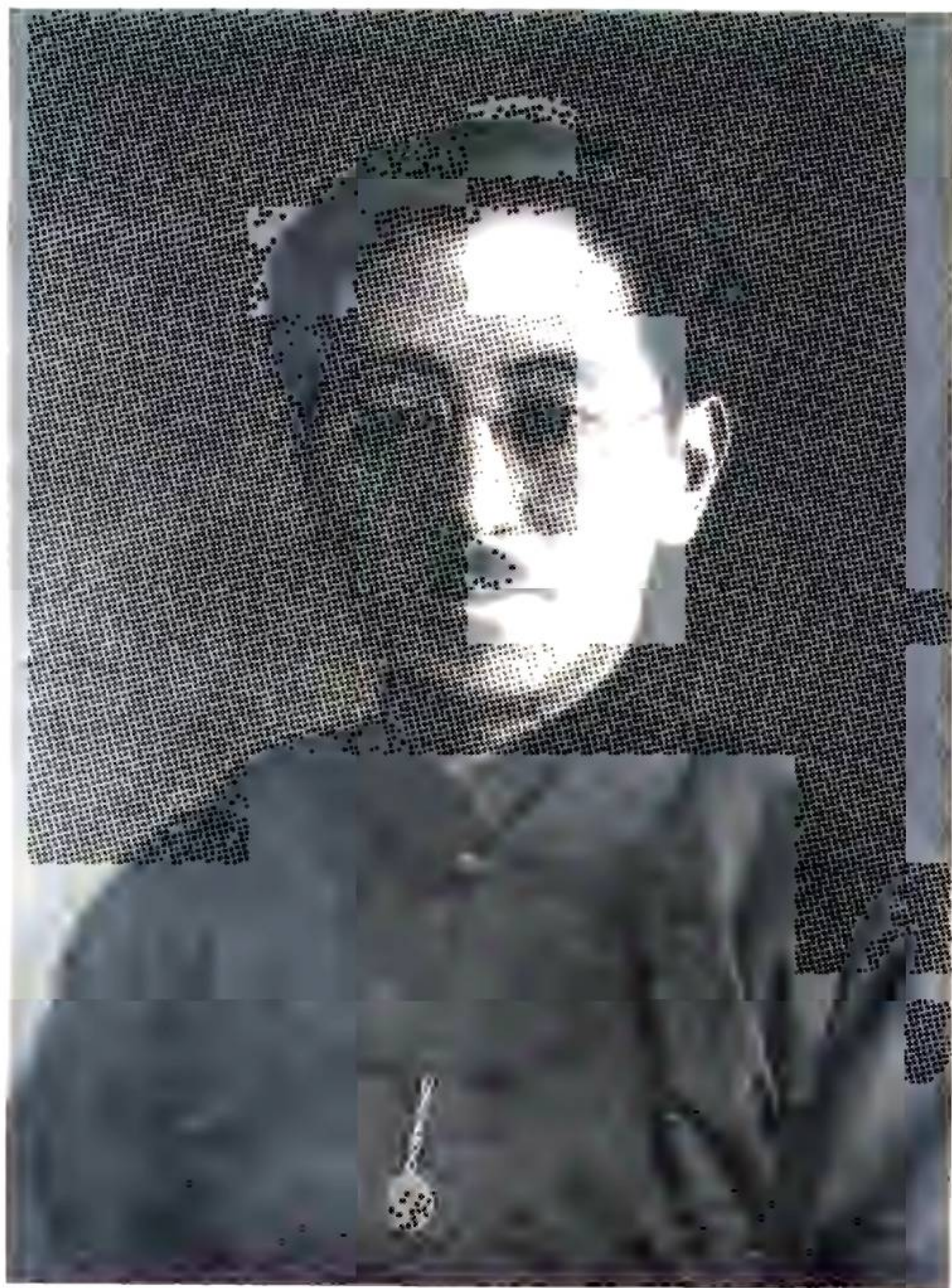
文希黃事知縣縣磁