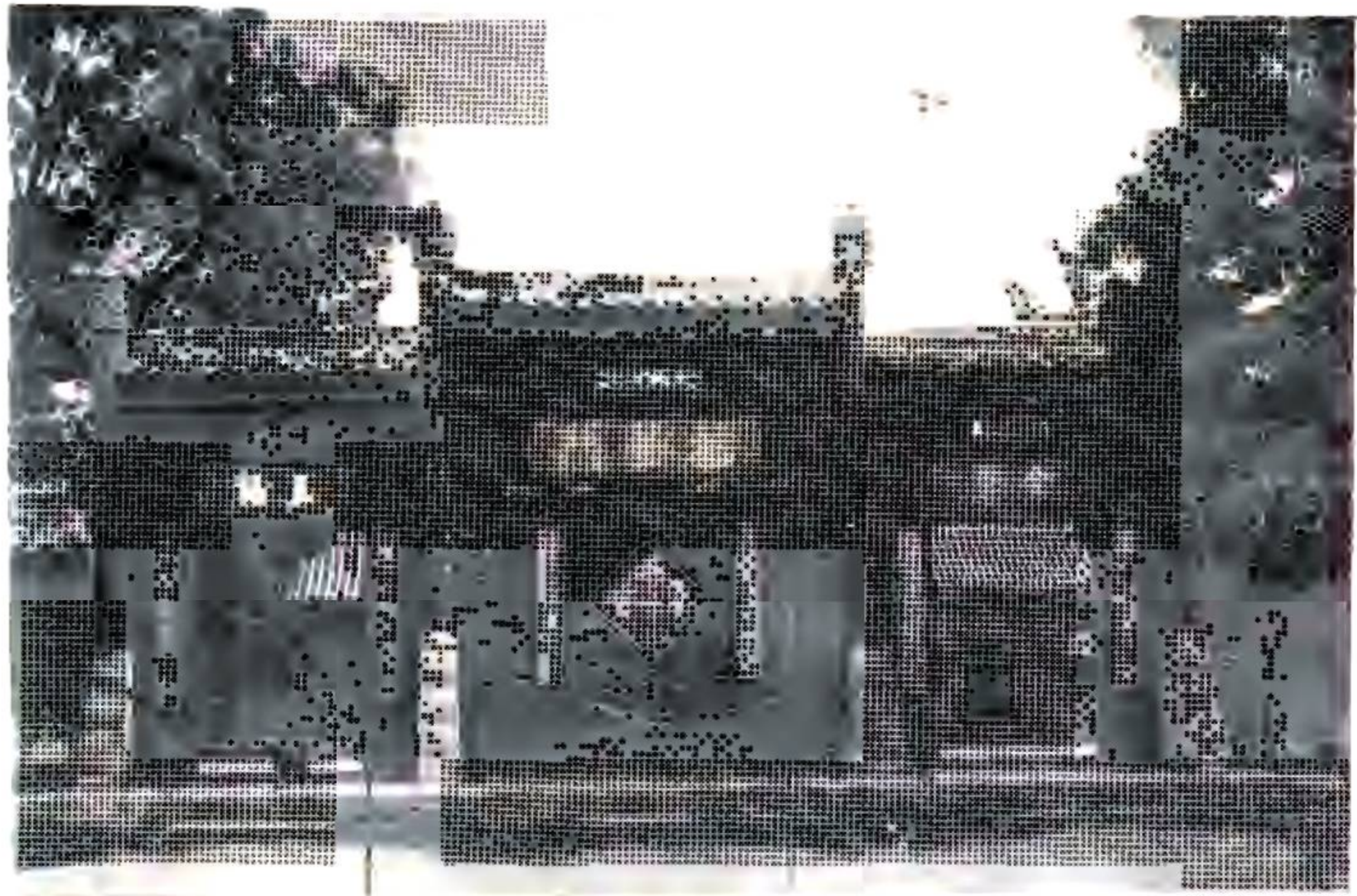
門 星 標 ( 門 正 廟 孔 )