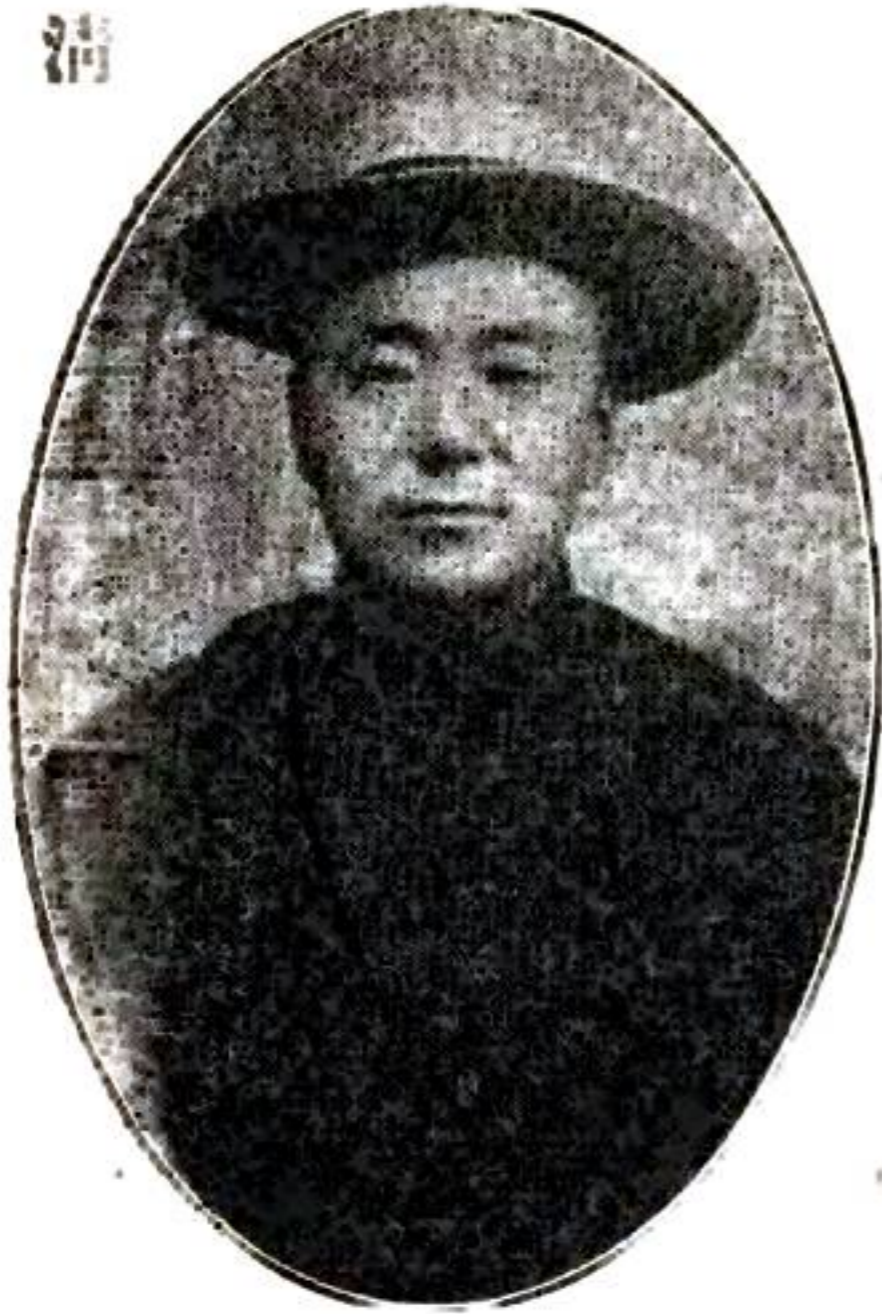
籌 辦 劉 長 清 清