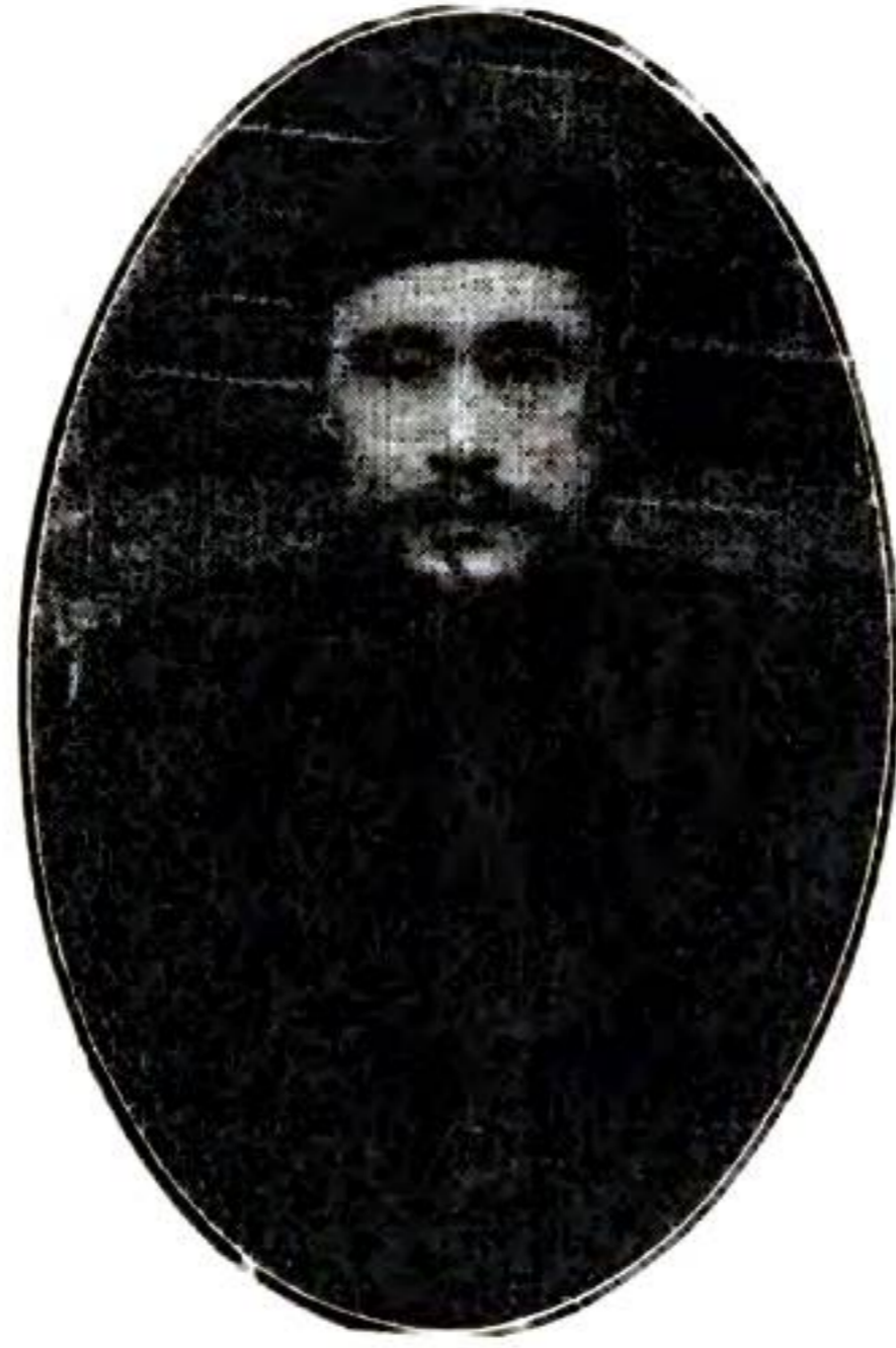
協 署 公 修 科 王 長 承 繼