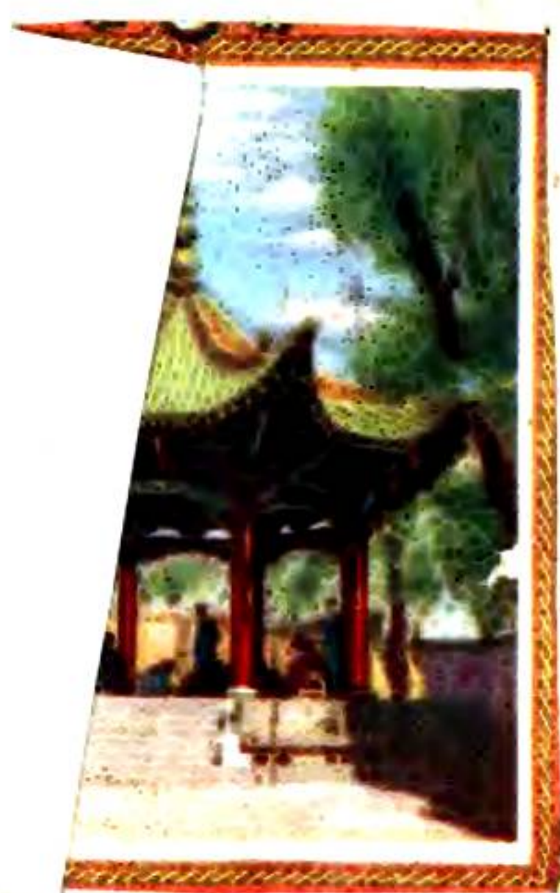
(西) 庭 (北) 翠 滴 亭 澗 漪 澄