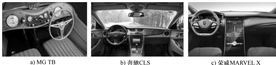
图 1-5 汽车内饰变化

在汽车内饰上,除了布局的不断成熟,装饰件的表面纹理也越加丰富,出现了水转印、喷漆、电镀、皮质包覆等各种工艺,可实现木质、科技纹等纹理特征,如图 1-5 所示。座椅不但在造型上实现高品位,同时在配置上也加入了加热、电动调节、腰托、通风等功能,进一步提升了汽车内饰美观度和舒适度。