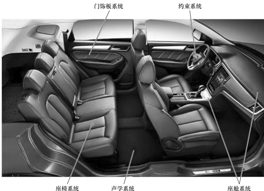
图 1-7 内饰系统零件的分布

内饰系统主要集中在乘员舱内部，包含座椅、约束、座舱、门饰板和声学五个子系统。汽车内饰系统零件的分布如图 1-7 所示。