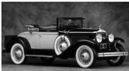
图 1-3 凯迪拉克 LaSalle

20世纪20年代至第二次世界大战期间，是汽车内外饰的快速发展时期。“汽车设计之父”哈利·厄尔将汽车外形设计的概念引入汽车工业设计中，他主导设计的第一款车凯迪拉克 LaSalle（图1-3），被认为是艺术家而非工程师设计的经典汽车，也是第一辆从前保险杠到尾灯都由设计师设计的汽车，开创了汽车外观设计的