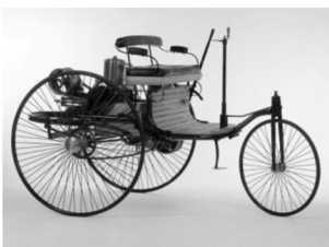
b) 世界上第一辆汽车