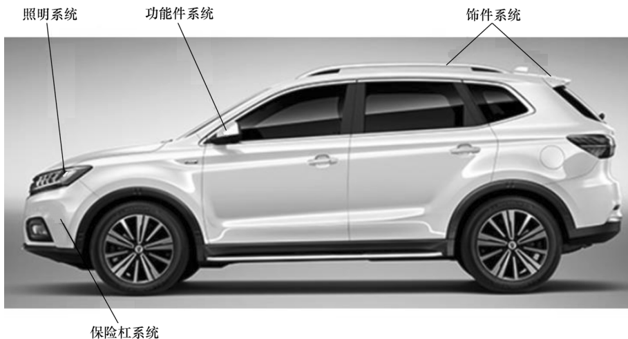
图 1-6 汽车外饰系统零件的分布

外饰系统主要集中在车身外部，包含照明、保险杠、功能件和饰件四个子系统。汽车外饰系统零件的分布如图 1-6 所示。