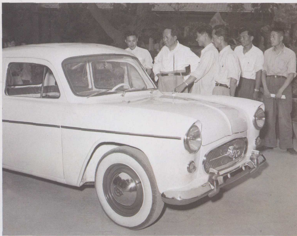
1958年6月20日，毛泽东同志在北京中南海参观北京第一汽车附件厂制造的“井冈山”牌小型轿车