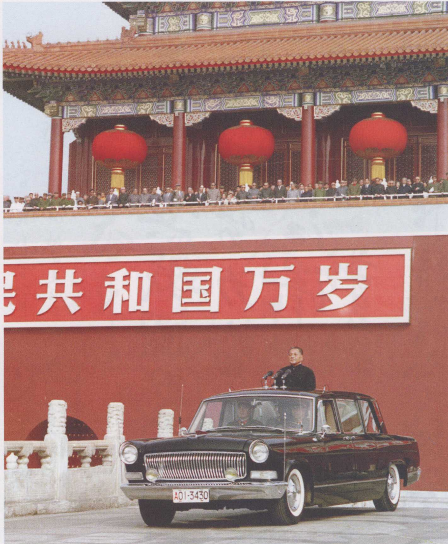
1984年10月1日，中华人民共和国成立35周年，邓小平同志乘“红旗”牌敞篷轿车准备检阅受阅部队