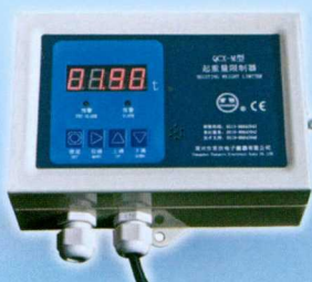
QCX-M型起重重量限制器