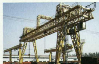
MG型双梁桁架门式起重机