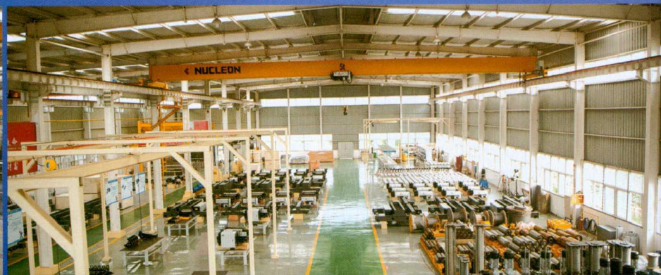
新型葫芦装配车间