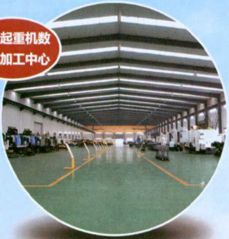
新型起重机数控机加工中心