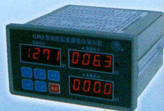
GDQ型高度起重量综合仪