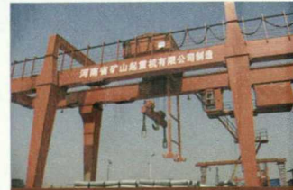
MG型地铁施工门式起重机