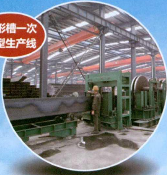
U形槽一次成型生产线