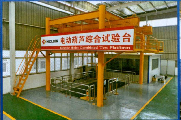
电动葫芦综合试验台