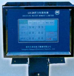
LX型起重力矩限制器