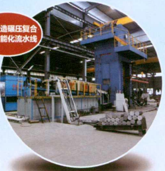
车轮锻造碾压复合工艺智能化流水线