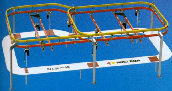
● 轻量化柔性组合式起重机