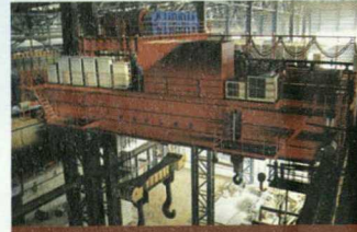
YZS型铸造桥式起重机