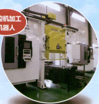
数控机床加工机器人