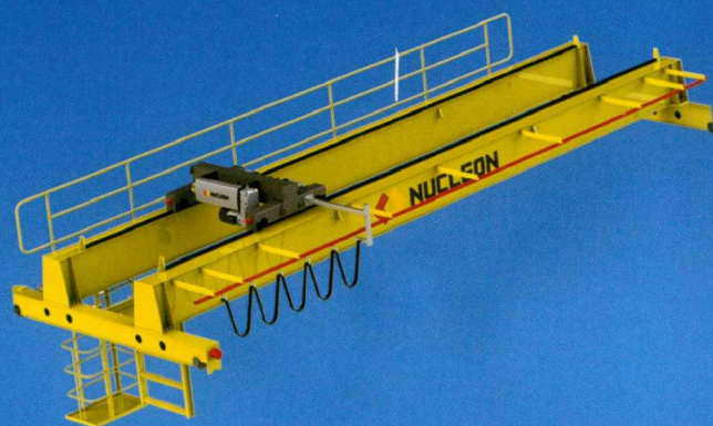
● NLH欧标电动葫芦桥式起重机