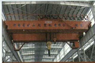
QD型电动双梁桥式起重机