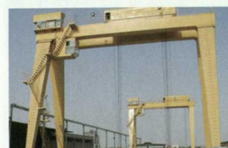
MG双主梁单小车通用门式起重机