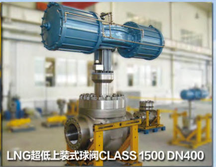
LNG超低上装式球阀CLASS 1500 DN400