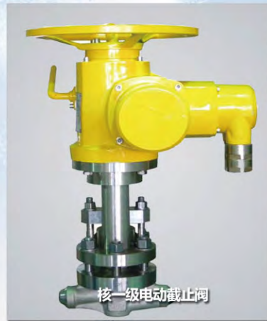
核一级电动截止阀