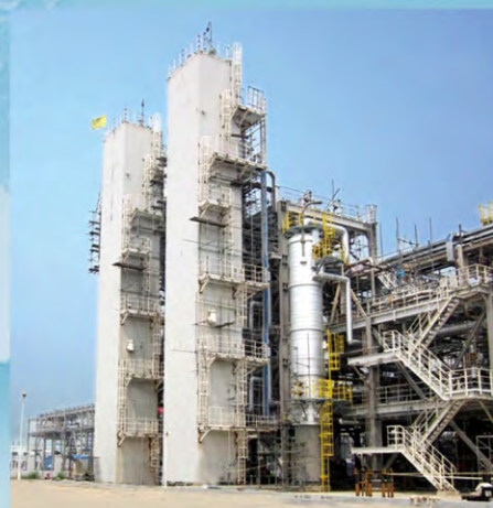
260万m 3 /d天然气液化冷箱