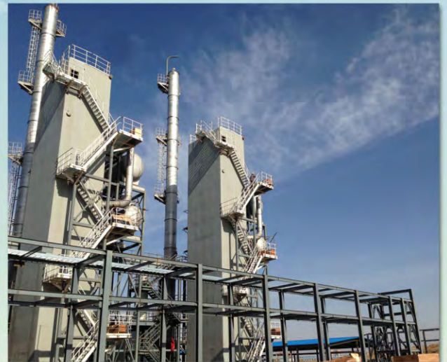
内蒙古兴圣200万m 3 /d天然气液化装置