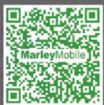
马利冷却塔选型软件