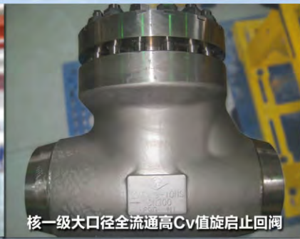
核一级大口径全流通高Cv值旋启止回阀