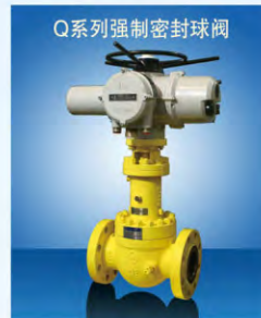
Q系列强制密封球阀

上海电气阀门有限公司（SNJ）郑重向所有的合作伙伴和客户承诺，更名后，公司管理团队、技术团队、营销团队和核心员工将保持不变，公司将仍然一如既往地有序进行一切经营活动，将继续竭诚为广大客户服务，是广大客户的忠诚合作伙伴和强大后盾。