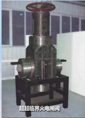
超超临界火电闸阀