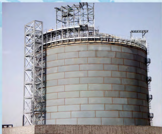
30 000m 3 LNG贮槽正在安装中