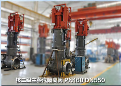
核二级主蒸汽隔离阀 PN160 DN550