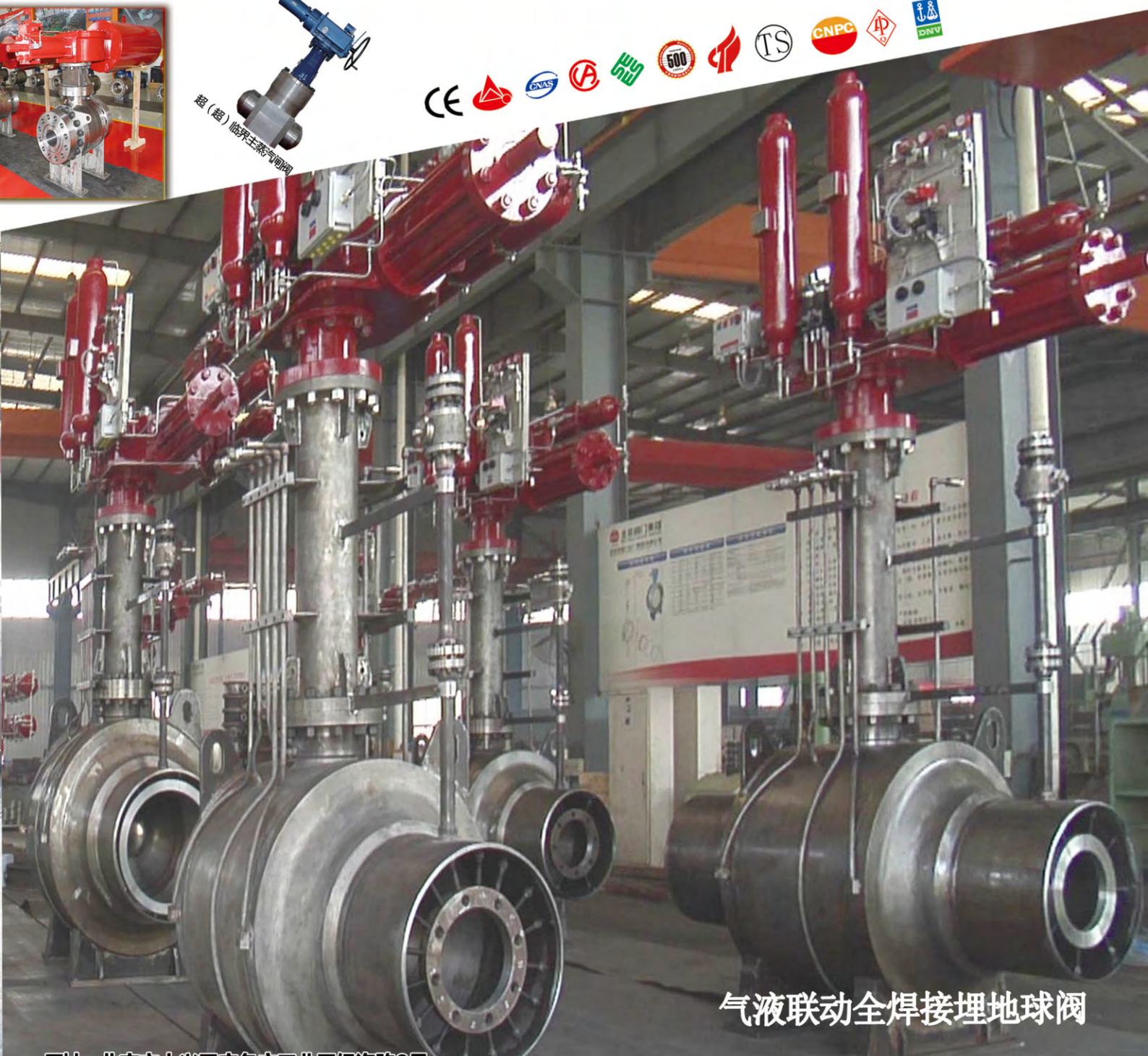
气液联动全焊接埋地球阀