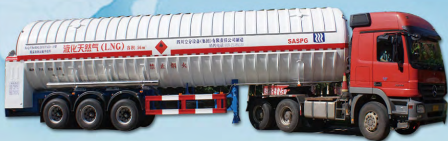
56m 3 LNG运输车