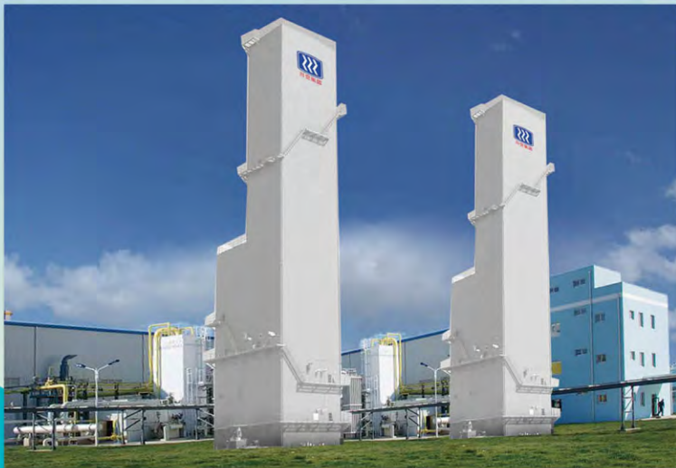
2×50 000m 3 /h空分设备