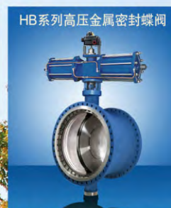
HB系列高压金属密封蝶阀