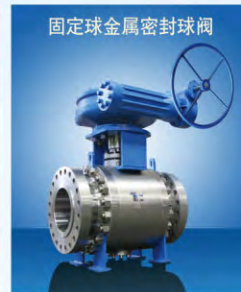
固定球金属密封球阀