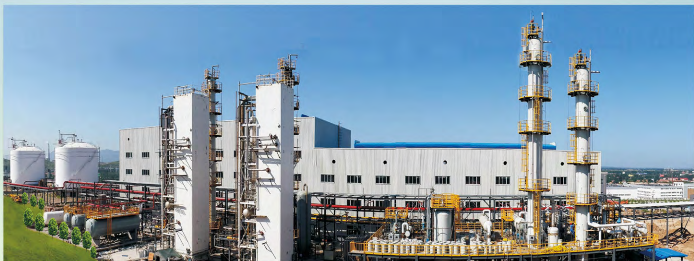
100万m 3 /d天然气液化装置