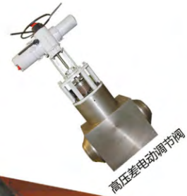
高压差电动调节阀