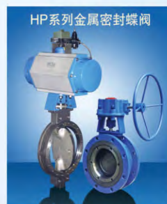
HP系列金属密封蝶阀