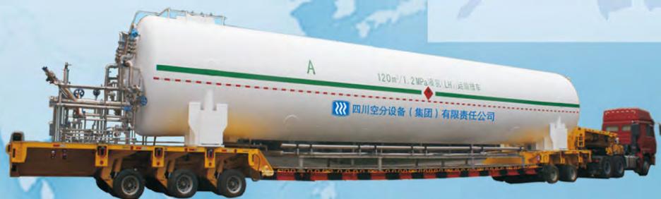
120m 3 液氢运输车