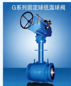
G系列固定球低温球阀