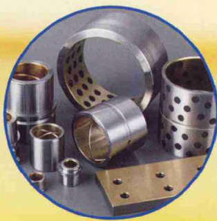
钢基铜合金自润滑轴承