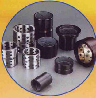
铜基系列高承载轴承