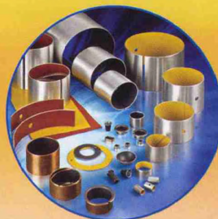
金属塑料复合系列自润滑轴承