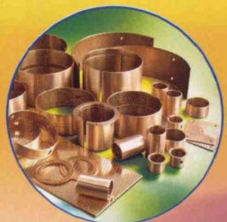
青铜基卷制边界润滑轴承