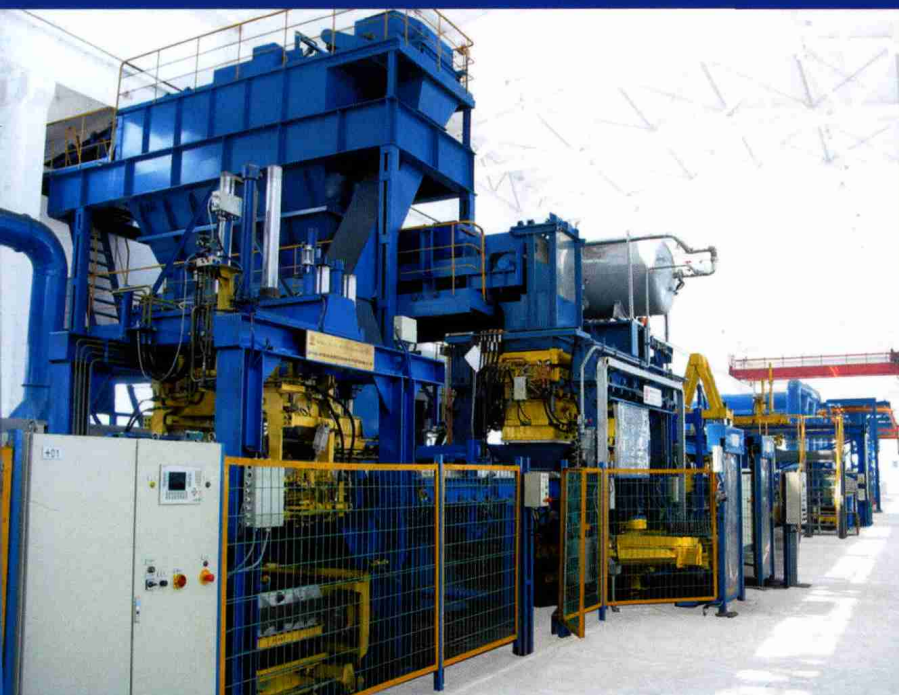
清洁高效绿色铸造成套装备