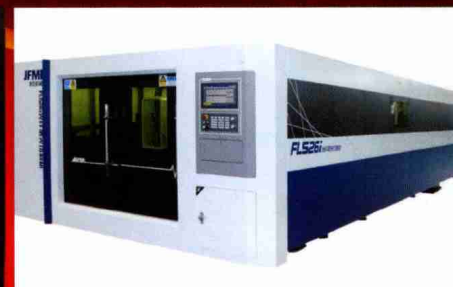
数控光纤激光切割机