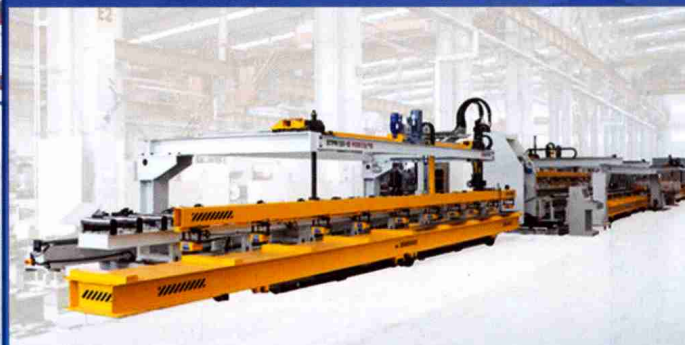
高端汽车纵梁成套装备