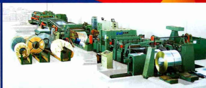
高档数控开卷校平生产线