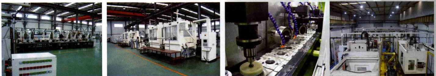
自动组装线及生产线

四川普什宁江机床有限公司 PUSH NINGJIANG MACHINE TOOL CO., LTD.