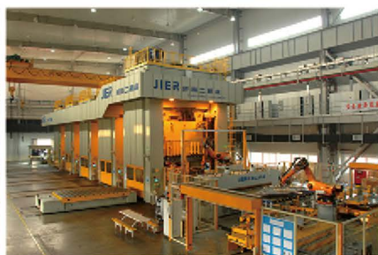
为南京南汽模具装备有限公司提供的机器人自动化冲压线