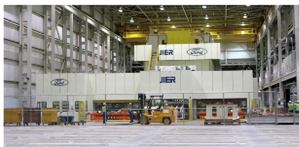
出口美国福特汽车公司的全自动冲压生产线