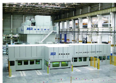
为烟台通用东岳汽车公司提供的自动化双臂快速冲压线