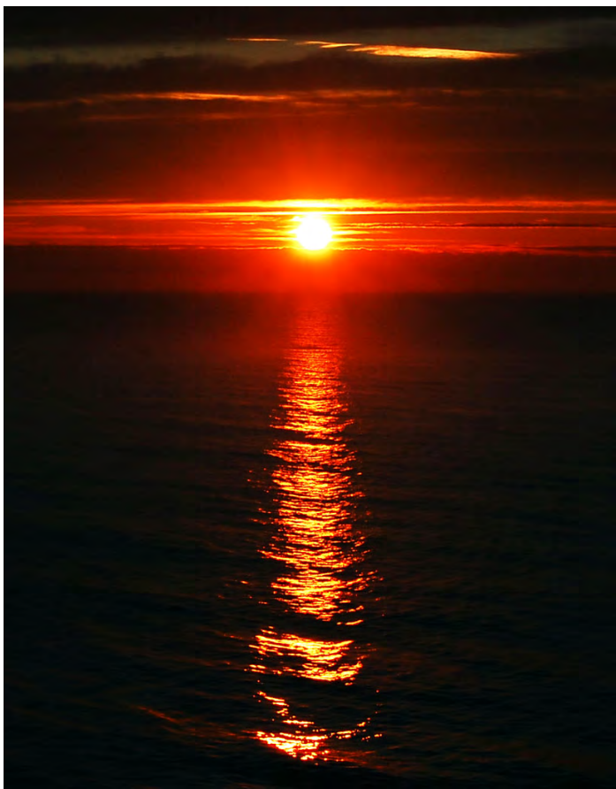
光圈：F4 焦距：50mm 快门：1/125s ISO：100