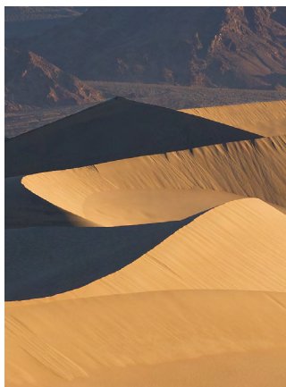
光圈：F8 焦距：85mm 快门：1/500s ISO：100

人以广阔的空间，比较稳定的感觉；垂直线给人庄严、雄伟的气势感觉；斜线给人运动、不安定的感觉；曲线利于表现线条的优美。不管景物以何种线条呈现，摄影构图时都可以得到好的表现，横构图、竖构图、对角线构图、S形构图都可以很好地表现自然景物。