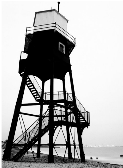
光圈：F8 焦距：50mm 快门：1/500s ISO：100

如果没有光我们就不会看到五彩的事物，更没有完美的画面。光影构图是一种极容易产生效果的构图方式。它可以快速渲染气氛，烘托画面。拍摄时要注意使画面达到均衡，利用光影的疏密对比和光线形成的点、线、面来进行构图。光线可以在照射的物体上形成影子，这种影子可以根据光线照射的不同角度来形成不同面积，同时也能够产生不同的构图。