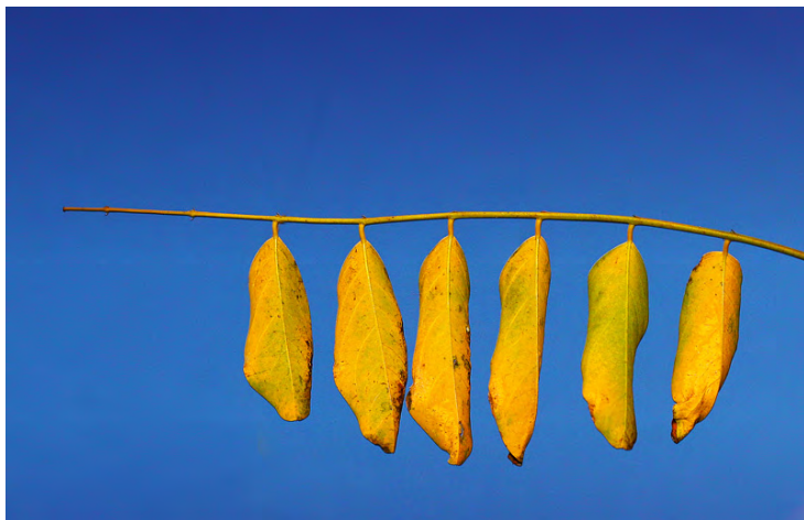
光圈：F4 焦距：100mm 快门：1/1000s ISO：100

沙漠因为侧光的照射加上原来沙漠的形状，使其形成了弯曲的折线，视觉上给人延伸的感觉。