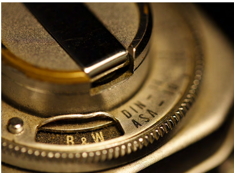
光圈：F2 焦距：105mm 快门：1/125s ISO：100

犹如失去重力又像彼此存在斥力的玻璃，形成了神奇的弧状线条，而色彩的变化更像绚丽的彩虹。