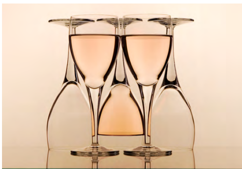
光圈：F2.8 焦距：85mm 快门：1/250s ISO：100