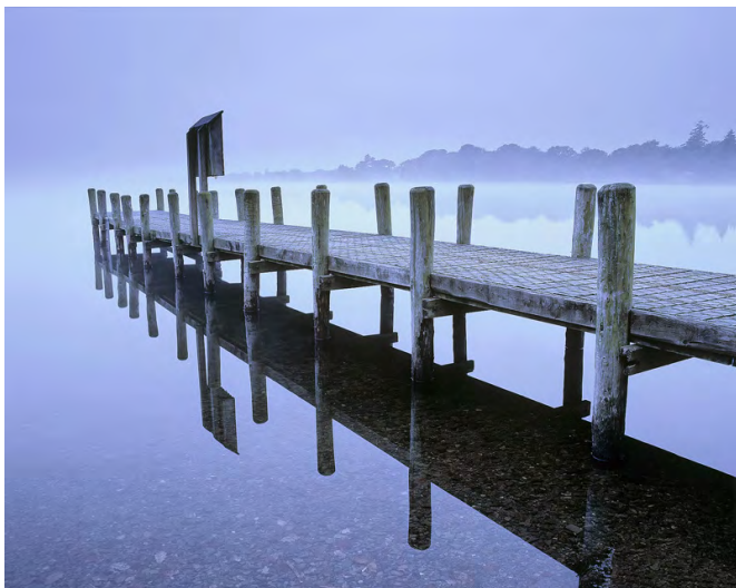
光圈：F8 焦距：85mm 快门：1/250s ISO：100