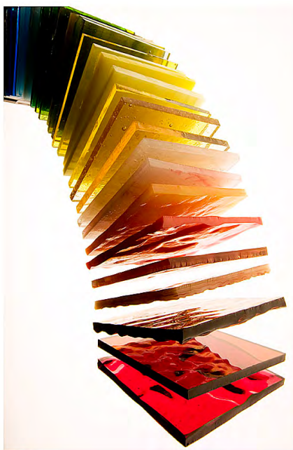
光圈：F8 焦距：50mm 快门：1/125s ISO：100

表现质感有两种含义。一是要表现各种不同的质地属性，例如：玻璃、布料、金属都是不同的质地，拍摄时也要利用光线的方位、强弱、性质（直射光还是柔光）等因素给予表现。二是要表现出景物表面的视觉感受，例如：粗糙、光滑、柔软等属性。