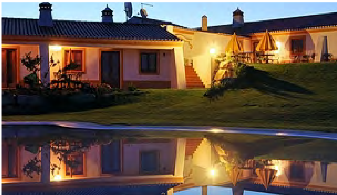
光圈 F4 焦距：35mm 快门：1/60s ISO：100