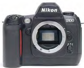
▲ 尼康 D100 的基本参数

全画幅相机又称技术相机，是针对传统 135 胶卷的尺寸来说的。数码相机的感光元件（CCD 或 CMOS）大小接近于传统 135 胶片一张大小的尺寸，就可以说是全画幅。CCD 尺寸越大，成像质量越高，并且对于已经有传统单反相机的用户来说，镜头不再需要乘以对应的换算系数。例如佳能 EOS 500D 的 CCD 尺寸大概等于胶卷尺寸的 2/3 左右，装 100mm 的镜头，换算 1.6 倍率后就变成 160mm 的镜头了。现在市场上有很多接近于全画幅的数码单反相机，例如尼康 D100 和佳能 EOS-1DS。