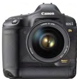
▲ 佳能 EOS-1DS 的基本参数