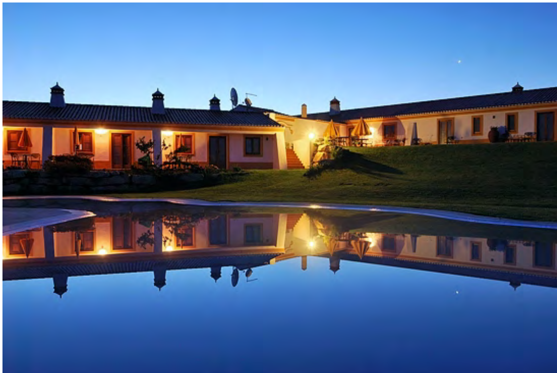
光圈：F4 焦距：35mm 快门：1/60s ISO：100