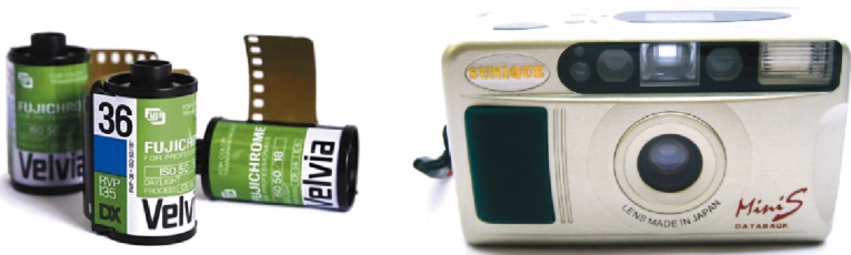
图1-1 135胶卷和常见的使用135胶卷的傻瓜相机

目前我们已经很少能够见到胶片相机了，但是在进入21世纪前，胶片相机一直占据着摄影器材的主导地位。胶片相机就是使用胶片或胶卷作为感光材料的相机，我们见得最多的是胶卷，如135胶卷（见图1-1）和120胶卷（见图1-2）。