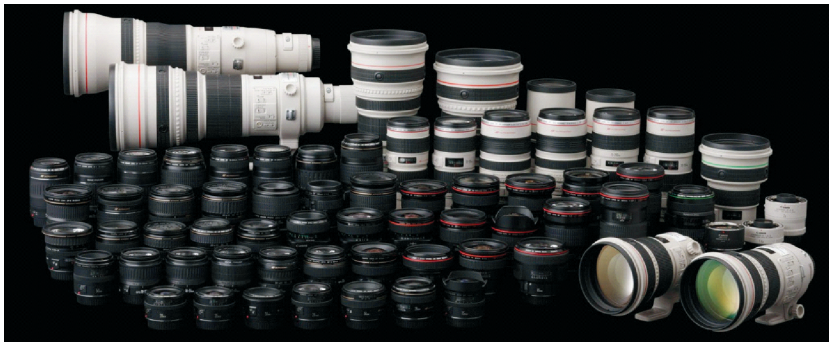
图1-6 单反相机的镜头群

我的身材比较硕大，但是我有一个优势，我可以更换我的最主要的拍摄武器——镜头！我拥有丰富的武器可以使用，无论是远距离拍摄野生动物，还是在狭小的空间内进行拍摄，我都有相应的武器可以使用，看图1-6，这些都是我最得力的武器！