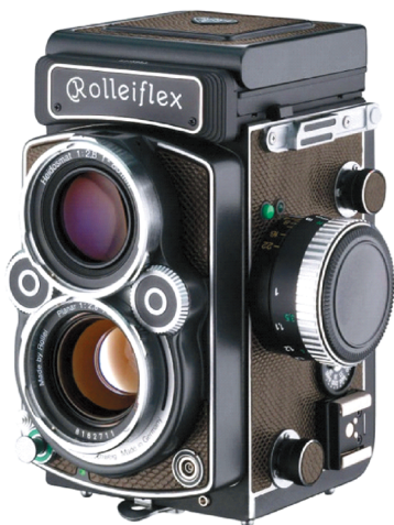
图1-10 双镜头反光相机

我们的全称叫做“双镜头反光相机”，不同于单反，像图1-10那样我们拥有两只镜头。我们上面的镜头是用来取景的，而下面的镜头是用来拍摄的。