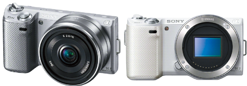
图1-9 可以更换镜头的微单相机

我们比单反更加便于携带，同时我们的最大特点就是大多数我们家族的成员都可以像单反那样更换镜头呢！虽然我们和单反的镜头不是共用的，但我们拥有自己的镜头体系，在使用转接环的情况下，我们甚至还能使用单反的镜头呢（见图1-9）！