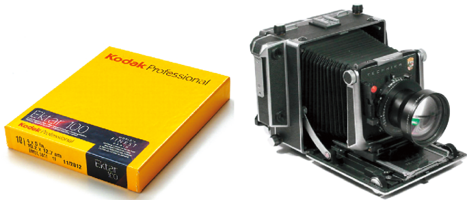
图1-3 页片和使用页片的 4\text{in} \times 5\text{in} 大画幅相机

片，而一张页片每次只能拍摄一张。页片通常有 4\text{in}^{\ominus} \times 5\text{in} 、 5\text{in} \times 7\text{in} 、 8\text{in} \times 10\text{in} 三种规格，页片如图1-3所示。