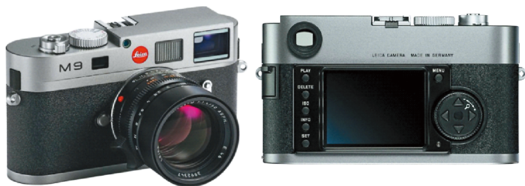
图1-11 最新的Leica M9型数码旁轴相机

我们的全称叫做旁轴取景式相机。你可能没听过我们旁轴相机，但是你一定知道莱卡（Leica），而莱卡最著名的M系列相机，就是最有名的旁轴相机！莱卡的M系列相机从第二次世界大战前的胶片旁轴相机莱卡Ⅲ型一直走到了现在最新的M9，图1-11就是目前莱卡最新型的M9数码旁轴相机啦！