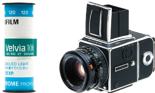
图1-2 120胶卷和使用120胶卷的中画幅相机

135胶卷是我们最常用的胶卷，以前家里用的傻瓜相机，几乎全部使用的是135胶卷，135胶卷一卷可以拍摄36张左右的照片。