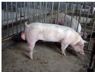
引进的约克公猪隔离舍中饲养