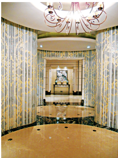
图1-12 广东番禺星河湾酒店