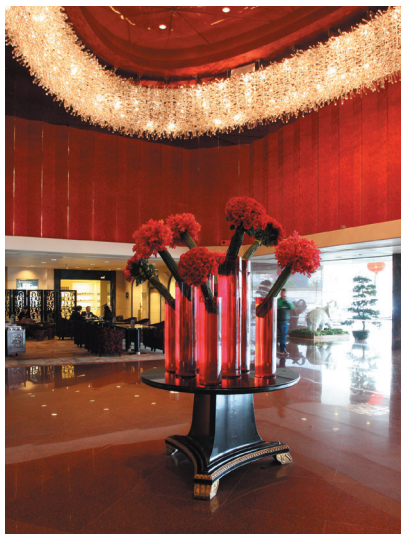
图1-17 广州中国大酒店大堂陈设品