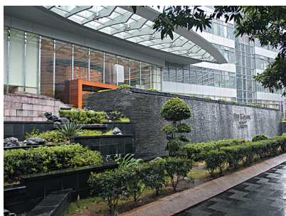
图1-1 广州海航威斯汀酒店入口雨篷

在人类文明的发展过程中，不可避免地存在一定的社会意识和社会行为。而这些行为大都是在一定的空间中完成的。就建筑物而言，空间一般是指由一定的结构或界面所限定并围合出的一个区域中的“虚空”的范围。室内相对室外而言，是指空间的内部。由此我们还可以了解，有六个界面的六面体空间是最密闭的空间。对于一个六面体空间来说，室内和室外部分很容易区分。但对于少于六个界面的空间来说，室内与室外的空间关系就比较难于区别。不过我们可以通过生活中的一些经验归纳出它们的区别。在空间中，顶界面的存在与否可以使空间的使用有质的区别。例如，有顶部的入口雨篷，就可以为你遮阳挡雨（图1-1）；而徒具四壁的空间，却不能为你遮挡风雨，通常我们称它们为“天井”或“院子”（图1-2、图1-3）。由此可见，是否拥有顶界面是区分室内外空间的重要标志。