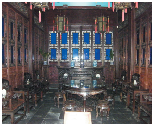
图1-15 杭州胡雪岩故居“清雅堂”室内