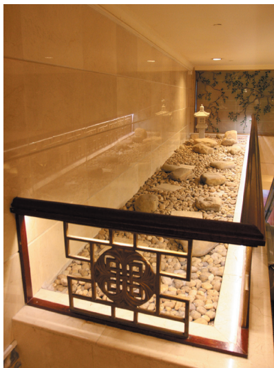
图1-18 广州中国大酒店电梯周围的陈设品