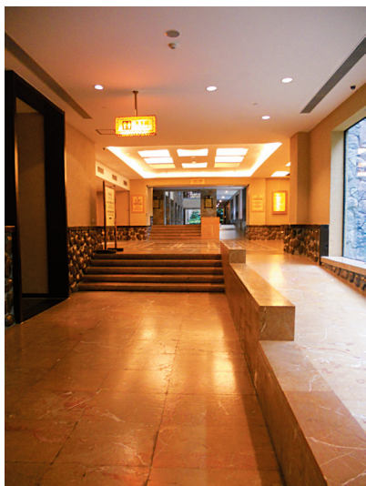
图1-11 广东番禺长隆度假酒店室内

以借助人的视觉感受在垂直方向上拉伸空间，减弱室内空间的压抑感（图1-12）；在界面上运用镜面，则可以大大扩展室内空间的视觉尺度等（图1-13）。