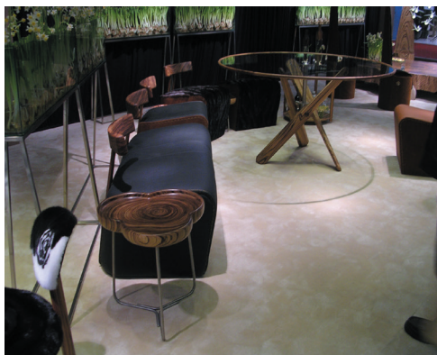
图1-16 广州国际家具博览会的当代家具设计作品