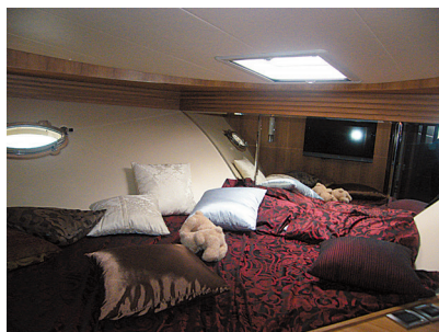
图1-4 “海上亚历山大”游艇的客厅 图1-5 “海上亚历山大”游艇的楼梯 图1-6 “海上亚历山大”游艇的卧室