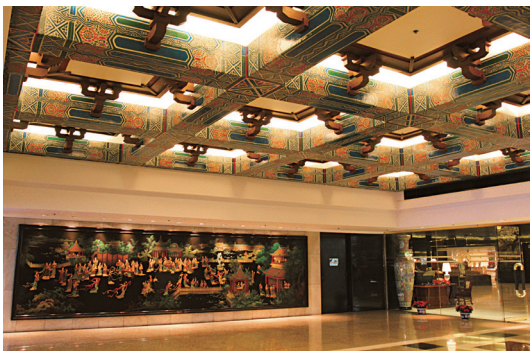
图1-8 广州花园酒店入口门厅

室内建筑的实体构件与室内空间是相互依托而存在,对于实体构件的造型设计要充分考虑室内空间的环境需要。例如,在表达民族风格的室内空间环境时,可以在实体构件上装饰以民族图案及民族色彩(图1-8);在表达具有高科技的现代气息的空间环境时,可以在实体构件的表面装饰以玻璃、不锈钢等冷硬的材质及简洁形状的造型(图1-9);在表达自然的乡土气息的室内空间环境时,则可以利用粗糙肌理的石材、自然状态的竹、藤等装饰这些实体构件(图1-10)。