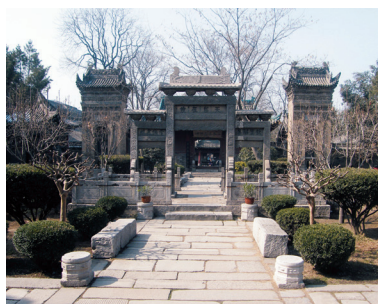
图1-3 西安化觉巷清真寺的院落