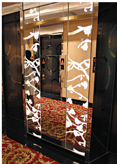
图1-13 广州威尼国际酒店电梯厅