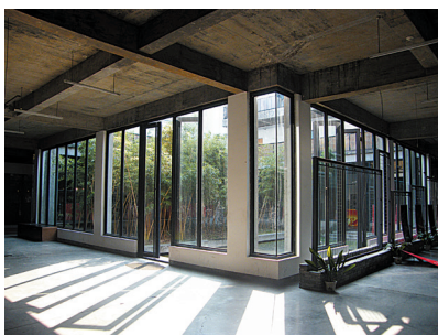
图1-2 杭州中国美术学院象山校区的天井