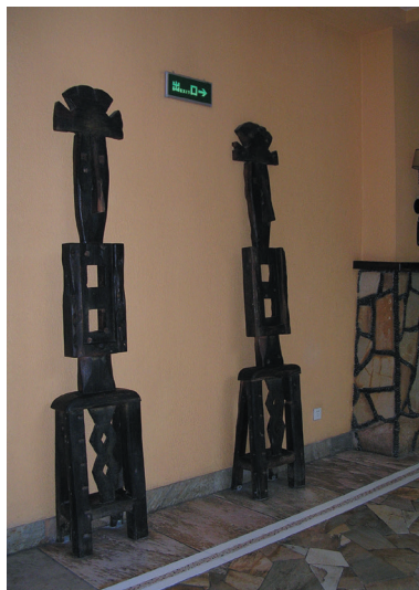
图1-19 广东番禺长隆度假酒店室内陈设品