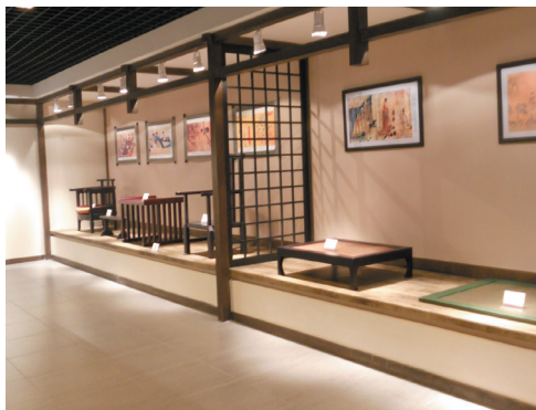
图1-14 从席地而坐垂足而坐的家具演变

对于“陈设”的解释，从字面上看，作为动词有排列、布置、安排、展示的含义；作为名词有摆放、设置之意。室内陈设是指室内除固定的建筑实体构件及设备外的一切实用的可供观赏的陈设物。室内陈设设计包含了对简单的可移动家具、室内织物、室内绿化、室内观赏动物、室内日用品、室内艺术品等的挑选、搭配、加工及布置。室内陈设具有可移动、更换简单的特点，主要起到装饰、点缀、美化空间的效果。室内陈设设计可以强化室内环境风格；可以柔和室内空间；可以调节室内环境色彩；还可以陶冶人的品性情操，并反映空间使用者的个人爱好（图1-17、图1-18）。因此，室内陈设设计应该把握陈设品自身的艺术性和与空间的协调性。而经过设计师加工后的具有创新精神的陈设品会使空间更具有趣味性和个性（图1-19）。