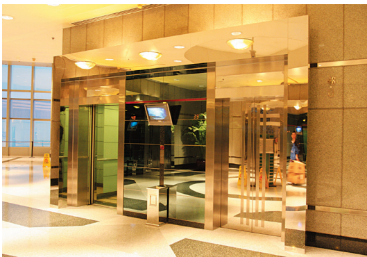
图1-9 广州中信广场电梯厅