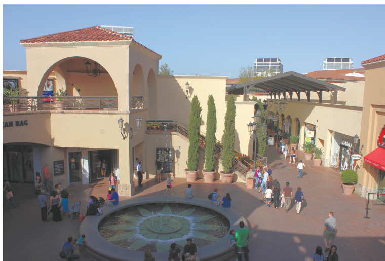
图1-1 时尚岛（Fashion Island）休闲购物中心

国密苏里州堪萨斯城的郊区出现了世界上第一家购物中心——乡村俱乐部广场（Country Club Plaza）。1931年得克萨斯州的达拉斯高原广场购物城（Highland Park Shopping Village）建成，并被认为是世界上第一个标准的购物中心，因为它符合现今美国国际购物中心协会对购物中心的基本描述：该购物中心由单一所有权人统一管理，并拥有综合性的商业业态，如购物中心里包括零售商店、银行、美容店、发廊、电影院、办公楼等。之后，在经历一段较长时间的成长与发展后，到20世纪七八十年代，建造购物中心又开始成为美国旧城复苏的一项重要措施。人们称之为“节日市场”（Festival Market），并认为它是城市中心最具吸引力的消费场所。当时比较著名的购物中心有纽约南街海港（South Street Seaport）购物区、巴尔的摩海湾港口场地（Harbour Place）购物中心等。20世纪八九十年代，美国的购物中心又经历了一次迅速发展，此时主题性购物中心大量出现，典型案例有加利福尼亚新港市（New Park City）的时尚岛（Fashion Island）休闲购物区等（图1-1）。