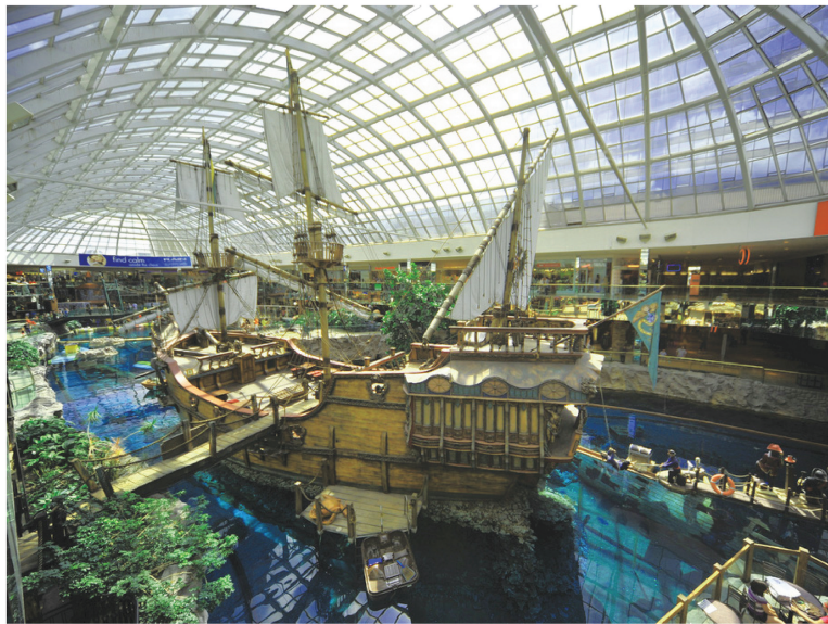
图 1-3 加拿大西埃德蒙顿 (West Edmonton) 购物中心