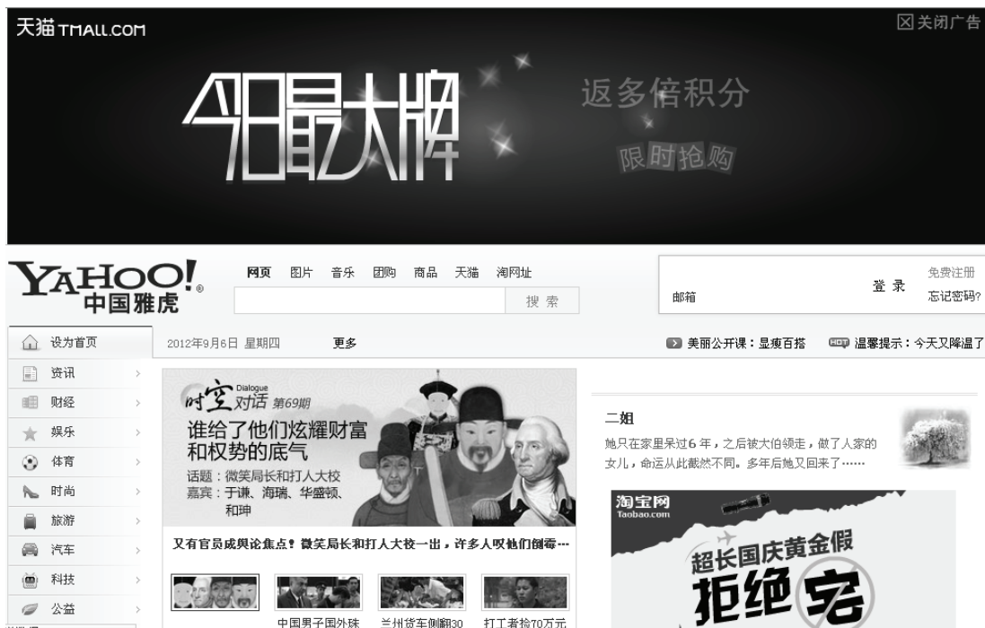
图 1-1 雅虎中国的主页

上述各种网页元素组合在一起，为所有的浏览者呈现了绚丽的界面效果。在本书后面的章节中，将和读者一起来领略 HTML 5 的神奇，共同开始我们的网页设计神奇之旅。