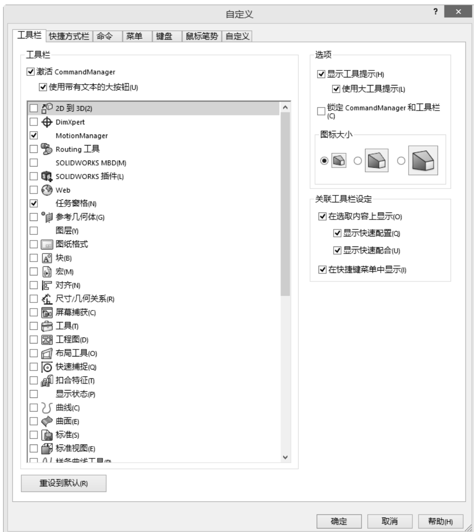
图 1-2 “自定义”对话框的“工具栏”选项卡