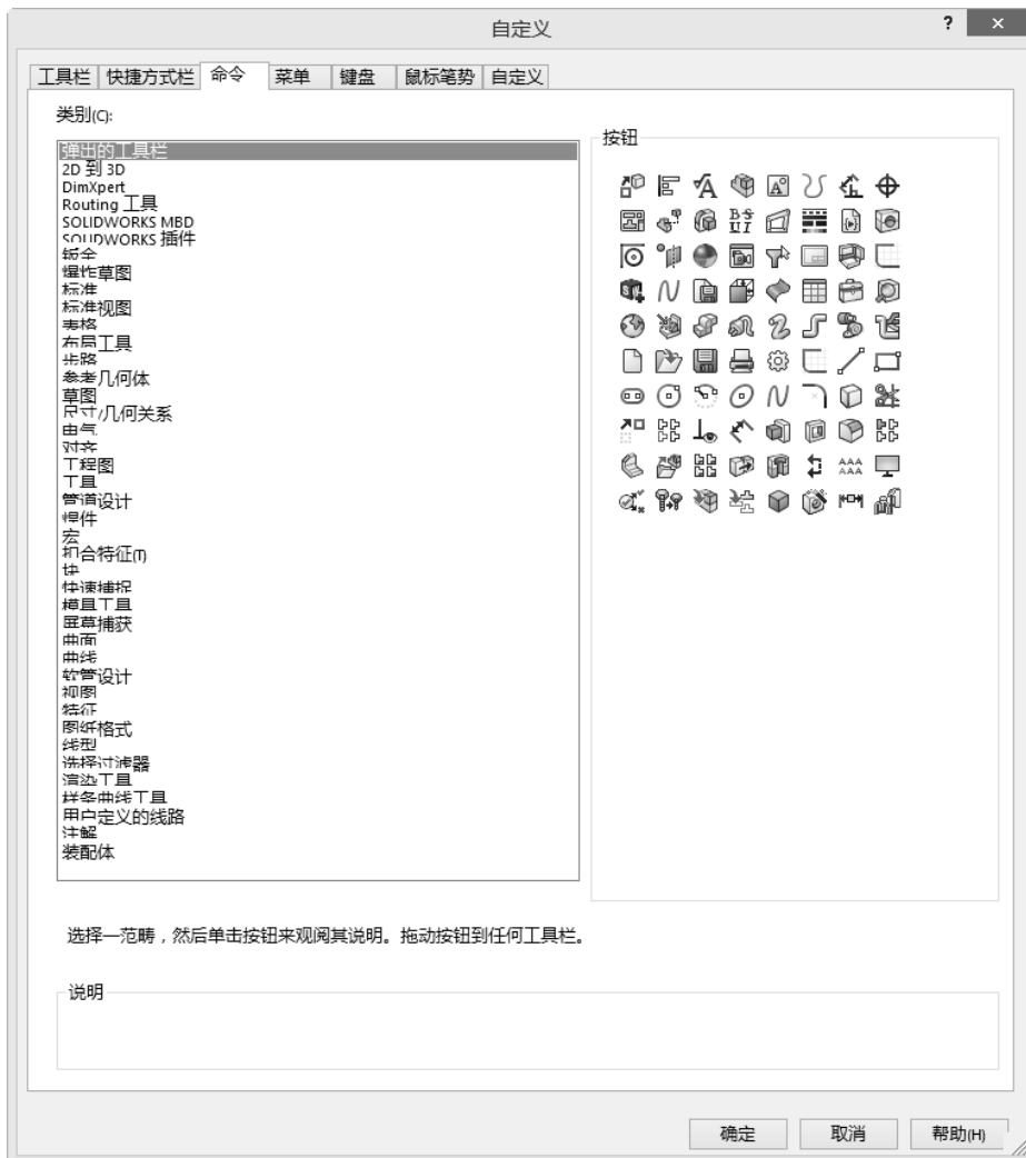
图 1-3 “自定义”对话框的“命令”选项卡