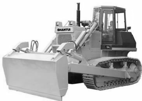
图 1-10 推耙机

耙土，整机工作效率高，操纵灵活方便，可广泛用于港口散装货物的清仓和平仓作业，也可用于电厂或码头松散物料的推耙作业。