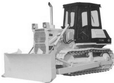
图1-7 高原型履带式推土机

高原型推土机（见图1-7）适合在海拔（3000~5000m）地区作业，能够适应高寒、低压、缺氧、紫外线辐射高等恶劣条件。