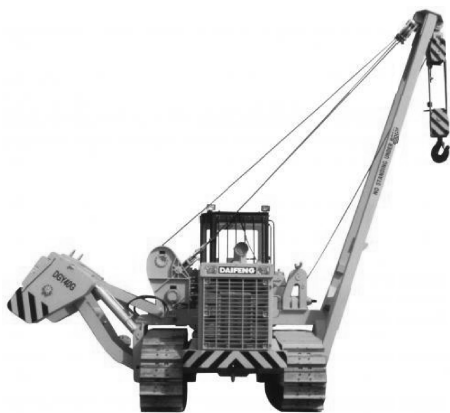
图 1-11 吊管机

吊管机（见图 1-11）是推土机的变型产品，工作装置为安装于底盘侧面的吊杆、卷扬机构和配重，为增加稳定性，履带加长加宽，可用于各种管材敷设。