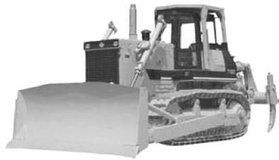
图 1-3 山推 TY320C 型履带式推土机

为了保持市场占有率，加速企业发展，各企业越来越重视新产品开发和市场开发。如山推工程机械股份有限公司最新推出的 TY320C 型履带式推土机（见图 1-3），采用了模块化设计、先导操纵、机电一体化监控及低噪声驾驶室等先进技术；在小松 D85A-21 型基础上开发的 TYG230