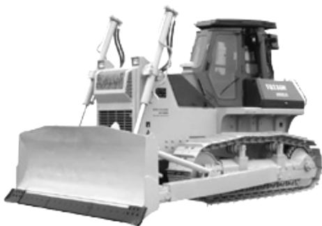
图 1-5 三一重工的 TQ230H 型 静液压驱动履带式推土机

以往对推土机编号，都是以 T 或 TY 字母开头，取推土机拼音的第一个字母，Y 表示液力传动。现在山推和彭浦机器厂都采用自己定义的编号规则，山推按照山东的拼音字母，其系列产品为 SD08 ~ SD32，彭浦机器厂的系列产品为 PD110 ~ PD410。