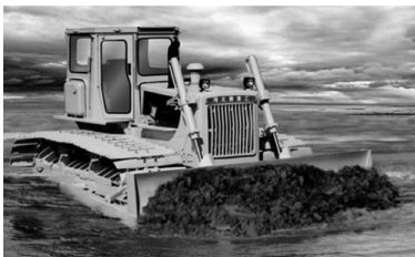
图1-6 湿地型履带式推土机

湿地型推土机（见图1-6）机身较宽，采用三角形宽履带板，接地长度加长，因而接地比压小，且底盘部分具有良好的防水密封性能。它主要用于浅水、沼泽地带作业，也能在陆地使用。