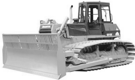
图 1-8 环卫型履带式推土机

了护栏，以增大铲刀容量并防止木桩等顶坏护板和水箱，履带行走系统采用中低比压，配备护板或履带防缠绕装置，发动机两侧安装防护板，驾驶室严格密封，可降低噪声和防止灰尘进入。