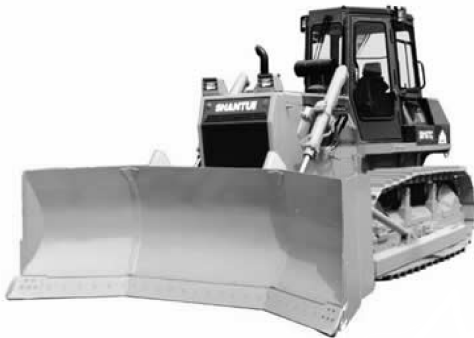
图 1-9 电厂型履带式推土机

电厂（推煤）型推土机（见图 1-9）主要用于火力发电厂推煤，配装大容量 U 形推煤铲。