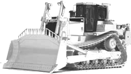
图 1-1 卡特彼勒公司的最大推土机 D11R CD 型

才开始引进生产 DS0 型履带式推土机，现在履带式推土机有 13 个系列，从 D21 ~ D575，最小的为 D21A 型，柴油机飞轮功率为 29.5kW，最大的为 D575A-3 SD 型（见图 1-2），柴油机飞轮功率达 858kW，它也是当前世界上最大的推土机；另外一家独具特色的推土机制造企业是德国利勃海尔（Liebherr），其推土机全部采用静液压驱动，该技术历经十几年的研究与发展，1972 年推出样机，1974 年开始批量生产 PR721 型、PR731 型和 PR741 型静液压驱动履带推土机，由于液压元件的限制，目前其最大功率仅为 295kW，型号为 PR751，主要为矿用。