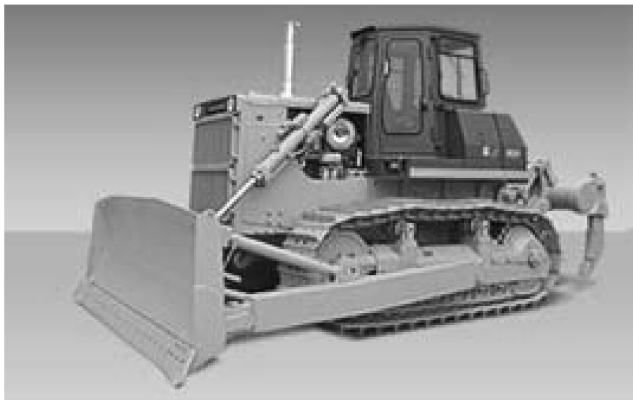
图 1-6 柳工 B220 型推土机

D80、D85、D155 的引进。如图 1-5 所示为小松著名的 D85 型推土机。国内企业生产的 200/220/230 级别的基本系列推土机及其底盘，绝大多数来自小松 D85 技术及其生产标准。例如柳工的 B220 推土机（图 1-6）、天津的移山 TYD220 及上海的 PD220 等都是基于引进的日本小松 D85A-18 技术生产。