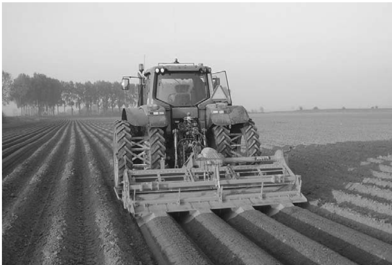
图 1-3 采用专用底盘的拖拉、打埂、播种机

达 8t，可江河浮游和空运。再如在现代化农业工程领域，为了满足大型机械化农耕的特殊要求，发展了很多专用机械底盘，如大型联合收割机底盘等，如图 1-3 所示为拖拉、打埂、播种机。国外大型农庄用于专业整修田埂及播种的大型拖拉机及配套作业机械采用专用底盘，其前后轮胎及车桥结构都是根据田埂整修和播种的专业需要而特制。最小离地间隙值比一般的工程机械也要大许多。如图 1-4 所示的大型拖拉机，采用双轴 8 个人字纹大轮胎的专用底盘，这种底盘既能满足快速行进的耕作需要，又能有效减低接地比压，保护新耕土地不被压实，同时确保机械在新鲜土壤上的足够抓地力。