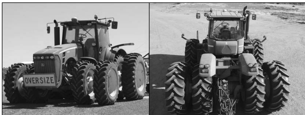
图 1-4 采用专用底盘的大型拖拉机