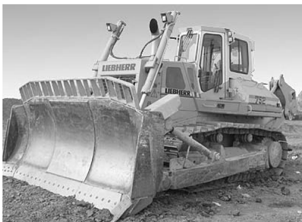
图 1-7 德国利勃海尔 PR752 大型推土机

德国生产的工程机械产品一直以品质优良,技术先进,经久耐用著称,受到各国的欢迎,尤其是斗轮挖掘机,一直是世界上的主要生产国,全球最大的斗轮挖掘机出自德国。世界上第一台液压全回转单斗挖掘机也是德国德马克公司首先生产出来的。如图1-7所示为德国利勃海尔 PR752 大型推土机。