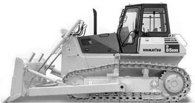
图 1-5 小松 D85 型推土机

日本原有的技术基础比较落后，通过大量购买专利，与国外公司进行技术合作等途径来进行发展。例如日本神户制钢公司在消化了引进的 545H 型、645H 型、745H 型轮式装载机后，自己设计并制造出日本最大的轮式装载机。小松公司通过从国外大量引进技术并经过消