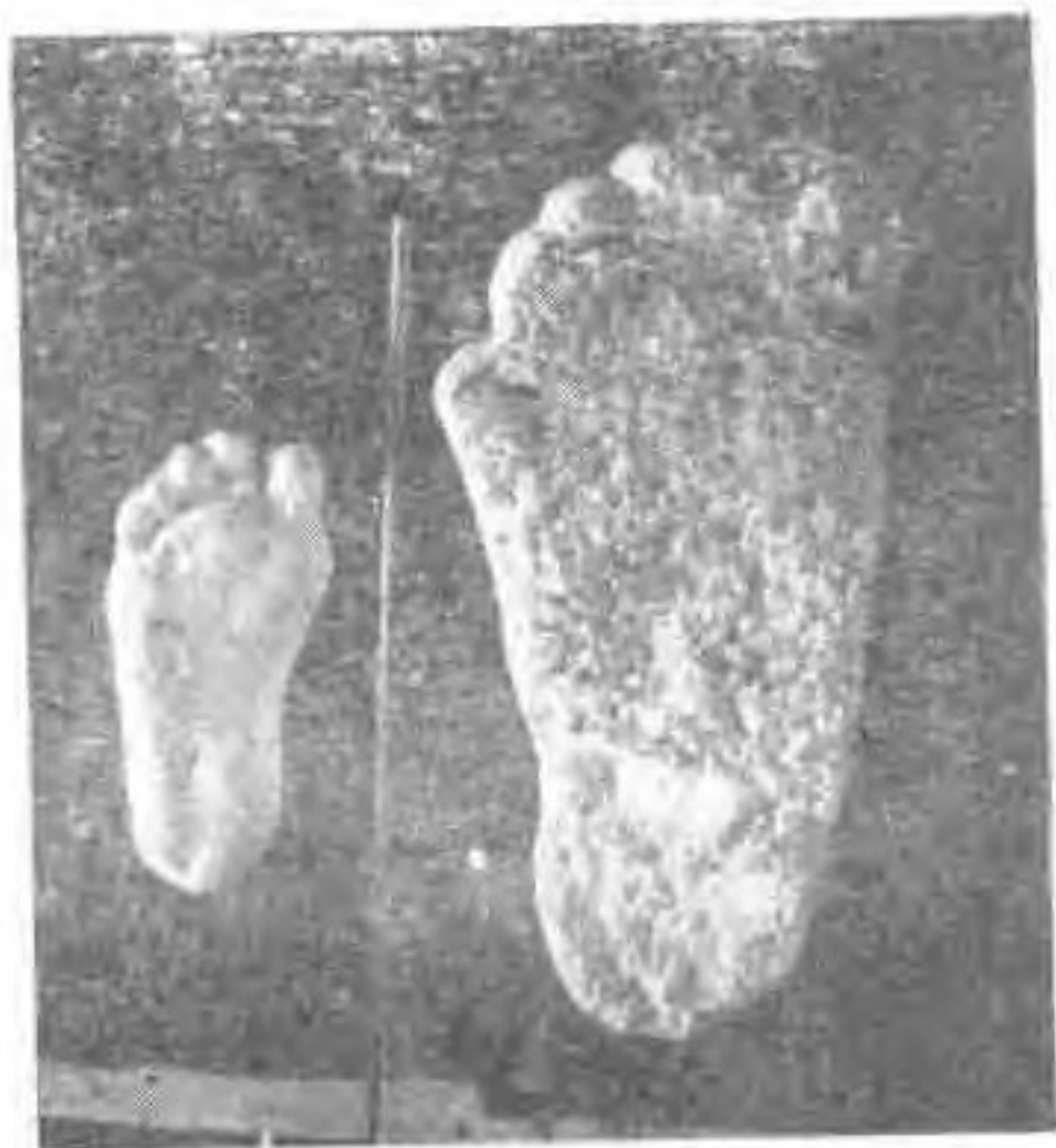
人脚印（左）与野人脚印的比较