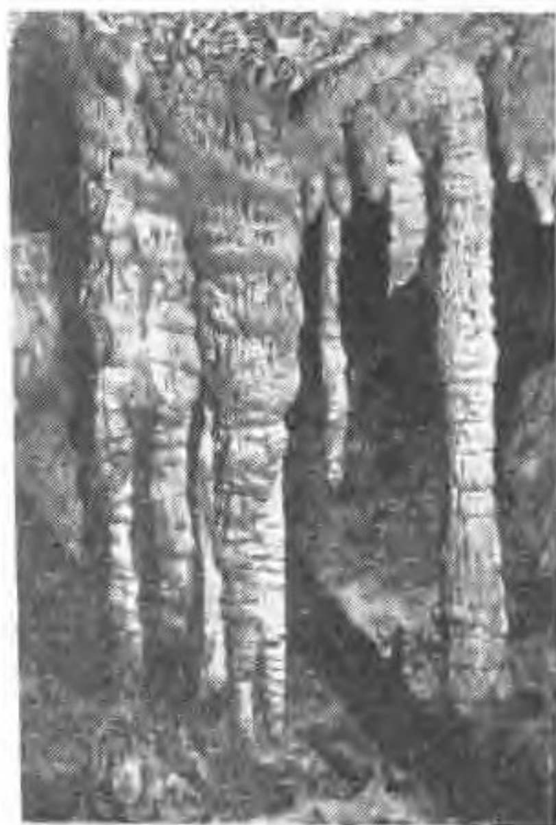
三宝洞中石林景观