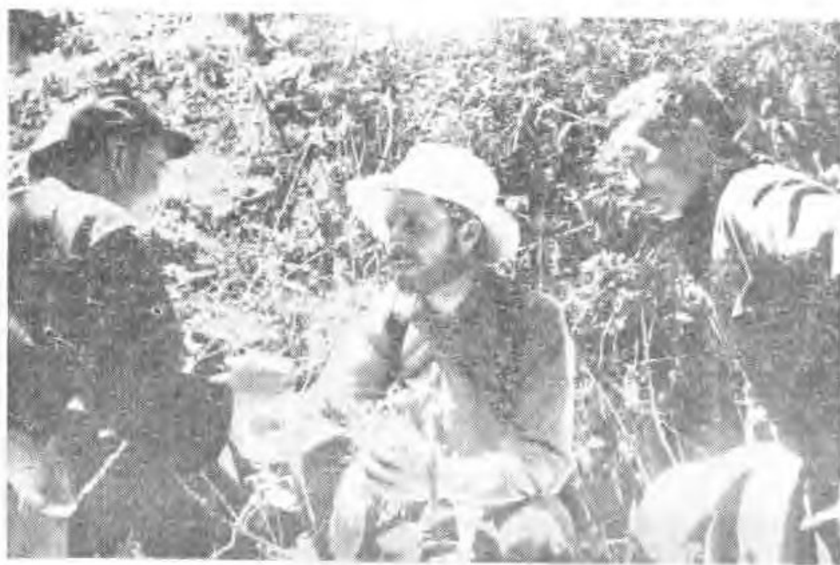
中、美植物考察队在林区