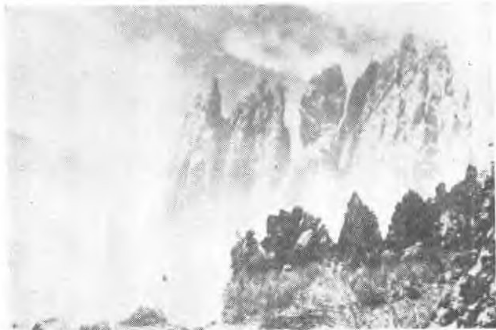
剑峰石——炬炬岩一角