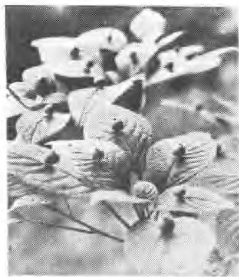
叶上珠——叶上花 老汉背娃娃