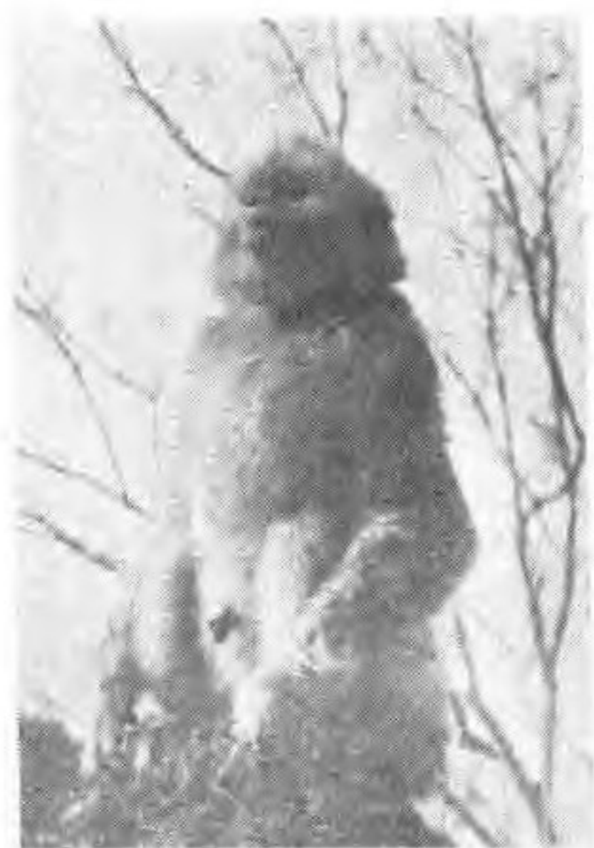
金 丝 猴