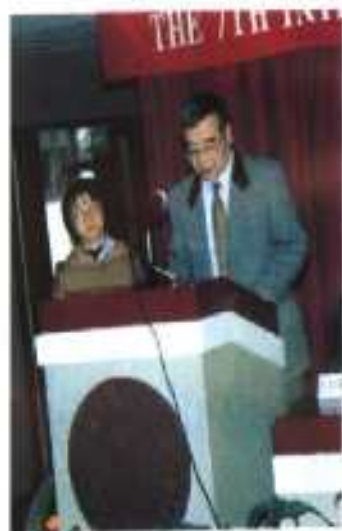
◎ 8. 武井正魂(联合国教科文组织代表)在大会闭幕式上致词