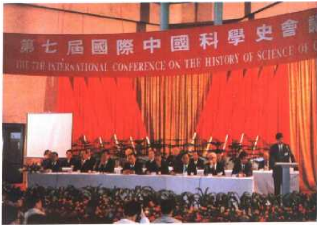
◎ 1. 大会开幕式会场