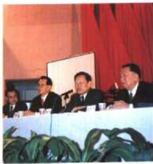
◎ 7. 杨振宁(右二)作演讲