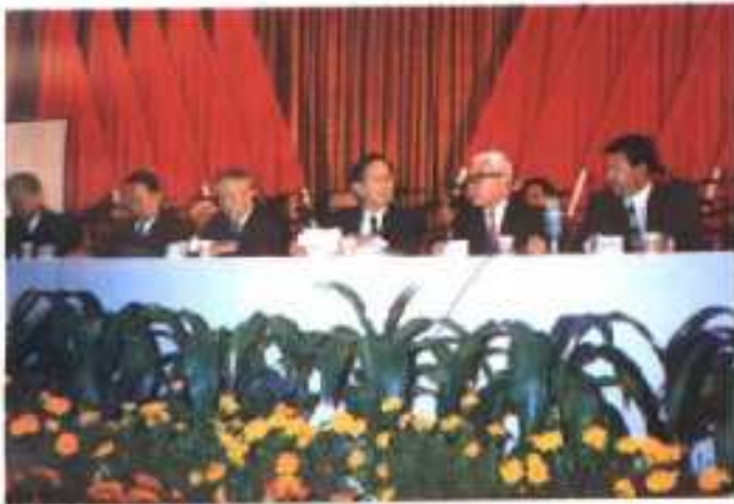
◎ 2. 大会开幕式主席台(左起: 杨振宁、吴阶平、武衡、路甬祥、席泽宗、虞德海)