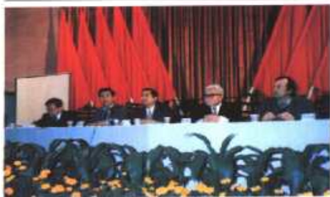
◎ 4. 大会报告会主席台(左起: 杨振宁、程贞一、廖克、席泽宗、维快)