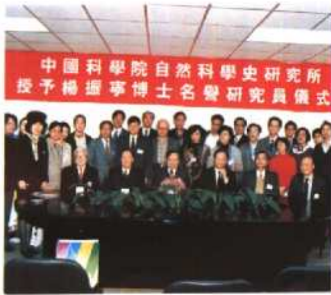
◎ 12. 杨振宁(前坐左三)荣获中国科学院名誉研究员