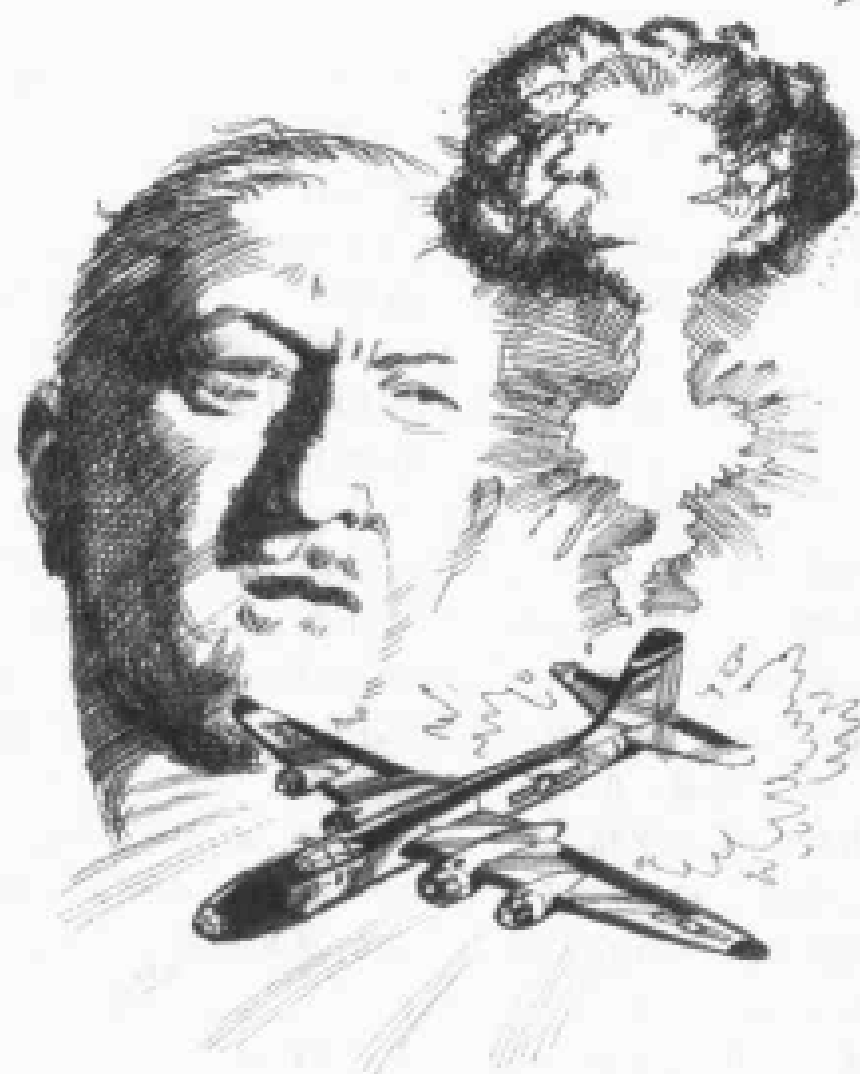
蘑菇烟云——“曼哈顿工程”