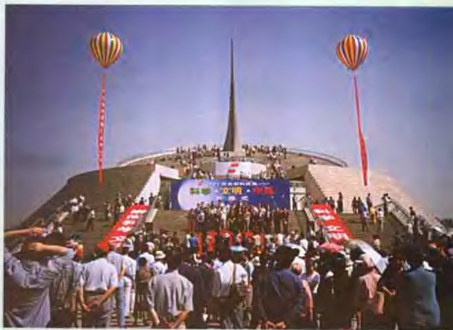
北京科技周开幕式主会场。