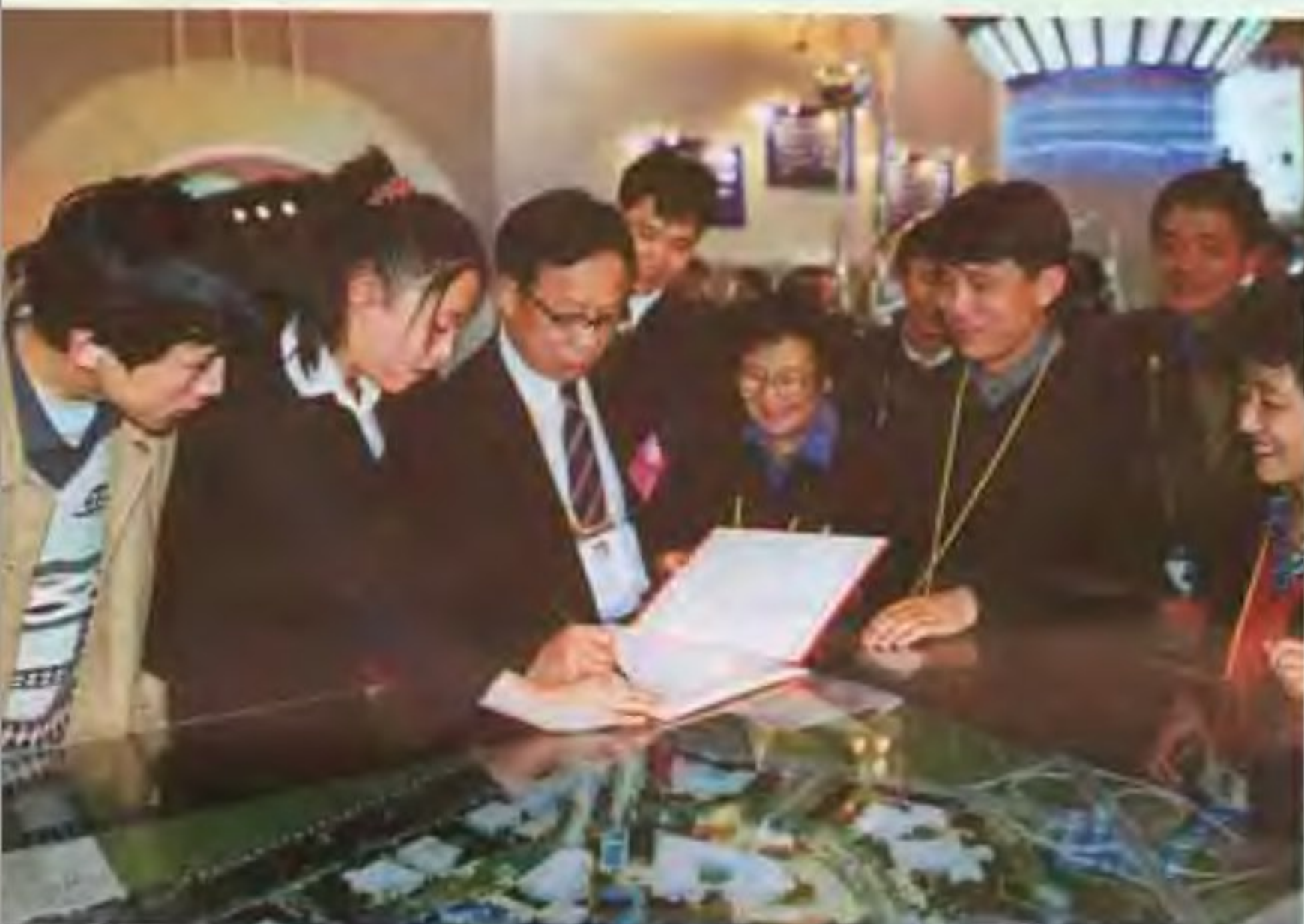
科技部副部长马颂德同志在863展览会北京展台签字留念。