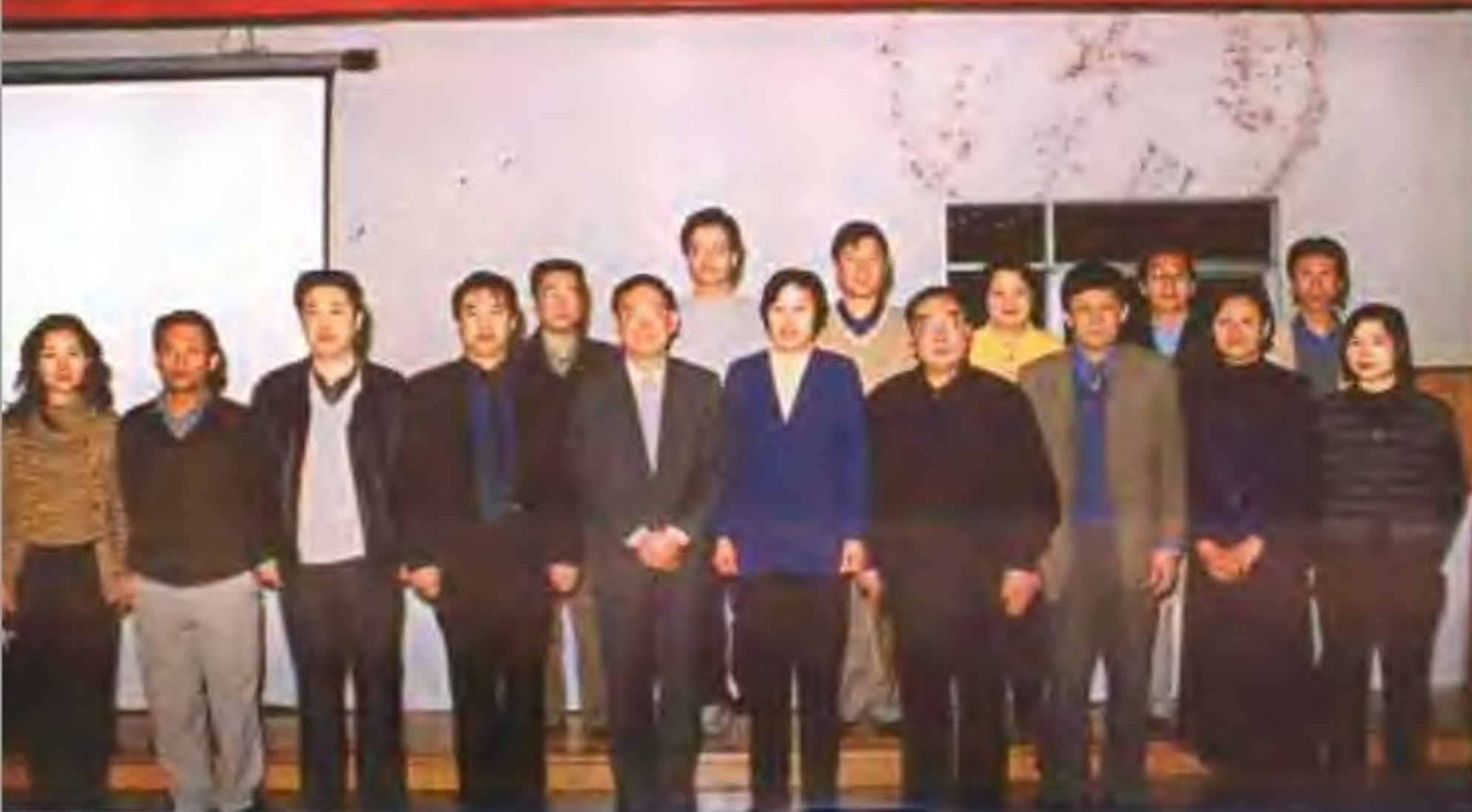
市科委机关档案工作成功晋升市一级。