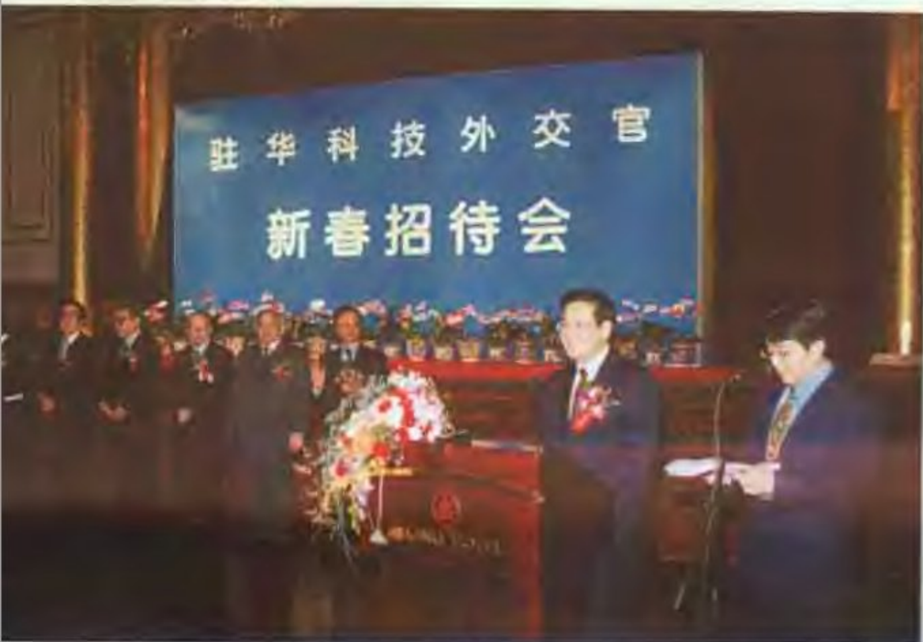
北京市科委主任范伯元同志在科技外交官新春茶话会上发表热情洋溢的讲话。