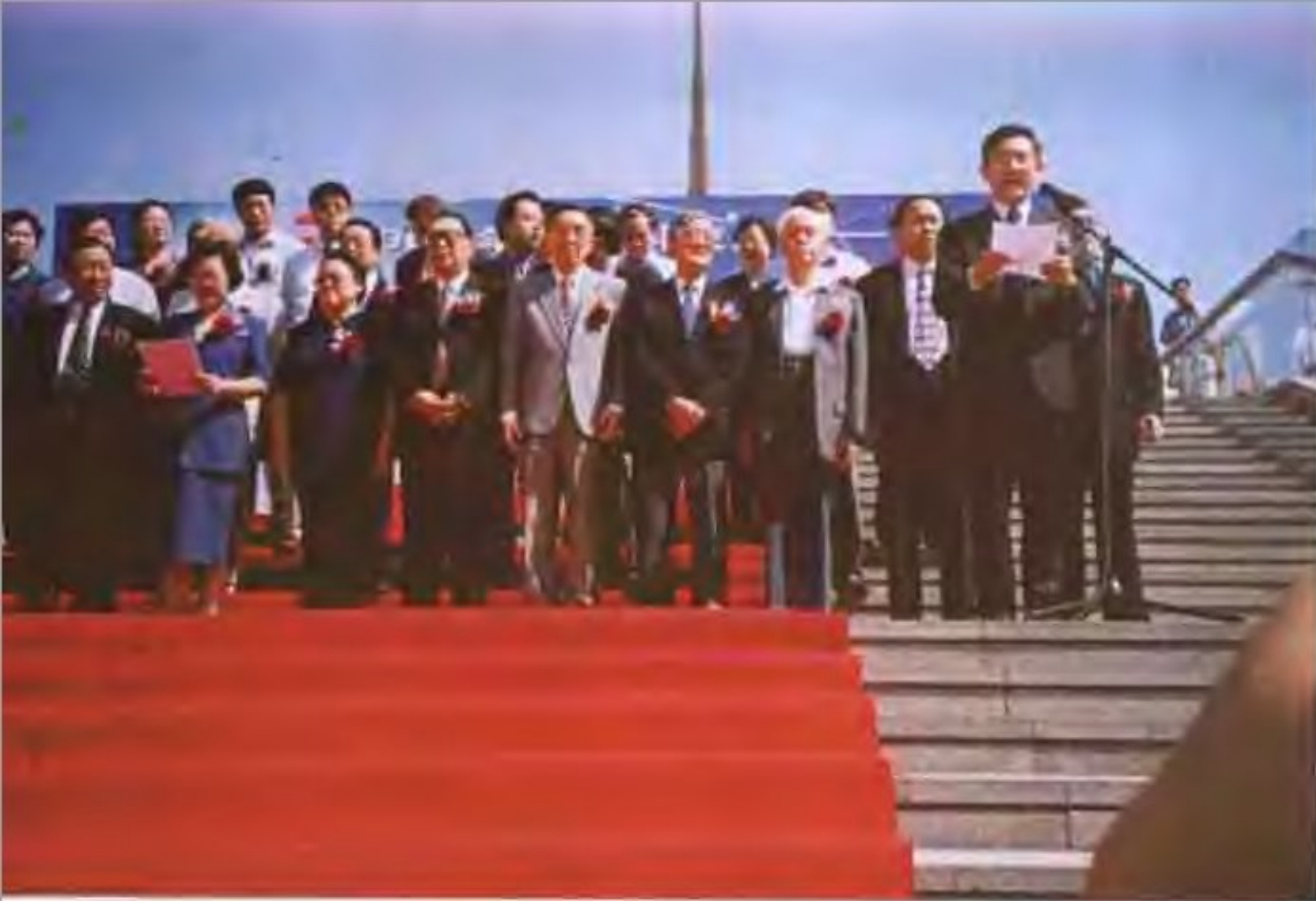
2001年5月16日，北京科技周开幕，市科委主任范伯元主持开幕式。