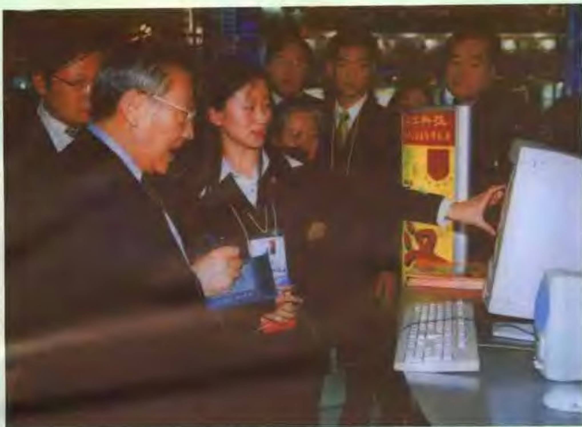
中共中央政治局常委、国务院副总理李岚清同志在863展览会北京展团汉王科技展台前亲自操作计算机手写输入。