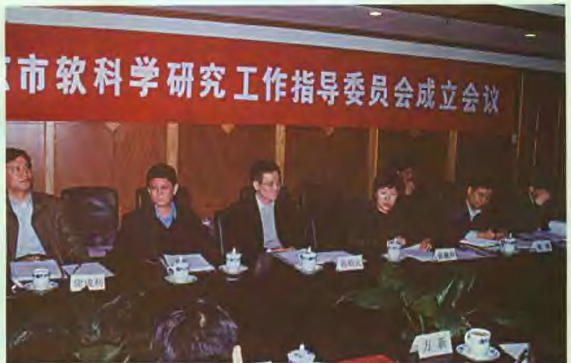
2001年3月22日，北京市软科学研究工作指导委员会成立，为北京市软科学研究工作提供咨询和指导。