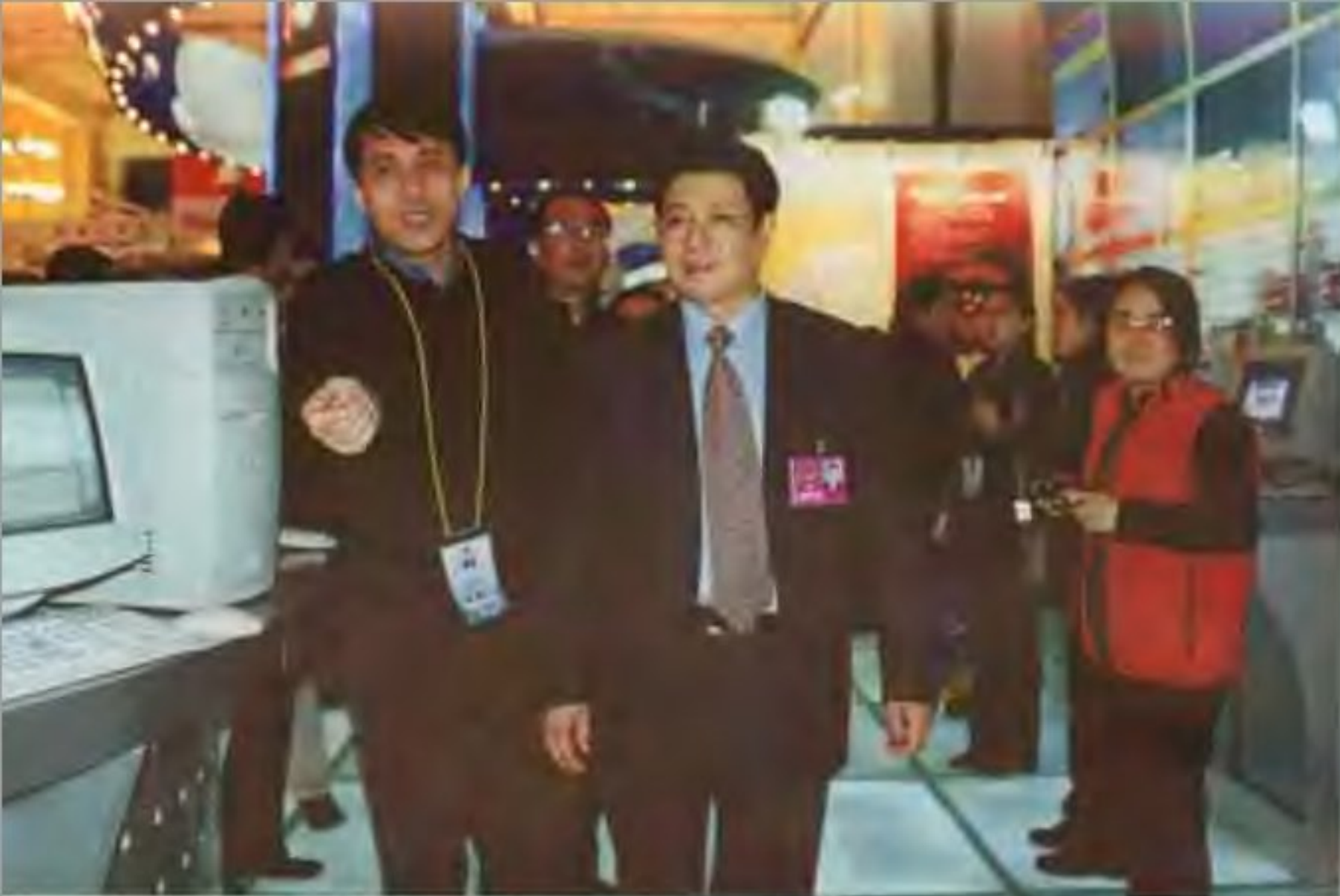
国务委员王兆国同志兴致勃勃来到863展览会北京展团参观指导，并提词“祝北京科技腾飞”。