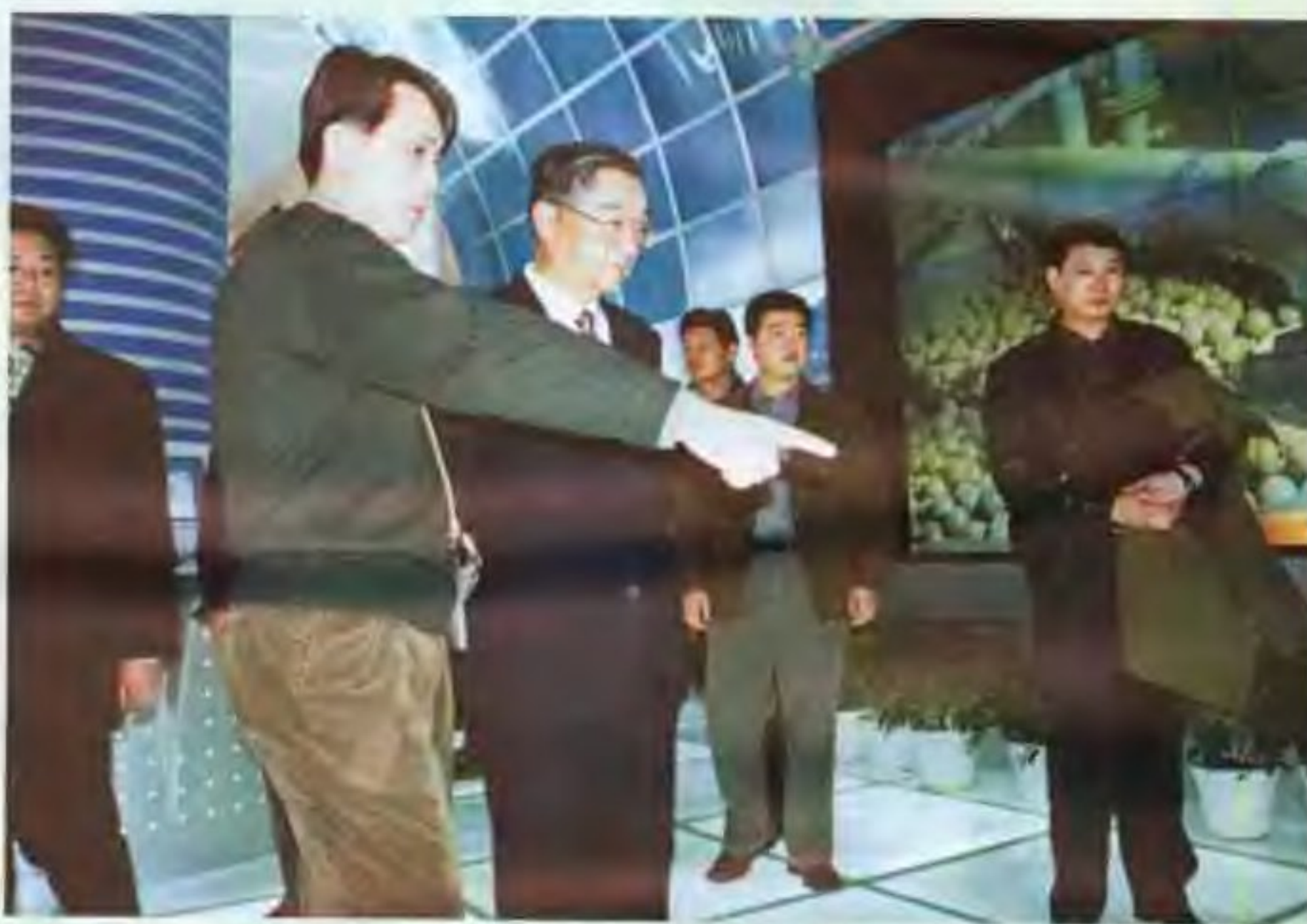
全国政协副主席胡启立同志参观863展览会北京展团。