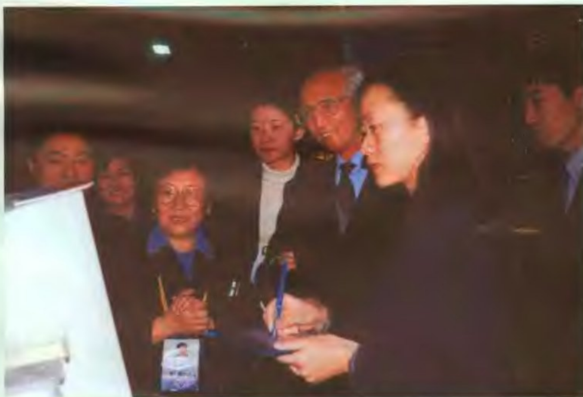
全国政协副主席、全国工商联主席经叔平同志参观北京展团。