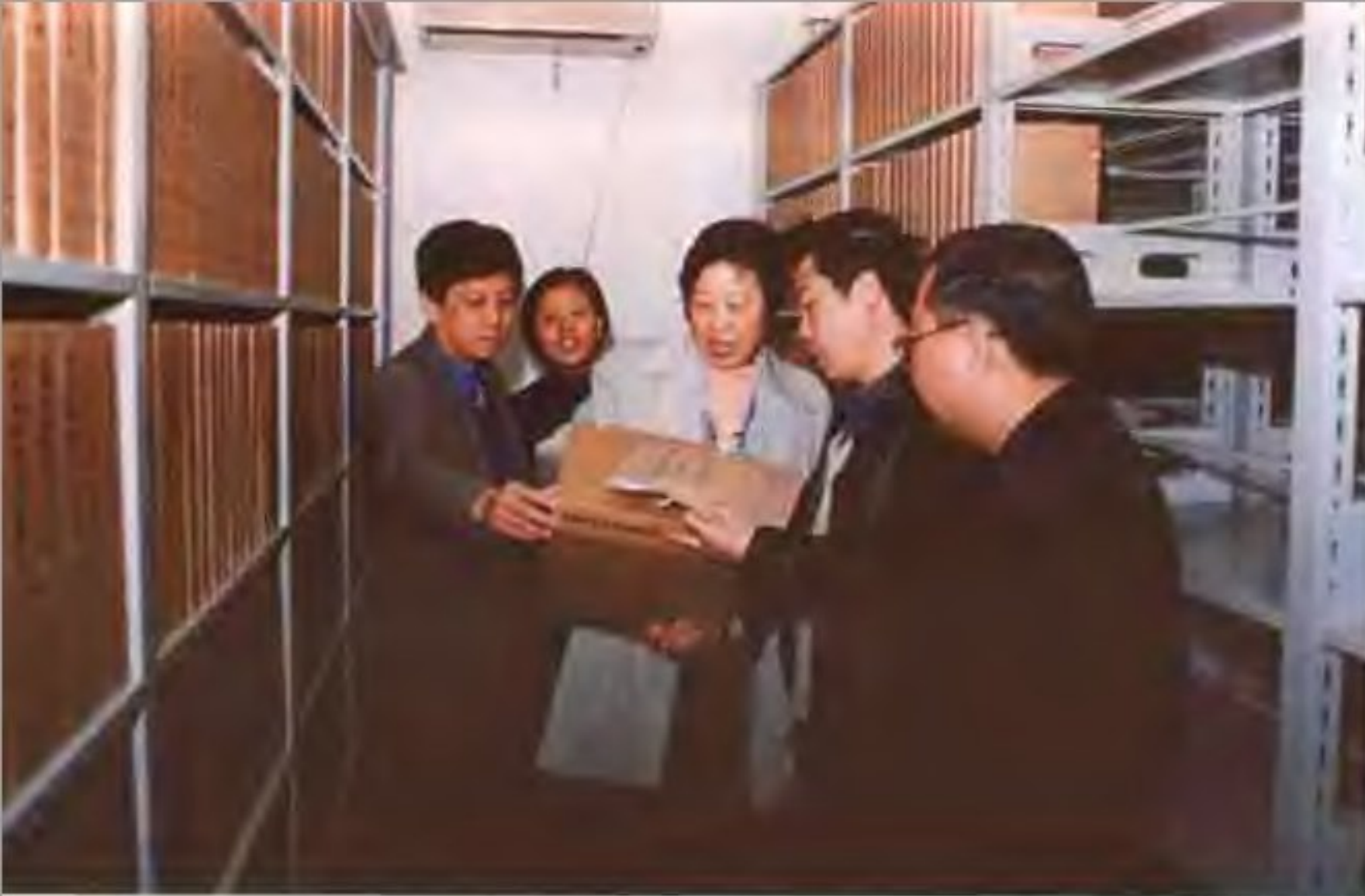
2001年12月12日，北京市科委机关档案工作接受市档案局考评组的现场检查。