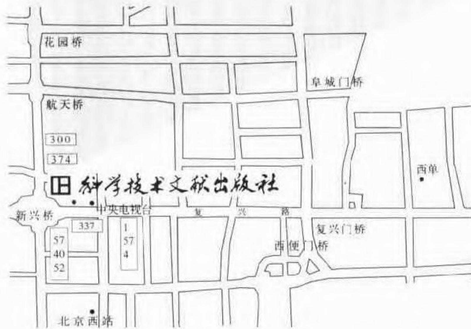
科学技术文献出版社方位示意图