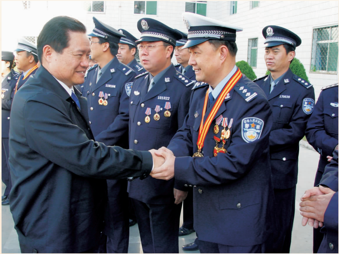
2004年5月4日,中共中央政治局委员、书记处书记、国务委员、公安部部长周永康视察银川市公安局工作