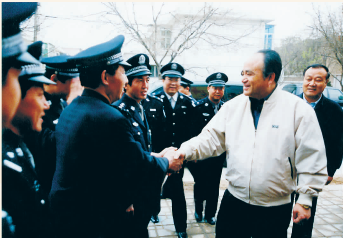
1996年6月30日,自治区党委书记毛如柏检查银川市公安工作