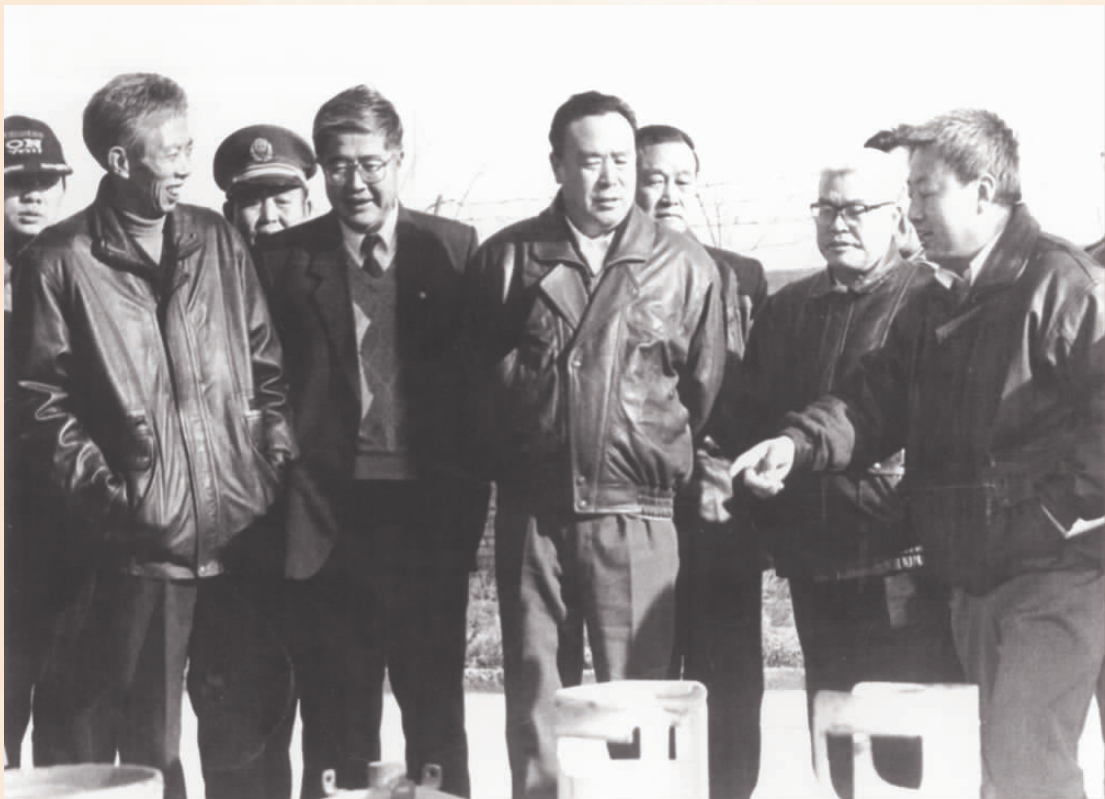
原自治区党委书记黄璜、自治区主席白立忱检查银川市公安消防工作