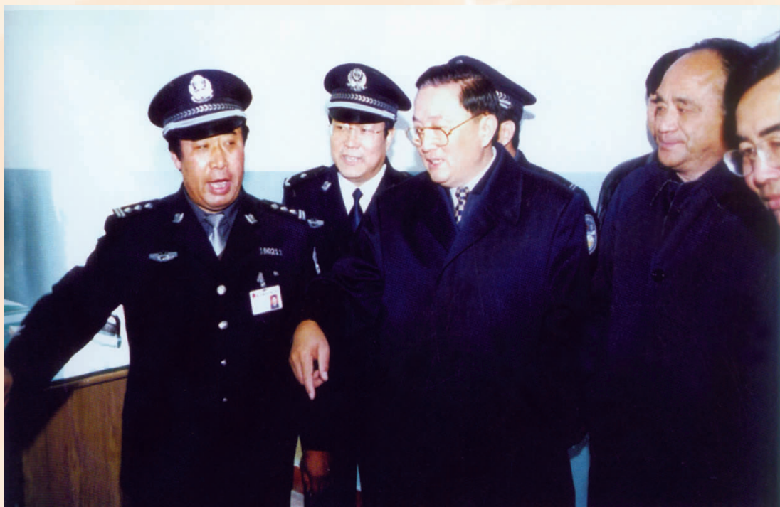
2000年11月，中共中央政治局委员、书记处书记、中央政法委书记罗干(前中)视察银川市公安工作