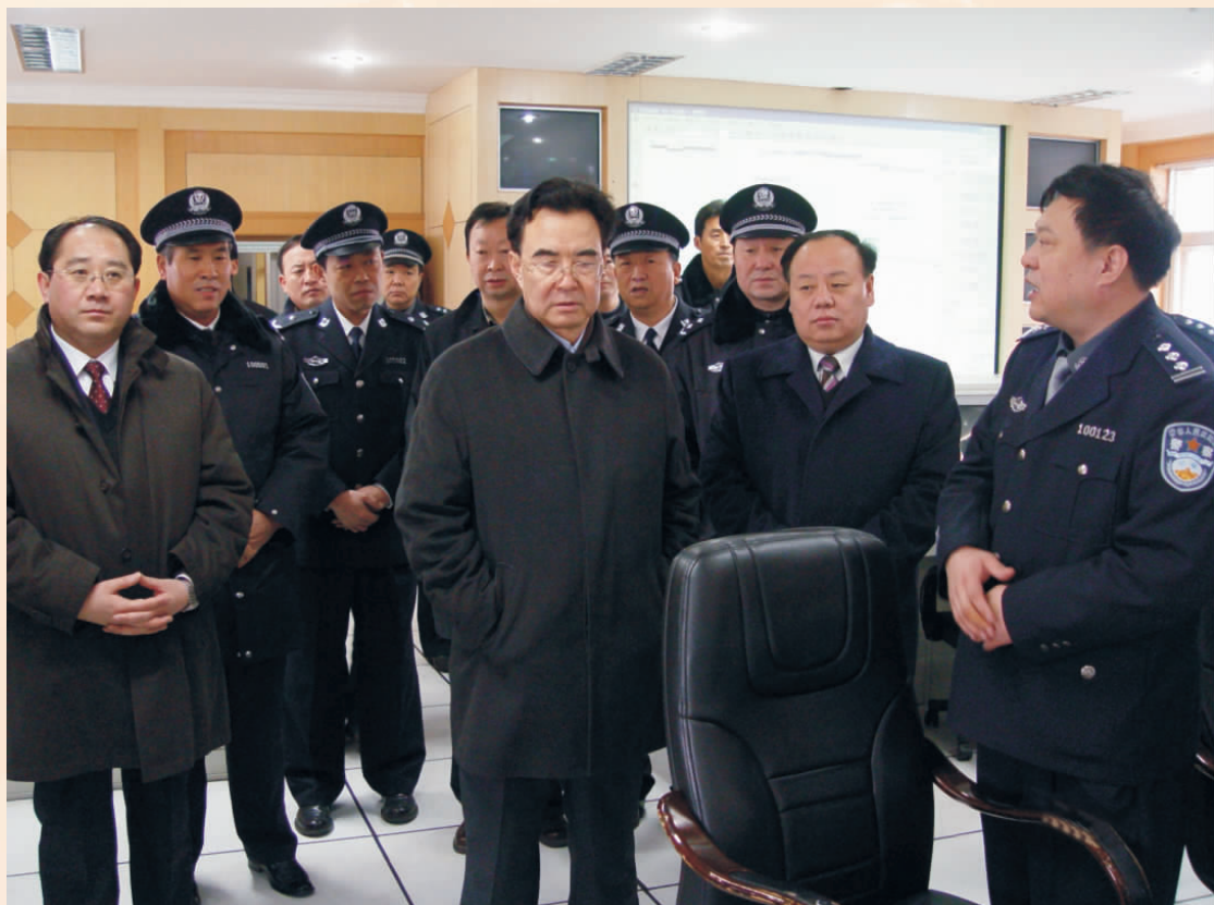
原自治区主席马启智检查银川市公安工作