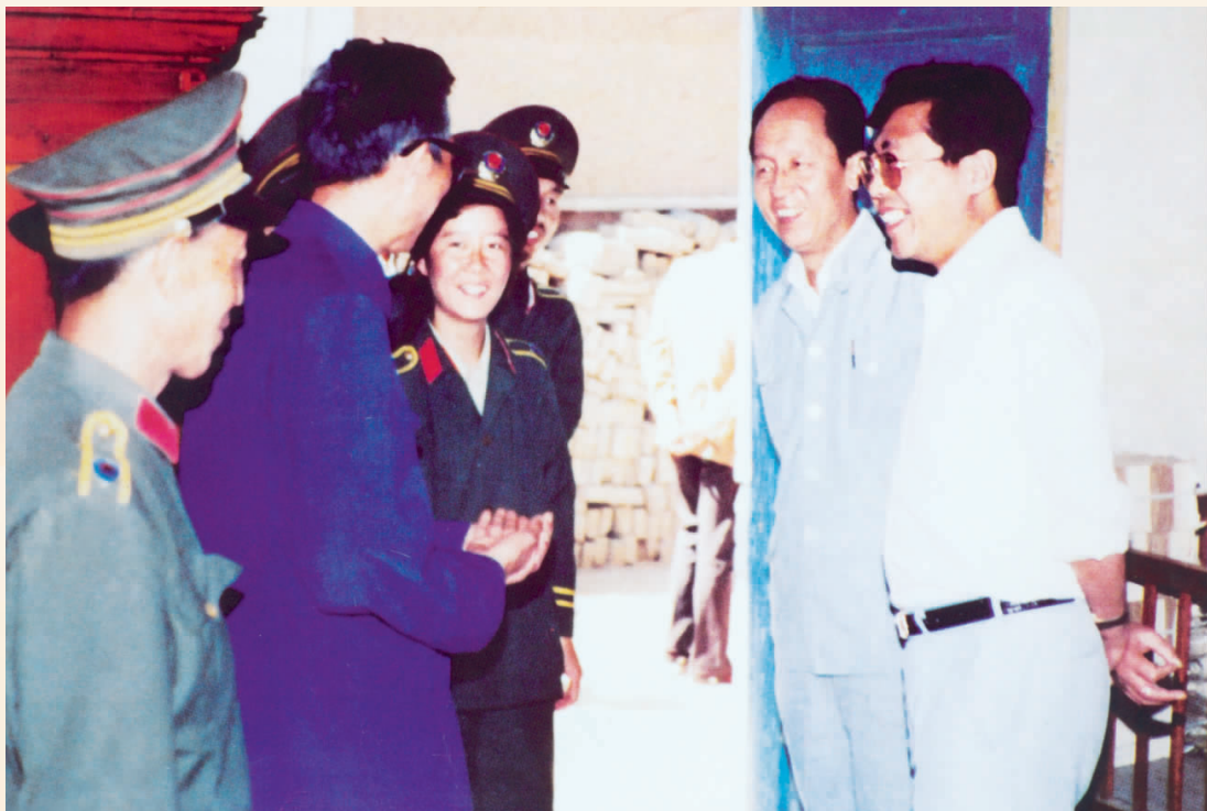
1985年，原公安部部长阮崇武(右一)视察宁夏公安工作