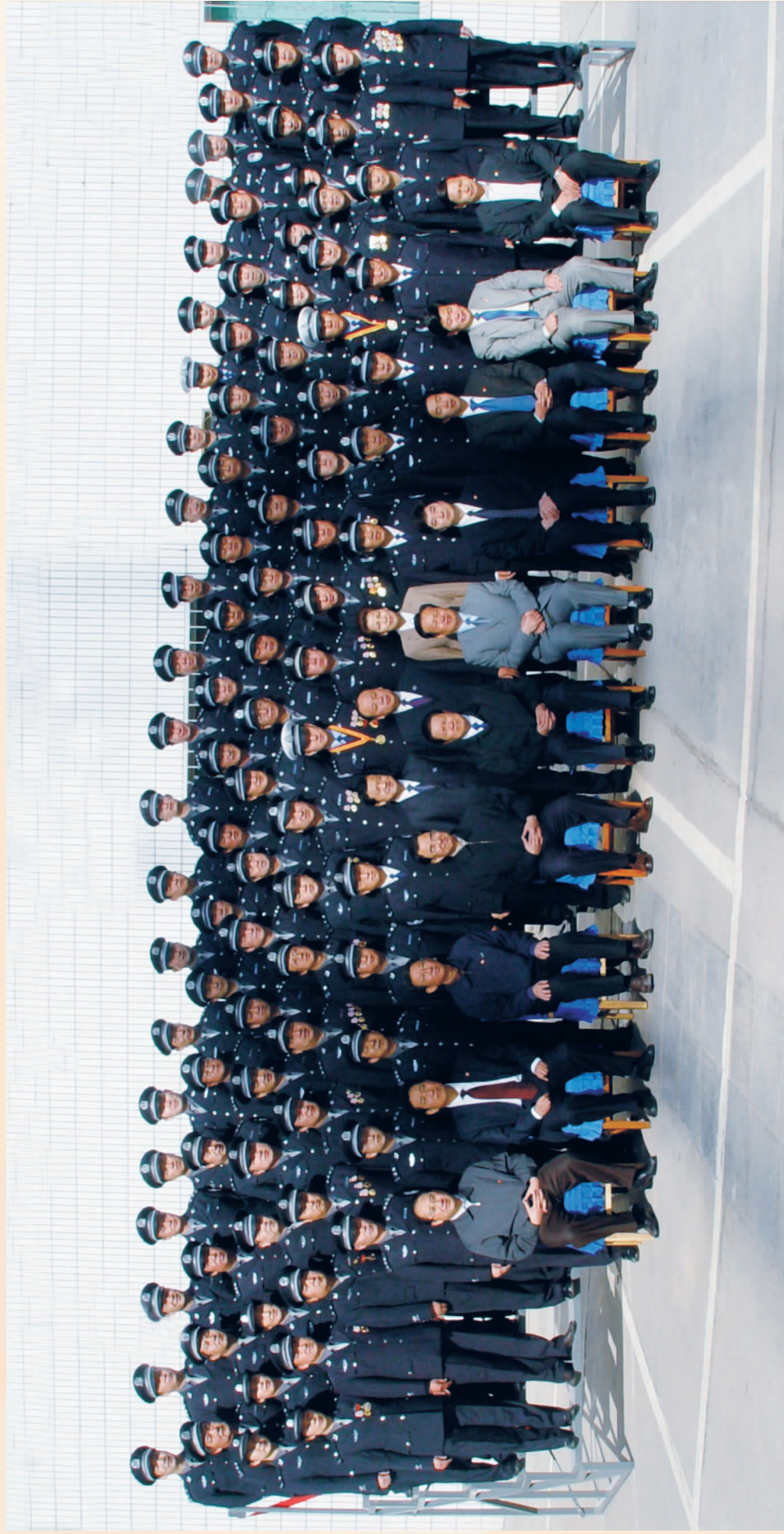
原公安部部长周永康与银川市公安民警合影