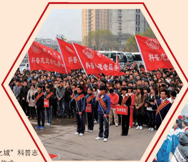
沧州 “好人之城” 科普志愿者行动启动仪式。