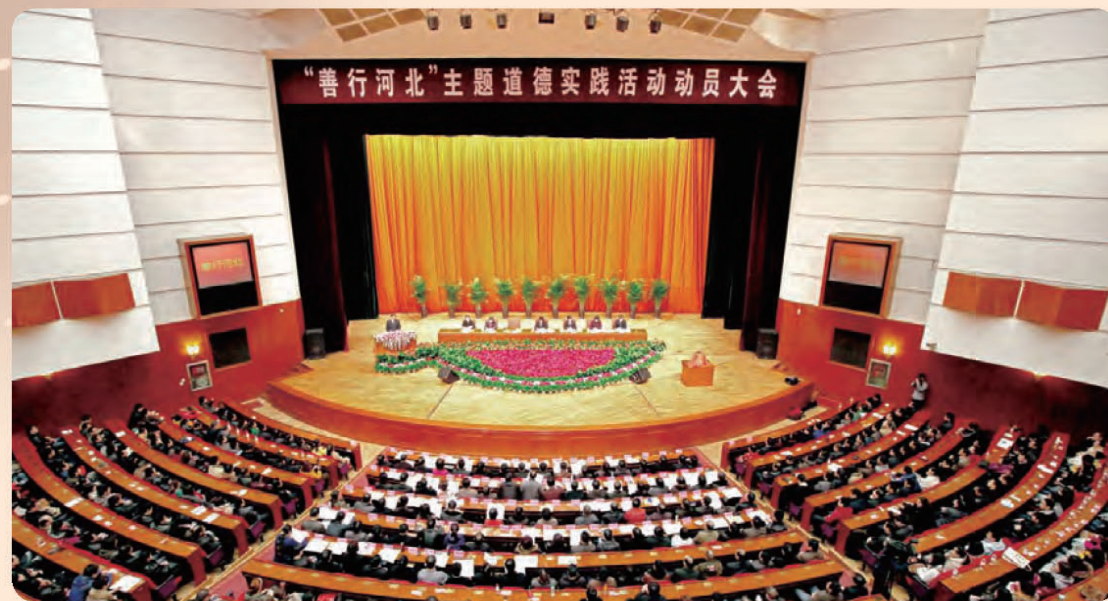
◎ 河北省文明委在全省启动“善行河北”主题道德实践活动。