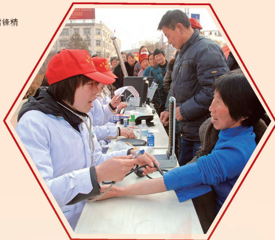
唐山 迁西县开展“弘扬雷锋精神·服务滦河时代”活动。