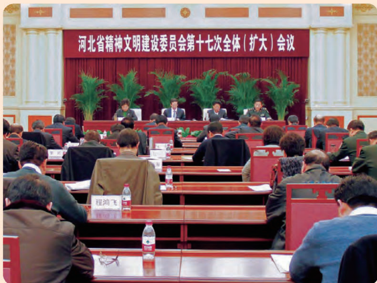
◎ 河北省文明委第十七次全会审议通过《“善行河北”主题道德实践活动方案》。