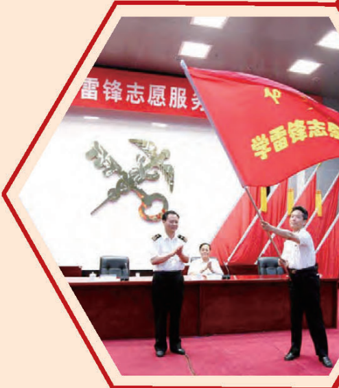
石家庄海关成立学雷锋志愿服务队。