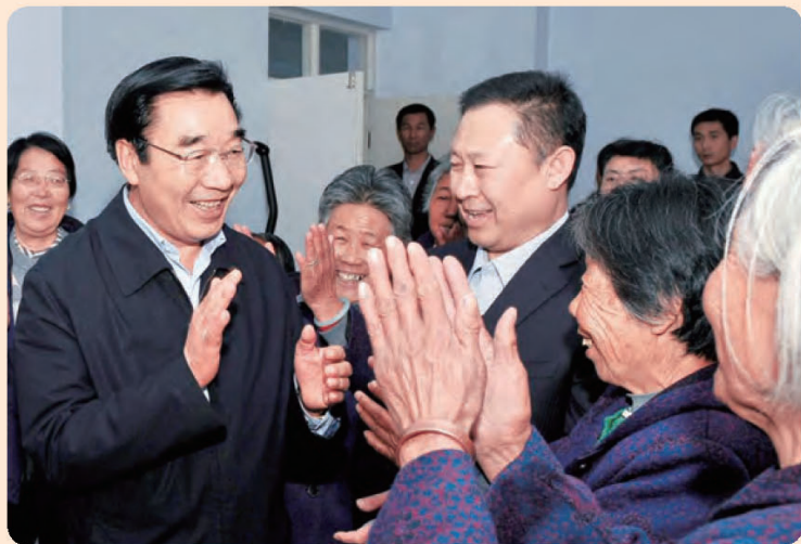
◎ 河北省委书记、省人大常委会主任张庆黎亲切看望道德模范范振喜。