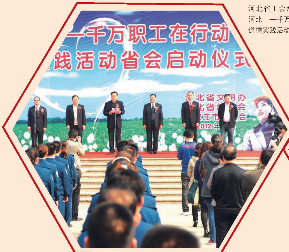
河北省工会系统开展了“善行河北 一千万职工在行动”主题道德实践活动。