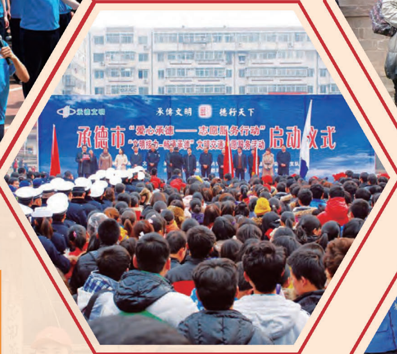
承德社会各界群众积极参与“积善承德”主题道德实践活动。