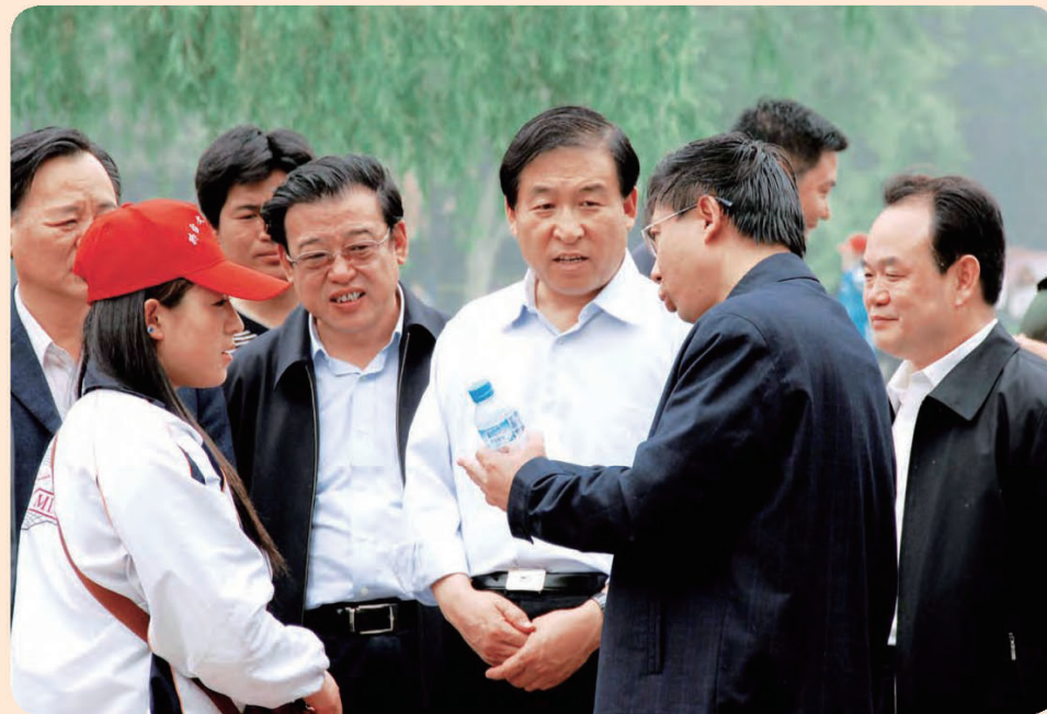
◎ 中央文明办专职副主任王世明在河北调研精神文明建设工作。