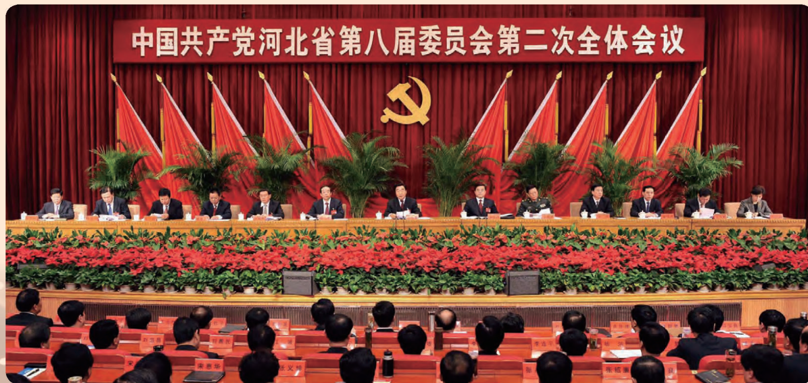
◎ 河北省委八届二次全会通过了《中共河北省委关于贯彻落实<中共中央关于深化文化体制改革、推动社会主义文化大发展大繁荣若干重大问题的决定>的实施意见》，就加强社会主义核心价值体系建设、推动社会主义道德建设进行了具体安排。