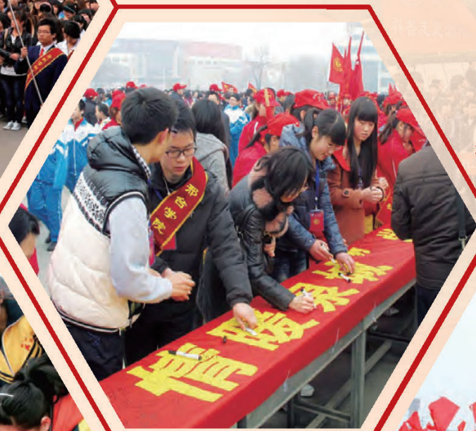
邢台 启动“善行邢襄 情暖泉城”主题道德实践活动。