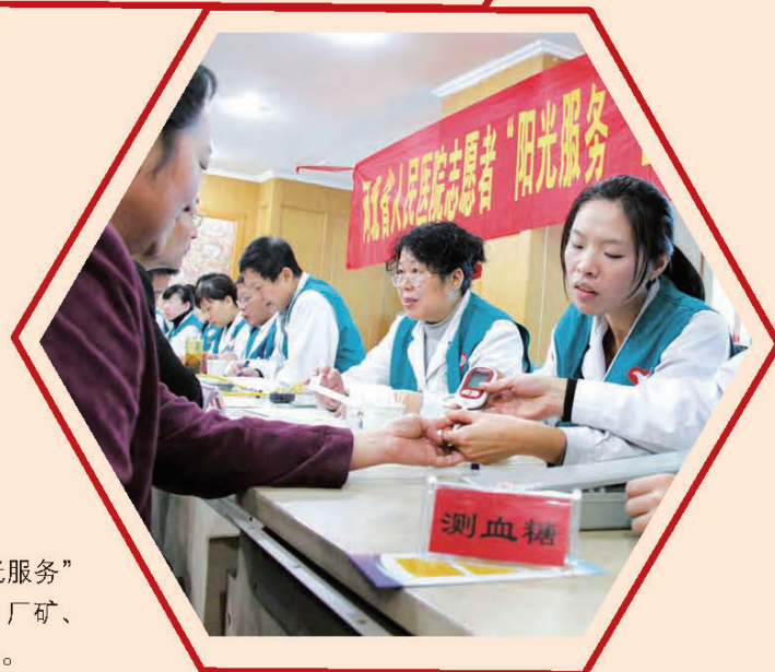
河北省人民医院组织“阳光服务”志愿者医疗队深入到机关、厂矿、社区为群众送医送药送健康。