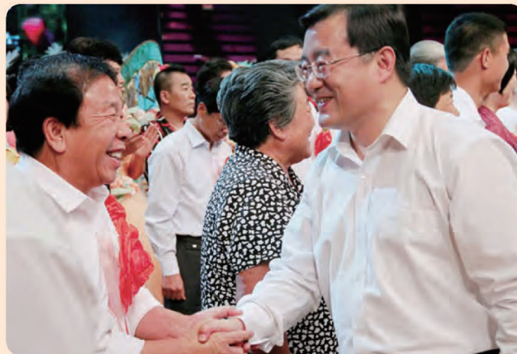
◎ 河北省副书记、省长张庆伟与全国道德模范亲切握手。