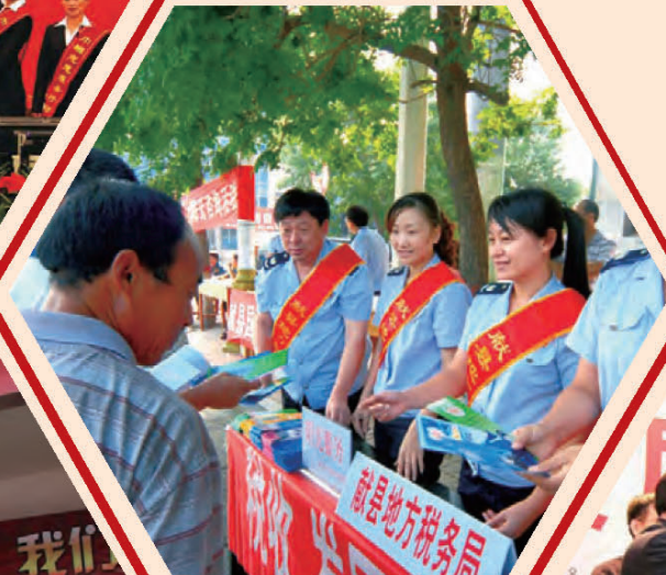
河北省地税系统开展“善行地税 德系民生”主题实践活动。