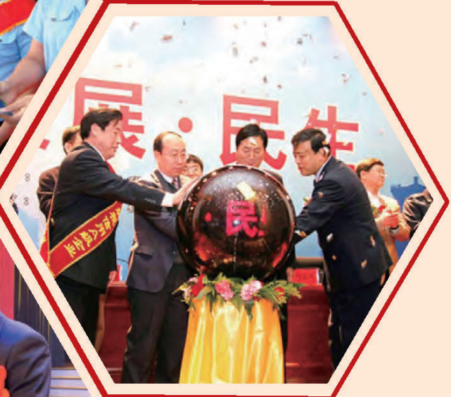
河北省国税局启动全省税收宣传月活动，打造“诚信国税”。