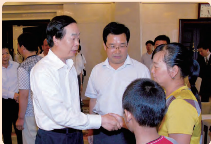
◎ 河北省副书记、省文明委主任赵勇看望“最美农民工”王俊旺家属。