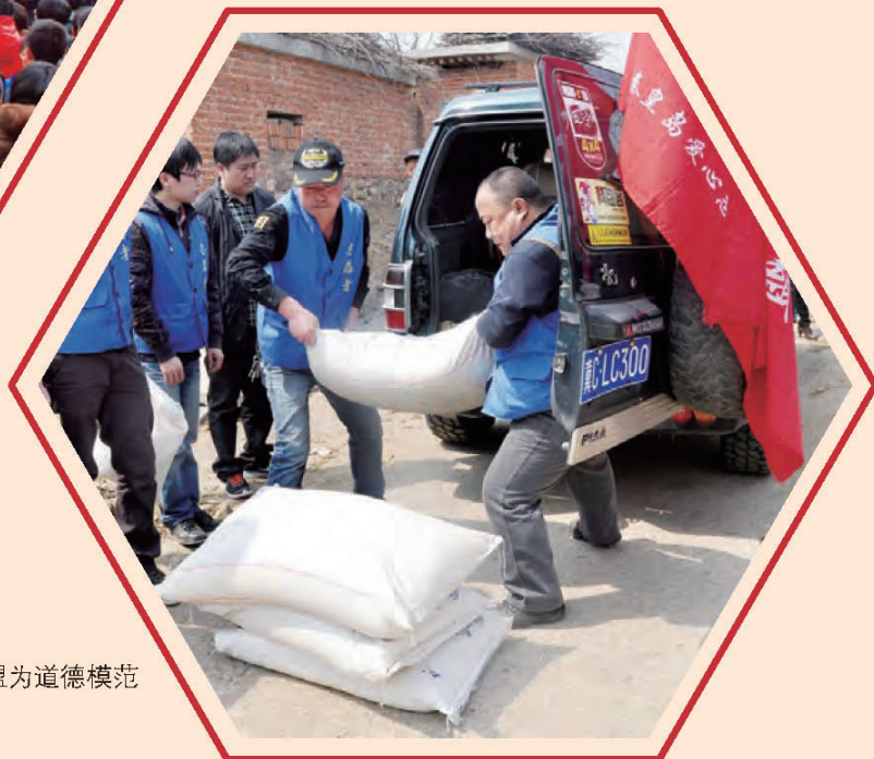
秦皇岛爱心志愿者联盟为道德模范送慰问品。