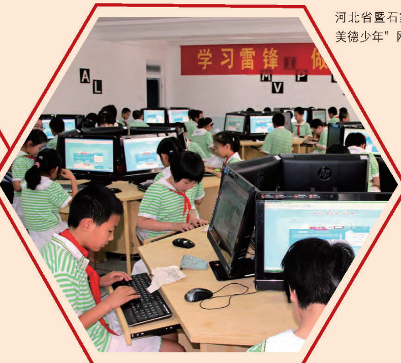
河北省暨石家庄市“学习雷锋 做美德少年”网上签名寄语活动启动。