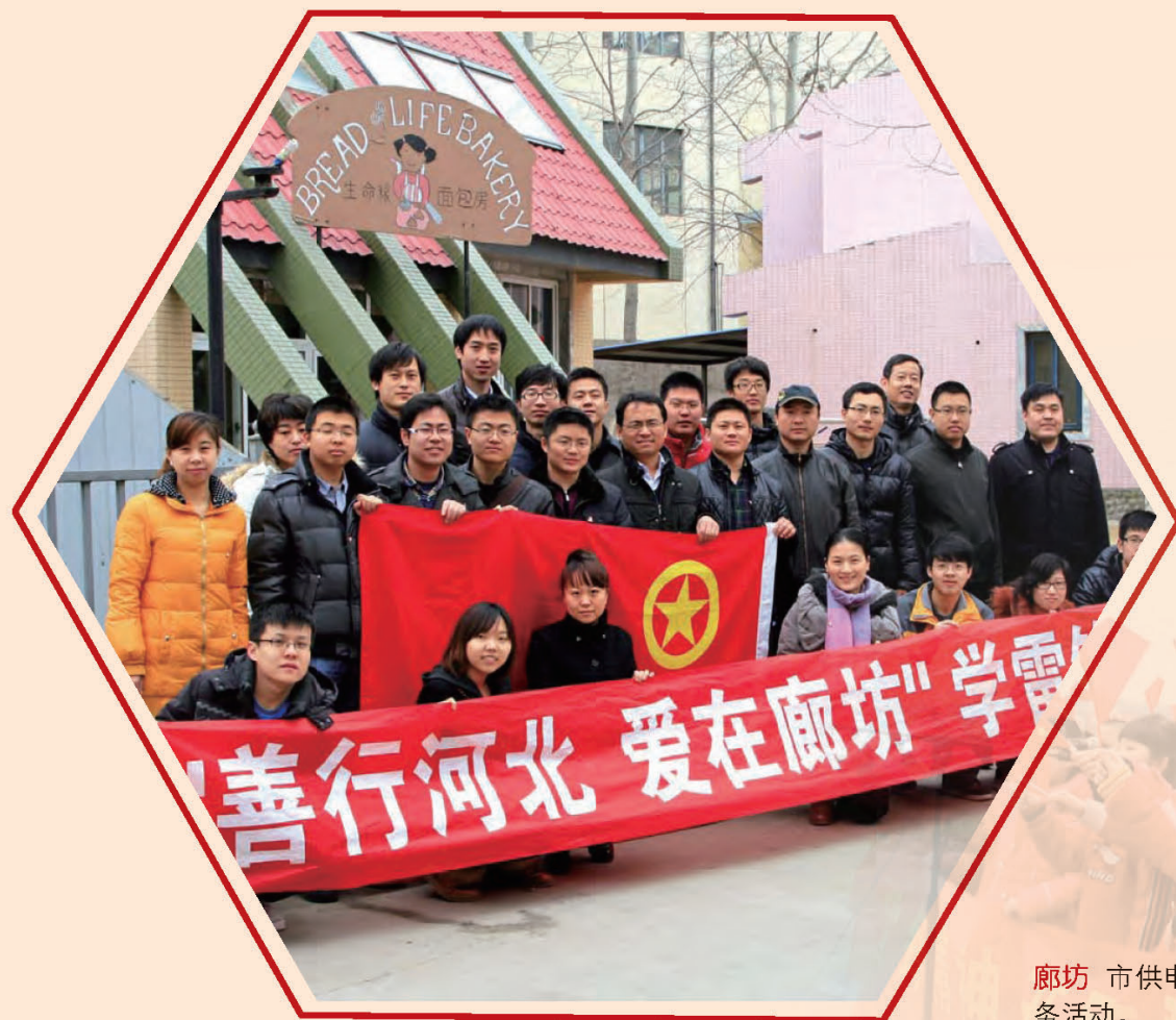
廊坊 市供电公司在福利院开展志愿服务活动。