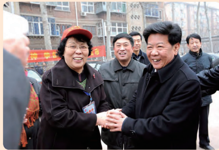
◎ 河北省常委、宣传部长、省文明委常务副主任艾文礼慰问社区志愿者。