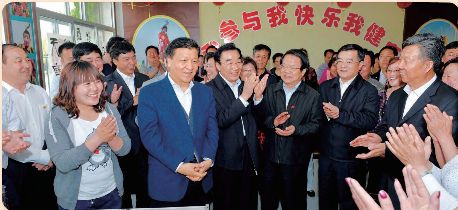
◎ 中共中央政治局常委、中央书记处书记、中央精神文明建设指导委员会主任刘云山在张家口调研时说：“‘善行河北’活动，我觉得搞得非常好”，对“善行河北”主题道德实践活动给予了充分肯定和巨大鼓舞。

“善行河北”主题道德实践活动，作为推动社会主义核心价值观体系落地生根的重要探索，作为广泛兴起“学雷锋”活动高潮的重要工作，得到了中央及中宣部、中央文明办领导的关注关怀，为活动广泛深入开展提供了有力支持。