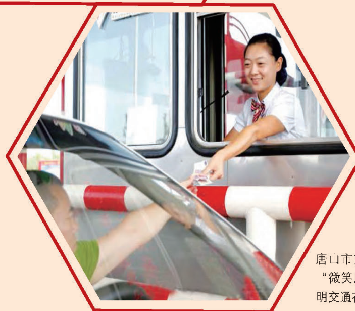
唐山市交通运输系统开展“微笑服务构筑和谐·文明交通在您身边”活动。