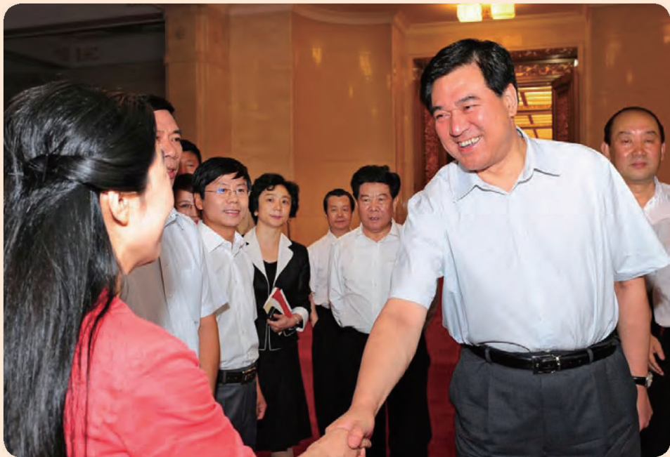
◎ 中宣部副部长申维辰接见青县思想道德建设先进经验报告团成员。