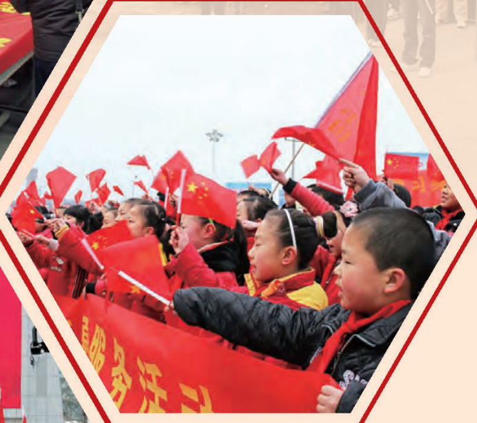
保定 望都县“学雷锋”主题实践活动启动仪式。