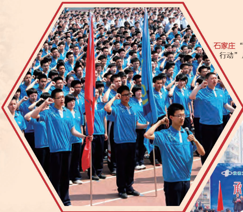
石家庄“构建道德社会·我们在行动”启动仪式。