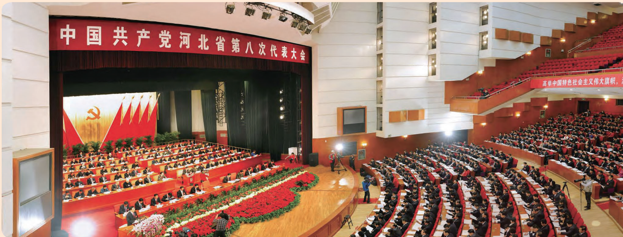
◎ 河北省第八次党代会开启了建设经济强省、和谐河北的新征程，对加强社会主义道德建设，为建设经济强省、和谐河北提供道德支撑和精神动力提出新的要求。