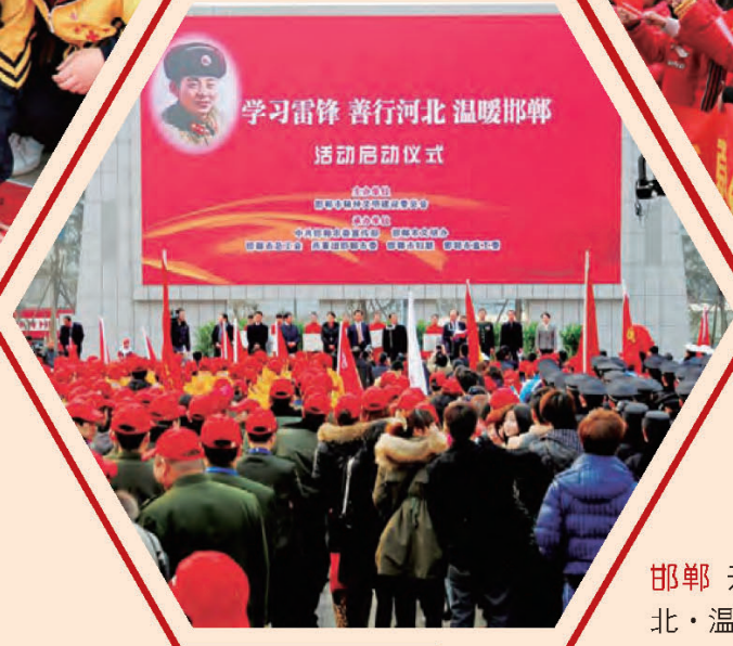
邯郸 开展“学习雷锋·善行河北·温暖邯郸”活动。