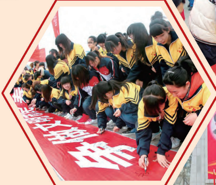
衡水 争做文明市民签名寄语活动。