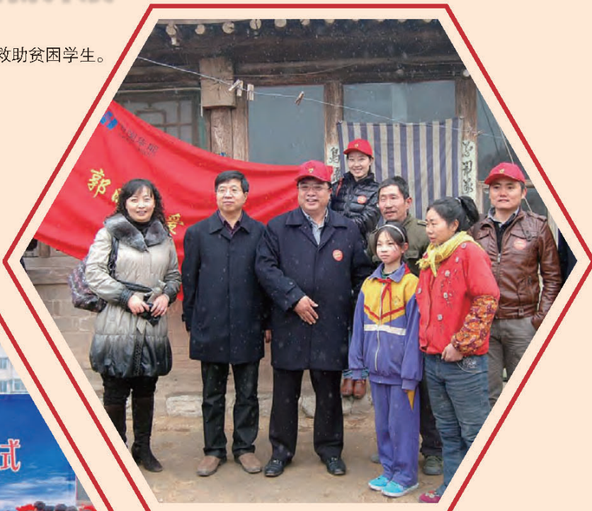
张家口爱心志愿者救助贫困学生。