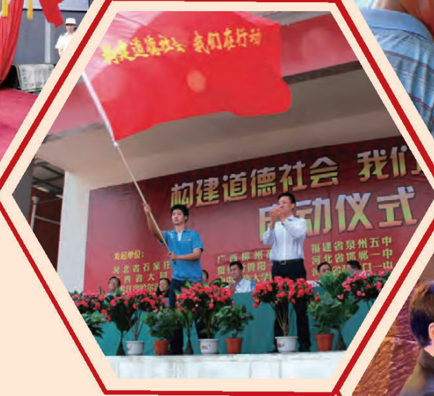
团省委在石家庄一中组织开展“构建道德社会我们在行动”活动。