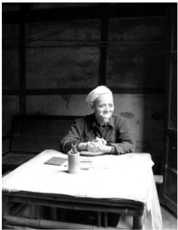
古镇上的“八字先生”