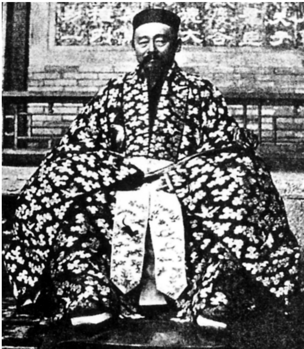
看风水的道士先生

这些人有一套凭肉眼看地形、地势的本领。他们仪表斯文，衣冠楚楚，年龄多在40岁上下，一般不挂招牌，全凭熟人推荐，奔走于官绅之家，为人相宅