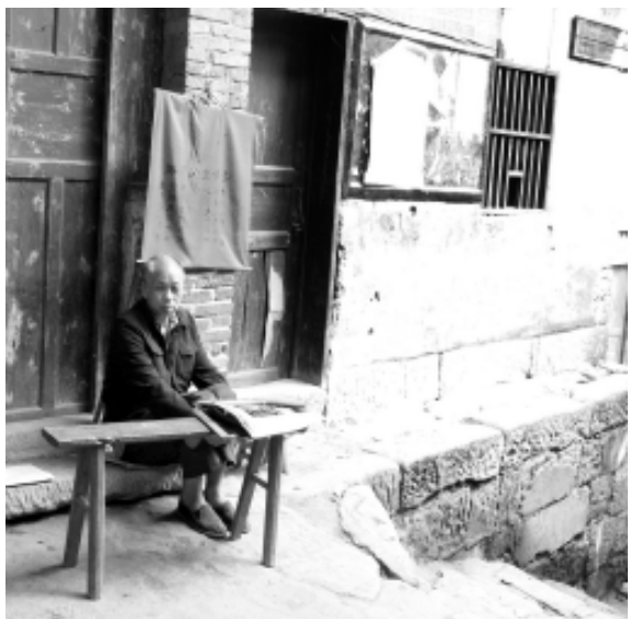
乡场边的算命先生

不但阳宅讲风水，连城市街道的起名也有风水民俗。以老重庆为例，城门“开九闭八”象征九宫八卦；南山上有文峰塔，城里就衬文华街；南岸有狮子山，城里就设白象街。相辅相成，寓意吉祥。由此看来，古人讲究风水不过是希望逢凶化吉，避祸趋福的一个方式而已。