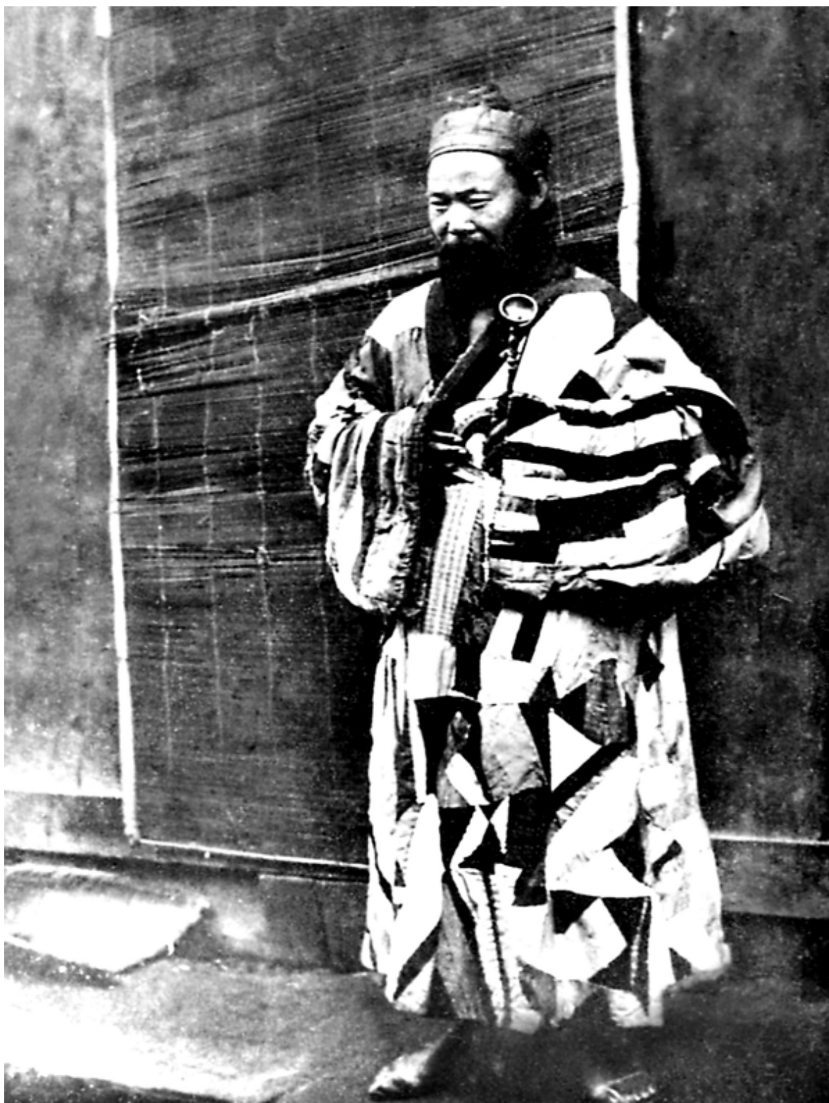
看风水也是道士谋生的一种手段

火 的锅 又动最 实惠物初 肉起 这脏源 或于 是头初 火天 锅蹄门 的锅 的加头 形入一 辣带 椒。当 而真时的 正的姜一 的重码 庆头 毛工 肚人 火吃 锅一