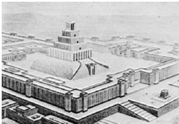
巴比伦的庙宇塔楼

编,法律条文一般都是对具体法律问题的个别规定,缺乏理论抽象和一般原则,反映出传统习惯法和判例法的强大影响。因为楔形文字法系是人类历史上最早形成的一个法系,它的形成和发展在世界法律发展史上具有划时代意义,它不仅标志着古东方法从习惯法阶段进入成文法阶段,而且代表着人类成文法律的开端。楔形文字法独立于宗教之外,以强制性规范确立奴隶主阶级的统治秩序,有效调整古东方早期奴隶制国家的社会关系。其法律特征之鲜明,其条文规定之缜密,其文字表述之准确,都是人类其他早期法所不能比拟的。楔形文字法不仅是古东方文明的灿烂明珠,代表了古东方文明的伟大成就,而且通过米诺斯文明,通过波斯帝国的法律,通过希伯来法对西方文明产生了深刻影响。