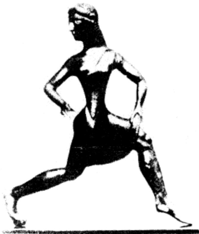
斯巴达女子接受军事训练的青铜像(公元前 6 世纪)

斯巴达是公元前 8 世纪左右建立的古希腊奴隶制城邦之一，位于伯罗奔尼撒半岛东南。在城邦中居于统治地位的是斯巴达人，处于被统治地位的是希洛人（国有奴隶）和少数皮里阿西人（半自由民）。统治者和被统治者的人数差别悬殊，阶级关系异常紧张，斗争相当尖锐。为了随时准备抗御外部侵扰和镇压内部希洛人的反抗，全体成年斯巴达人（特别是男子）都被编入军队，全国无异于一个大军营。斯巴达教育，具有单纯军事体育的性质，是由这种社会状况决定的。