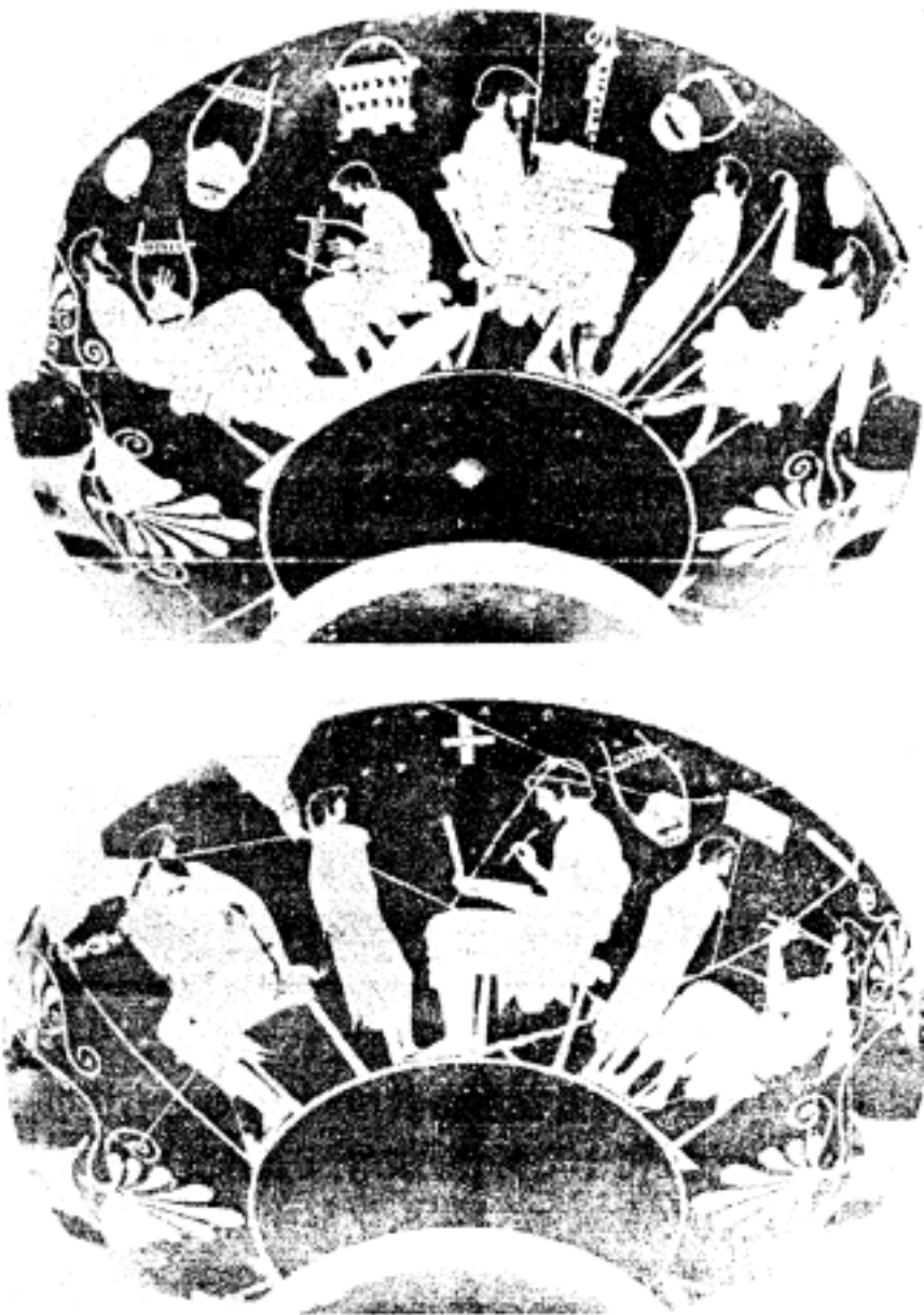
古代雅典陶器上描绘的音乐教育育的情景

习乐器,再教以简单宗教诗歌和抒情诗,然后把乐器与诗歌合在一起演唱,最后还要学唱荷马史诗片段。音乐教育的目的在于陶冶学生的性格和道德品质。