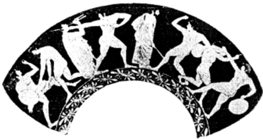
古代雅典陶器上描绘的体育教育的情景

跳跃、角力、掷铁饼、投标枪)及游泳、舞蹈。这些运动项目首先着眼于发展学生的体力。但在技能技巧上,要求达到步履轻快敏捷,活动准确平稳,动作协调优雅,姿势柔软美观;在精神意志上,要求经常保持坚韧刚毅,勇敢进取,并善于抑制和把握自己的情绪。雅典人对精神意志方面的锻炼比对技能技巧上的训练更为重视。为使体操活动能够与文法学校和音乐学校的学习和谐配合,各项体操练习,常常伴以箫笛琴弦的吹奏。