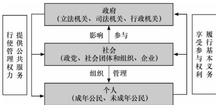
图 1—2 现代社会的权力结构

从根本上说，政府的公共性建立在人民主权的原则之上。人民主权原则被认为是宪政体制下现代政府的第一原则。该原则规定了政府权力的来源和归属，其基本精神是，国家及其代理机构——政府的权力来自国民的同意，并从根本上说属于全体国民。“主权属于人民。它由人民通过选举和全民投票方式，以及通过有立法权、行政权和司法权的专门机构行使之” ① （见图1—2）。