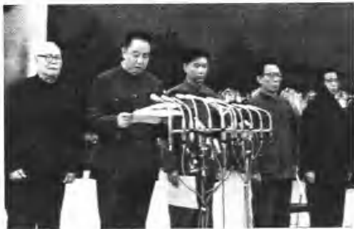
在天安门广场举行的追悼毛泽东百万人大会的主席台，左起：叶剑英、华国锋、王洪文、张春桥、江青