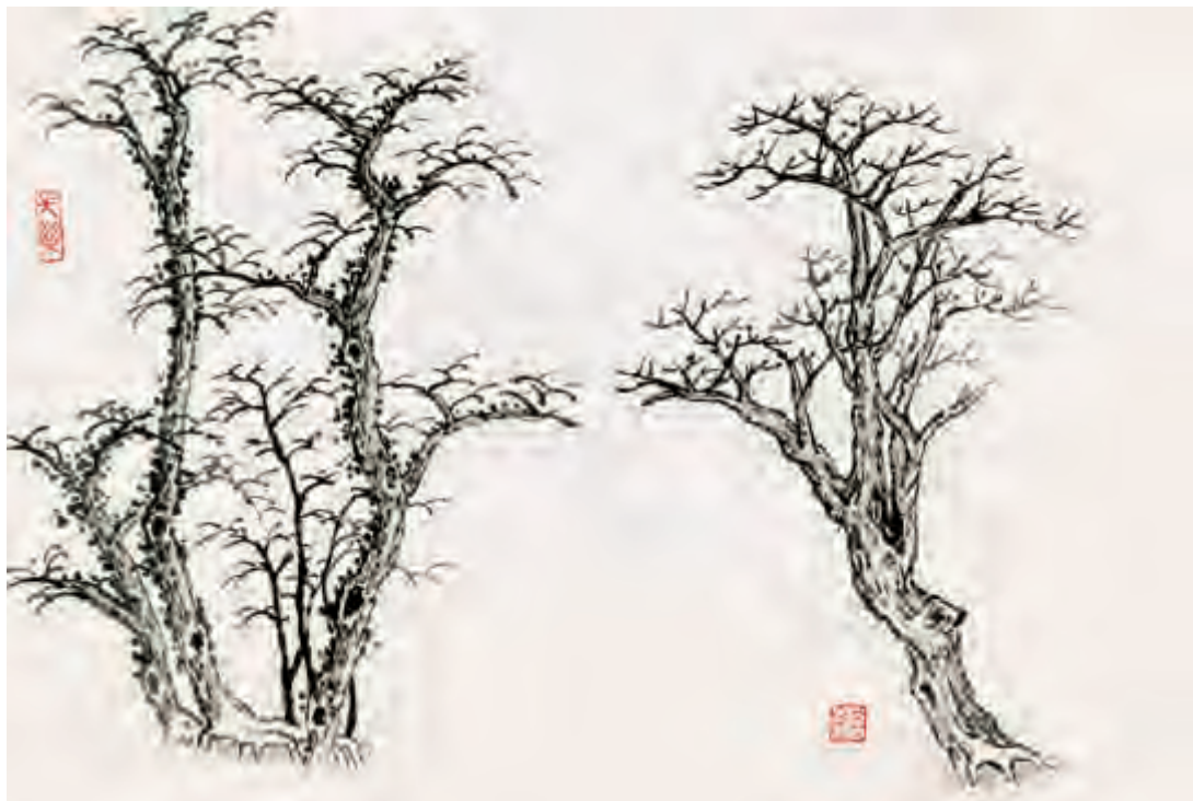
点 笔 皴