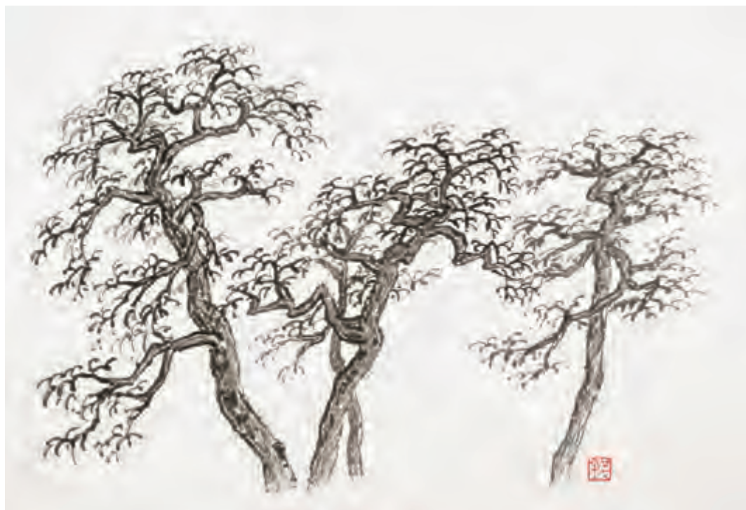
蟹 爪 枝