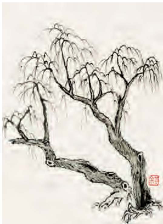
直 笔 皴