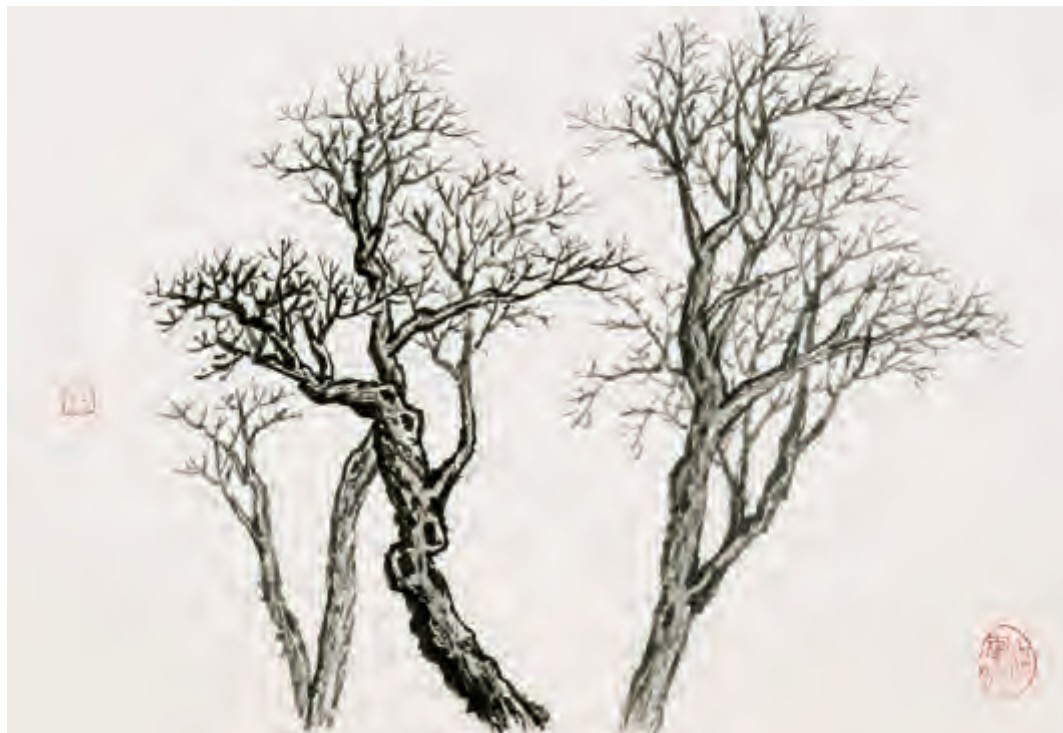
鹿 角 枝

蟹爪枝，顾名思义，树枝形状像螃蟹爪，树枝向下生长。画蟹爪枝，讲究用笔锋，要悬笔、悬肘、悬腕，笔尖如同针一般，笔尖向下，用墨较重，运笔刚劲有力。