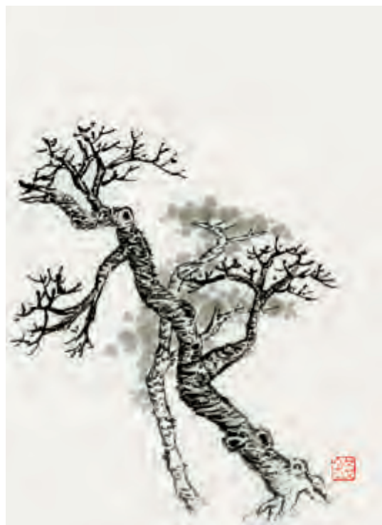
横 笔 皴