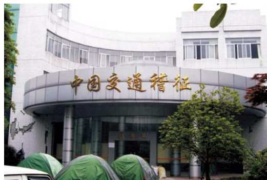
特大地震后的都江堰市稽征所。