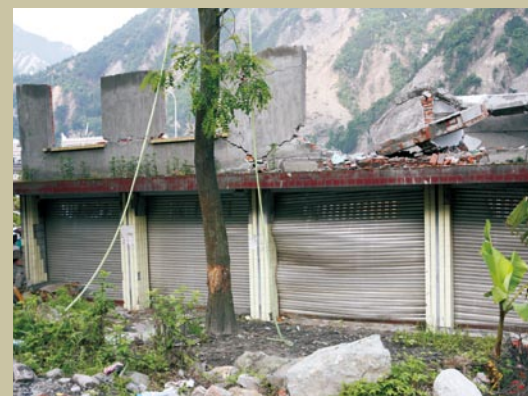
特大地震后的阿坝州原卧龙稽征所。