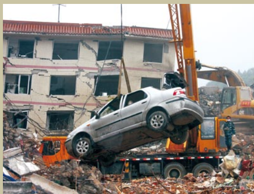
局（总队）组织人员在阿坝州卧龙稽征所施救。