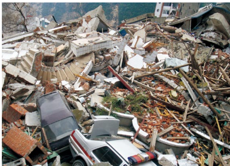
特大地震后的绵阳市北川县稽征所办公楼被夷为平地。