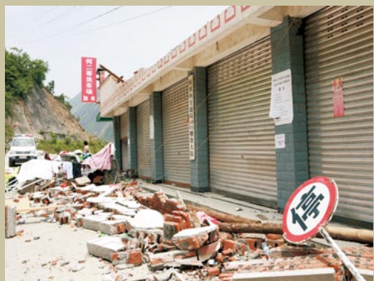
特大地震后的阿坝州稽征处稽查大队。