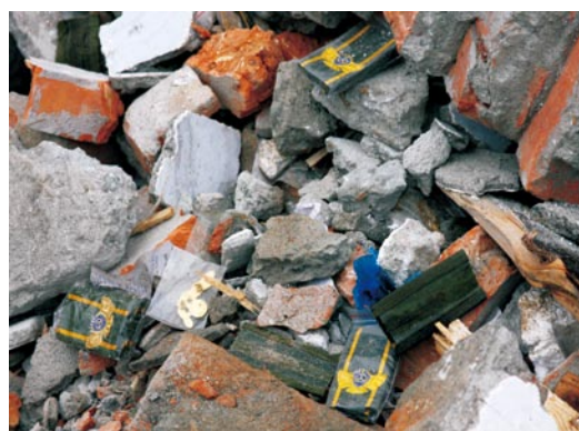
断垣残壁中的稽征徽标。