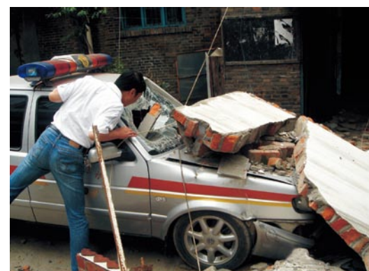
广元市青川县稽征所受损的执法车。