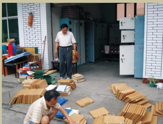
绵竹市稽征所职工在危房中清理档案。