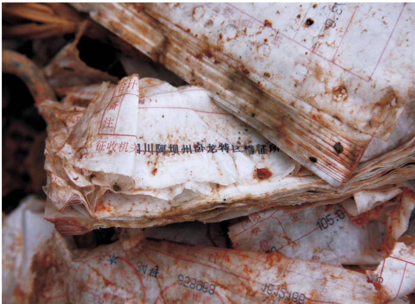
废墟中的稽征档案。