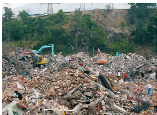
曾经的家园不复存在。