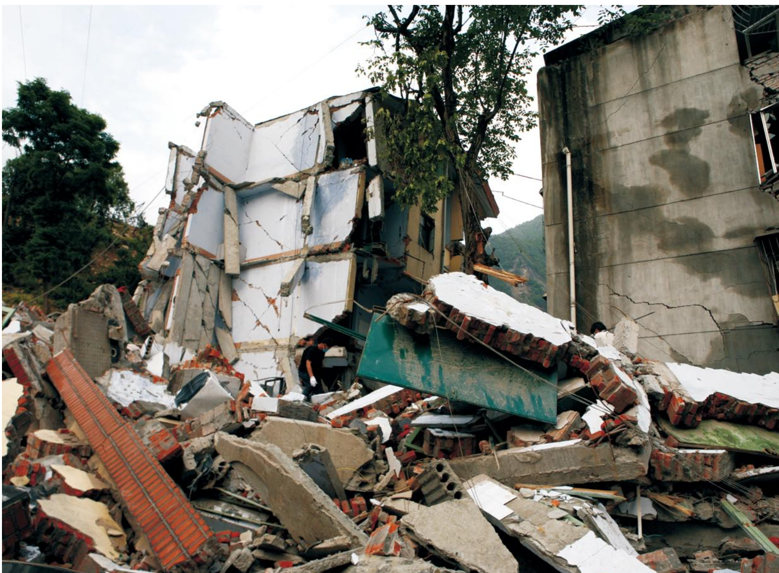
特大地震后的阿坝州卧龙稻征所宿舍受灾现场。