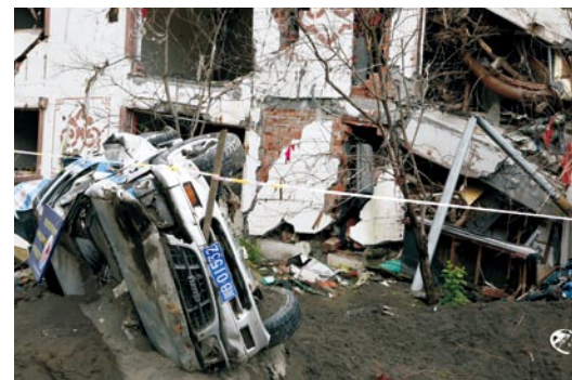
特大地震后损毁的执法车。