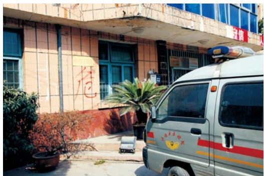
特大地震后的雅安市汉源县稽征所。