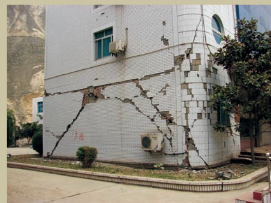
特大地震后的阿坝州稽征处办公大楼。