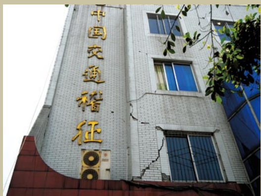
特大地震后的绵竹市稽征所办公大楼。