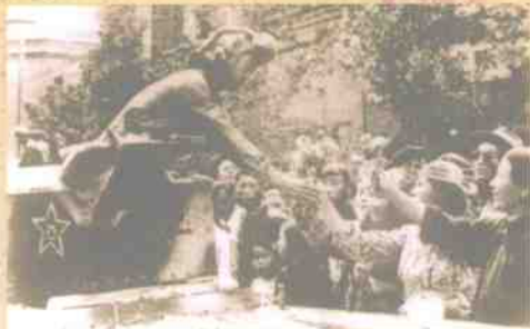
BUNENG WANGQUE DE JIYI DANGAN ZHONG DE GUSHI