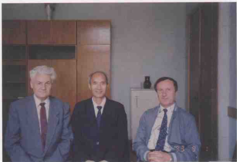
和乌克兰汉学家合影