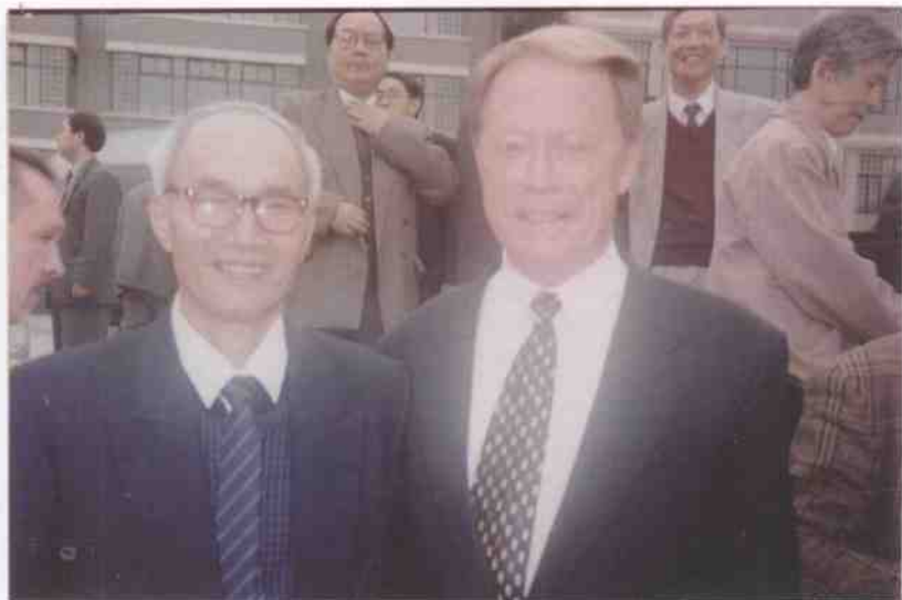
和俄罗斯驻华使节的合影