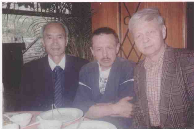
和俄罗斯作家协会领导合影