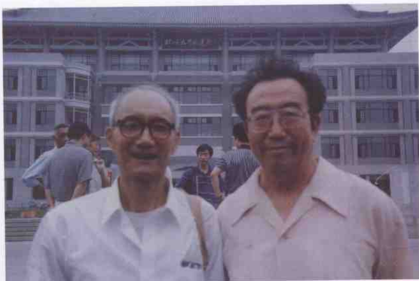
和著名翻译家、画家高莽先生合影