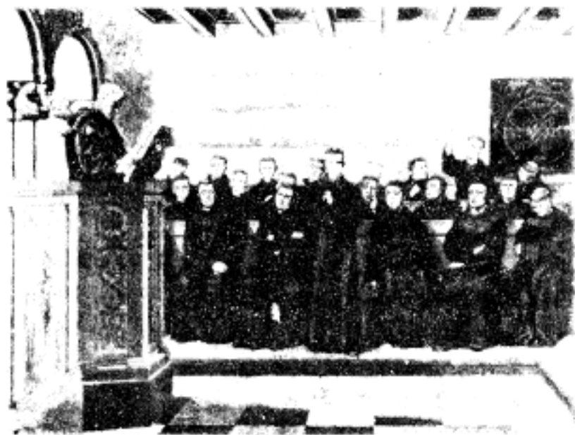
查理曼帝国统治时期的僧院学校上课情景

中世纪的天主教会也是文化的垄断者,它控制了整个中世纪的精神生活。教会制订和解释基督教的教条和教义,建立基督教神学的体系,使它适合封建制度的要求,用它为封建剥削制度辩护,为教会的神权辩护,以便从精神上麻痹和奴役人民。如“原始罪”,“君权神授”,“神权大于王权”,“贫富有命,贵贱在天”等等,都是用来麻痹人民的。但是,基督教教义中也含有一些合理思想,如正义、友爱、谦虚等伦理道德都有善良的教育意义,它既教育了教徒,也教育了一般群众。