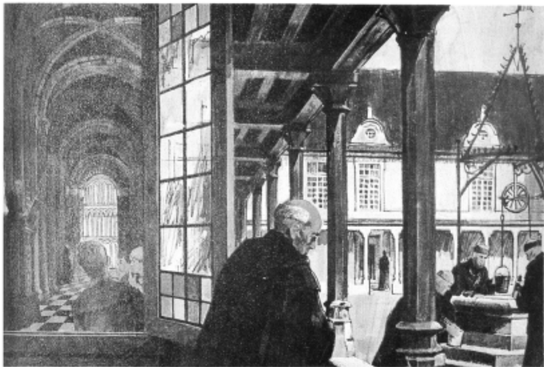
欧洲中世纪修道院中僧侣们的教学活动

在不列颠境内以威塞克斯王国最为强大。威塞克斯国王在坎特伯雷建立了宗教中心,在不列颠建立了强大的罗马教会。众多的传教士陆续从不列颠到欧洲各地建立僧院和学校,从事传教和教育工作。9世纪中期,北欧的维金人侵入英格兰和爱尔兰。僧院和学校被毁,图书馆倒闭,许多教堂变为废墟,学者大量外流。威塞克斯王阿尔弗雷德即位后,整旧图新,提倡教育,鼓励发展学术。他创办宫廷学校,教育王室子弟。宫廷学校的主要课程为拉丁文、本族语、宗教赞诗和文学作品等。阿尔弗雷德王还修复教堂、建立僧院、设置学校,指令主教和祭司推进教育工作。他还组织人力广泛搜集图书资料充实各地图书馆,吸引了众多学者从事各种著述和教育活动。