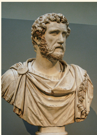
· 玛克斯·奥勒留的养父安东尼·派厄斯雕像

探讨所有需要考虑的事情的优点，这使他绝对不会因为满足于初步印象而停止深入地探究。他能很好地保持友谊，对朋友不会很快厌烦，但也不会放任个人的柔情；他对所有环境都感到满意和愉快；他不会夸显自己的远见卓识。