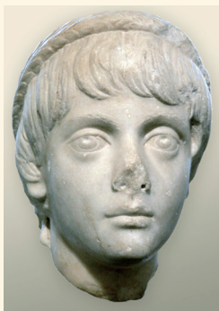
奥勒留的祖父阿厄尼斯·维勒斯年轻时的雕像