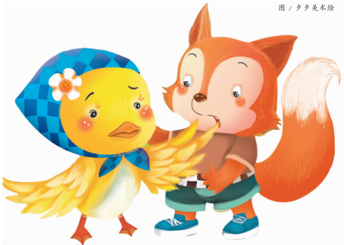
图 / 夕夕美术绘