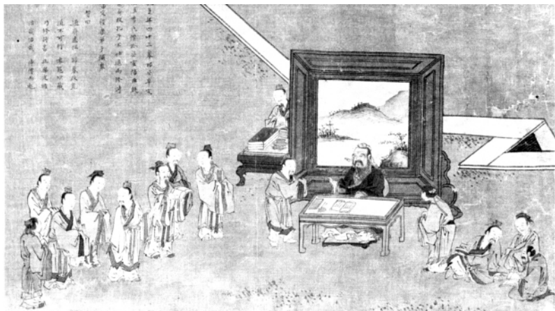
孔子晚年删修《春秋》图

孔丘的主要努力和贡献是在文化教育事业上。他开创“私学”，建立了儒家学派，为春秋战国时期的学术勃兴，开创了道路。他“删诗书、定礼乐、修春秋”，整理并发展了殷周以来的文化，成为中国古代奴隶制文化的重要代表人物。孔丘的著作和私学活动，在中国思想史和教育史上有很重要的地位。当时“官失其守”，开创私学是合乎潮流的，和儒家私学对立的有法家、墨家私学，传说少正卯的法家私学和孔丘的儒家私学相竞争，使孔丘私学“三盈三虚”。墨家的私学，据孟轲说，墨翟之言盈天下，可见墨家私学也很兴盛。