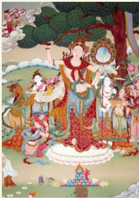
❁ 释迦牟尼出生图（局部）

但是具有独立思考精神的悉达多太子并未按照他父亲的愿望成长。舒适优越的生活条件并未使他陶醉而消磨忧患意识，而当时动荡不安的社会状况更令他感到困惑，现实人生中的生、老、病、死等种种痛苦和烦恼现象，反而使他感悟到世事的无常和人生的变幻莫测，引起他的感触和深思。为了摆脱那些束缚人的精神和肉体的种种烦恼，得到完全彻底的自由和解脱，