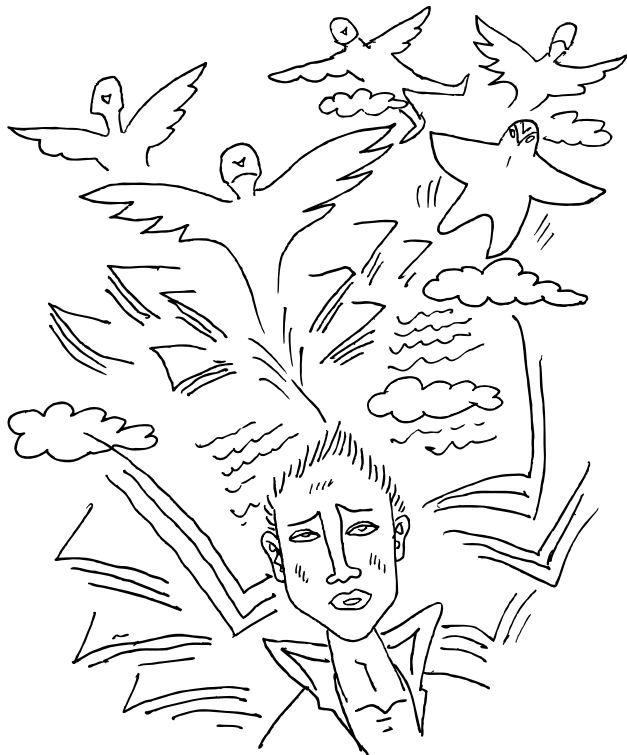
1-1 进了大学的门槛，怎么忽然有种“失重”的感觉呢？

其次，在全新的大学环境中大学生很容易出现环境的适应障碍。从大学生的心理需求来讲，随着自我意识的觉醒，大学生更加期待着被肯定、被信任，期待着更多自我展现的机会。同时大学生还会更加期待群体中的归属感、寻求异性间的情感体验。与此同时，大学生所承担的社会角色也更加复杂，期望自己是父母未来的寄托、老师认可的好学生、受同学拥戴的领袖、女孩眼中的王子。可以说大学生都是满怀着对大学时光的憧憬走进大学校门的，但是从“两耳不闻窗外事，一心只读圣贤书”的高中时代，一朝迈进这个多元文化价值观磨砺碰撞的校园，面对新的集体、新的生活方式、新的学习特点，一切都得靠自己面对处理时，一些大学生内心深处便产生了恐慌和对新环境的不接受。加之自理能力的不足、理想和现实的反差以及在人际交往、现实认可、生活适应乃至学习中遇到一点挫折或不快都可能使他们感到茫然无措，并由此产生失意、自卑、孤独、焦虑等心理问题。