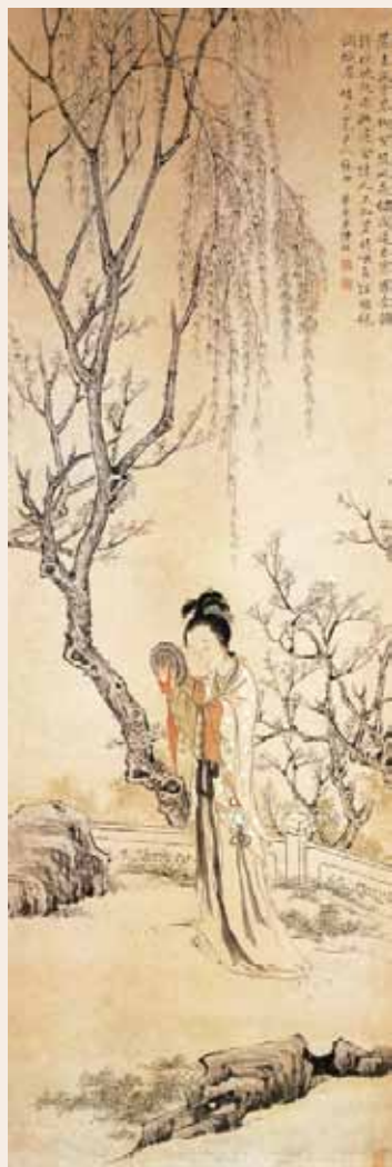
○ 柳下晓妆图 清·陈崇光

佛祖借这个譬喻来笑那些邪门外道的人不辨真伪，固执于假象或迷途，所以，即使得到了正知正解，也不能信受奉行。窃以为，道理是真，但比喻有失妥当，佛法岂能如同荡妇？若只言小潘之真，则难免有断章取义之嫌了。