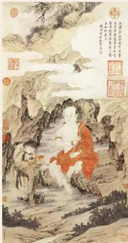
○ 罗汉图 清·金廷标

看来，最可怜的要数那头小牛犊了，人没喝到牛奶倒是小事，只是苦了它忍饥挨饿一个月，何其无辜啊！