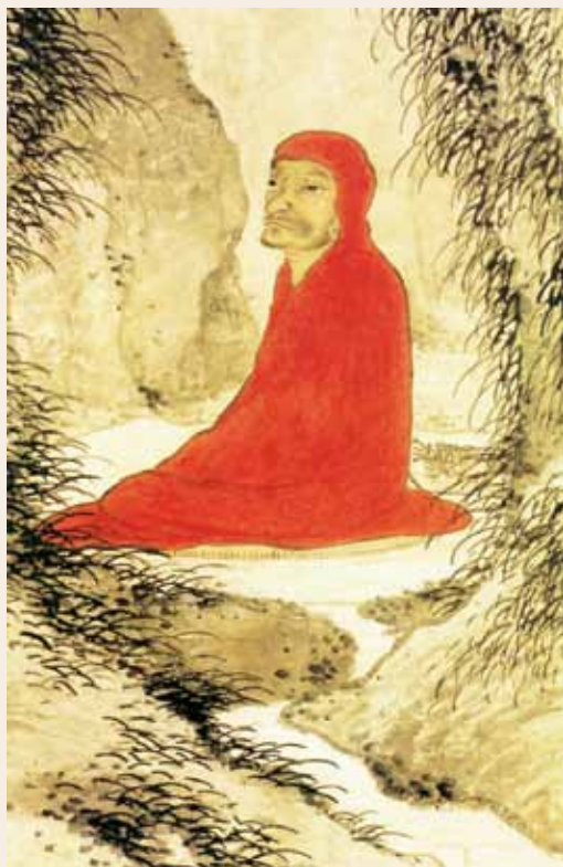
○ 达摩面壁图（部分） 明·宋旭