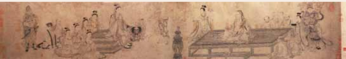
○ 维摩演教图 北宋·李公麟

于是这些外道豁然开朗,心悦诚服,立刻向佛祖请求皈依佛门受戒,当下证得小乘初果,回到座位中去。到此,佛祖便开始说道:“刚才一幕都看到了吧。你们都好好听着,我现在给你们上一堂故事课,讲讲一些人的一些事情,通过讲解这些事情,你们会有所领悟。”接下来便引出了书中的那些比喻故事。