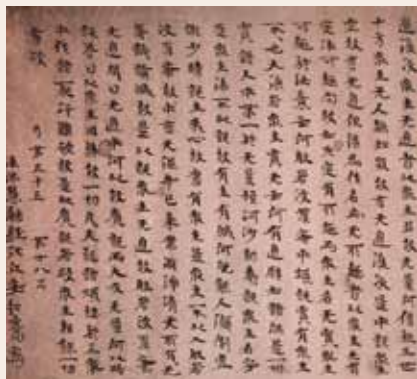
○ 写经残卷（部分） 南北朝·安弘嵩