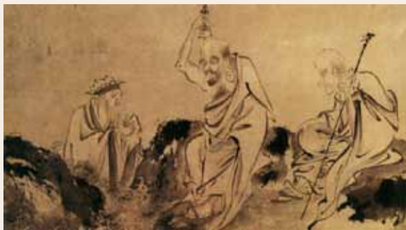
○ 罗汉图(部分) 佚名

有的,你怎么说有呢?”答道:“存在的就说有,灭亡的就说没有。”又问:“人从哪里来?”答道:“从五谷而来。”又问:“五谷从什么地方来?”答道:“从地、水、火、风四大元素而来。”又问:“四大元素从哪里来?”答道:“从空而来。”又问:“那空呢,从何而来?”答道:“空从无中产生。”又接着问:“无又是从哪里来的?”答道:“自然而生。”又问:“那自然呢?”答道:“自涅槃中生。”再问:“涅槃又从哪里生?”