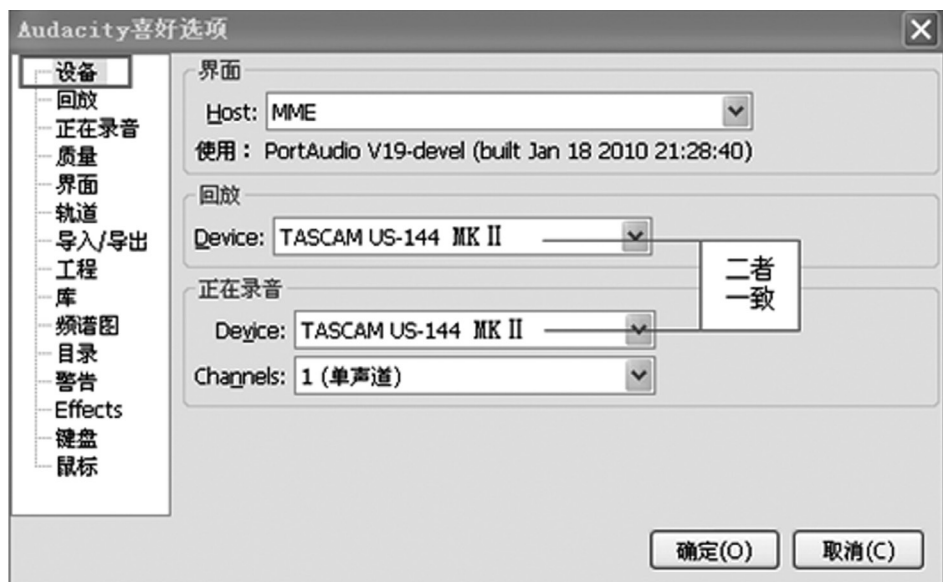
图 2 设置录音设备（器材方案②）

使用“器材方案②”时，点击“设备”，确认“回放 Device”和“正在录音 Device”均为 TASCAM US-144MKII，“Channels”选择“单声道”。(参看图 2)