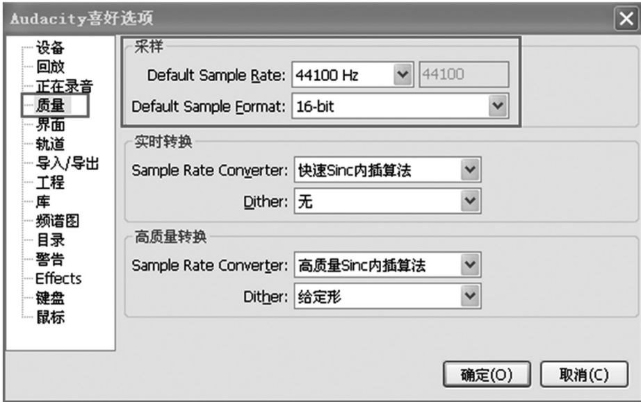
图3 设置采样率和采样精度

点击“质量”，在“采样”右侧下拉菜单中分别选择“44100Hz”和“16-bit”。(参看图3)