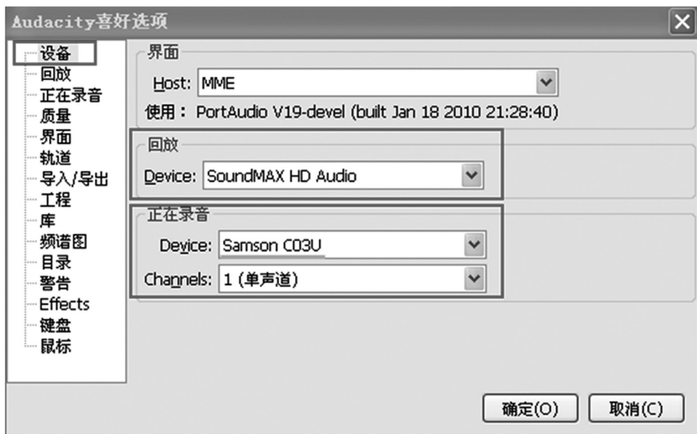
图 1 设置录音设备（器材方案①）

卡，“正在录音 Device”为 Samson C03U(系统会自动调用，无需设置；如果找不到 Samson C03U，可重新启动操作系统或卸载其他外置声卡的驱动；保险起见可将电脑自带的其他录音设备全部停用)，“Channels”选择“单声道”。(参看图 1)