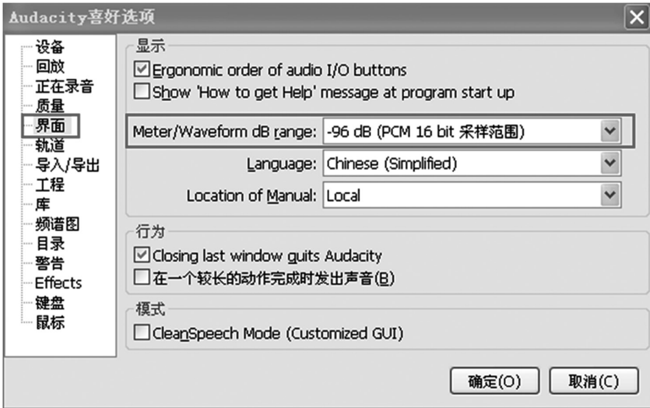
图4 设置音量动态指示范围

点击“界面”，在“Meter/Waveform dB range”右侧下拉菜单中选择“-96 dB (PCM 16 bit 采样范围)”。(参看图4)