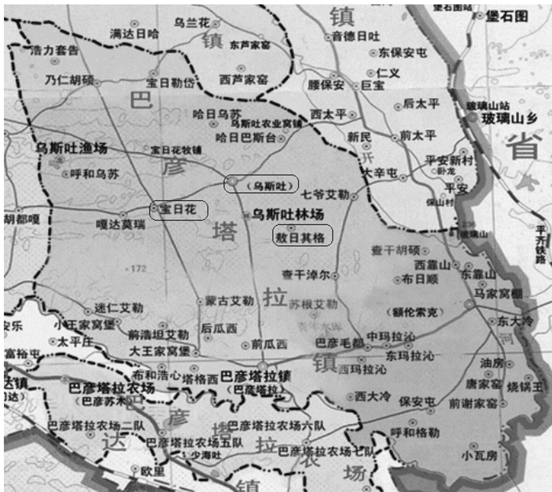
图1—4:巴彦塔拉镇地图