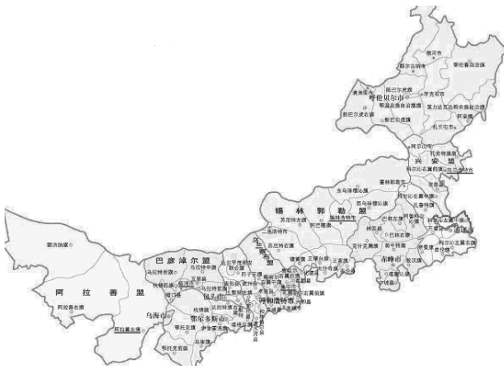
图 1—1: 内蒙古地图中的科左中旗

这里是清朝国母孝庄文皇后的故里,民族英雄嘎达梅林的家乡,也是著名的民歌之乡、版画之乡,以版画、民歌、马头琴为代表的璀璨民族艺术已走向世界,国际马头琴大师齐·宝力高就出生在这里。这里民风淳朴,独具草原风情的 8·18 哲里木赛马节每年在珠日河草原旅游区举办。